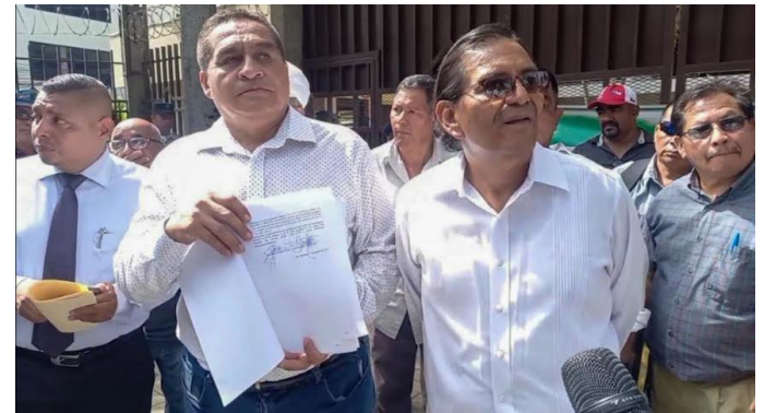
La Alianza Nacional El Salvador en Paz presentó a la Corte Suprema de Justicia (CSJ) un recurso de inconstitucionalidad contra el decreto 762, sobre la reestructuración de 262 a 44 municipios.

“Estas son las nuevas ideas del señor Bukele, retomaron la ley de 1879 que se llama El Régimen Político del Estado, que en ese momento determina los 44 municipios y el resto de distritos; en la Constitución de 1983 se estable-