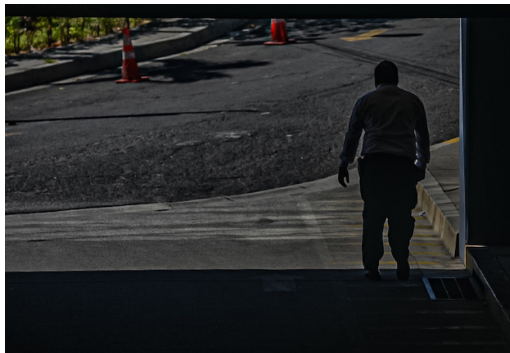
Personal de la Asamblea Legislativa tendrá 15 días para presentar la constancia policial y penal a fin de que confirmen que no tengan relación con pandillas.

“He girado instrucciones para que todo el personal de la Asamblea presente, nuevamente, su constancia de antecedentes policiales y penales. Repito: todo el personal. Incluyendo departa-