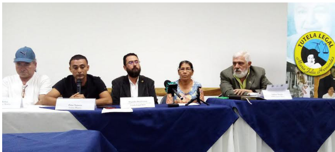
Organizaciones sociales que acompañan a la Comunidad Santa Marta y ADES, Cabañas, denuncian la falta de respuesta del Estado de El Salvador, ante la CIDH, en el caso de la detención arbitraria de cinco ambientalistas y líderes comunitarios de esta comunidad rural.

El caso ADES - Santa Marta, por parte de la defensa, ha recibido múltiples reveses en la justicia interna salvadoreña en donde la Fiscalía General de la República y el Sistema Judicial, específicamente el Juzgado de Paz de