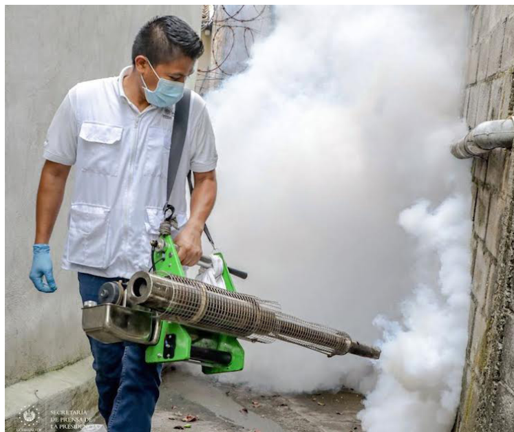
La Organización Panamericana de la Salud (OPS), propusieron “expandir las herramientas para detectar y vigilar las enfermedades transmitidas por mosquitos en las Américas”.

Más de 35 laboratorios nacionales de toda la región, así como asesores técnicos y centros colaboradores de la Organización Mundial de la Salud (OMS) revisaron las formas de como ampliar las vigilancias genómicas y entomoviológica de los principales arbovirus ( virus transmiti-