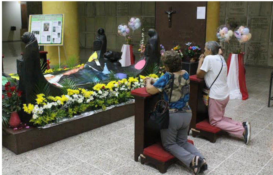
En la cripta de Catedral Metropolitana, descansa el cuerpo del Obispo mártir Oscar Arnulfo Romero, asesinado por sectores radicales de derecha el 24 de marzo de 1980.

tomaba a bien el cariño que el pueblo le tenía. Hoy muchos saben que él, les agradece desde el cielo, y acompaña su andar.