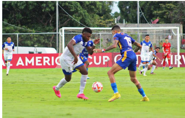
Jocoro cae ante Universitario en la Copa Centroamericana de CONCACAF.

En primera instancia, Jocoro cayó 4-1 en su casa, ante Universitario, y sumó con ello 12 goles en contra en los tres partidos que ha disputado y 2 a favor. El equipo se mantie-