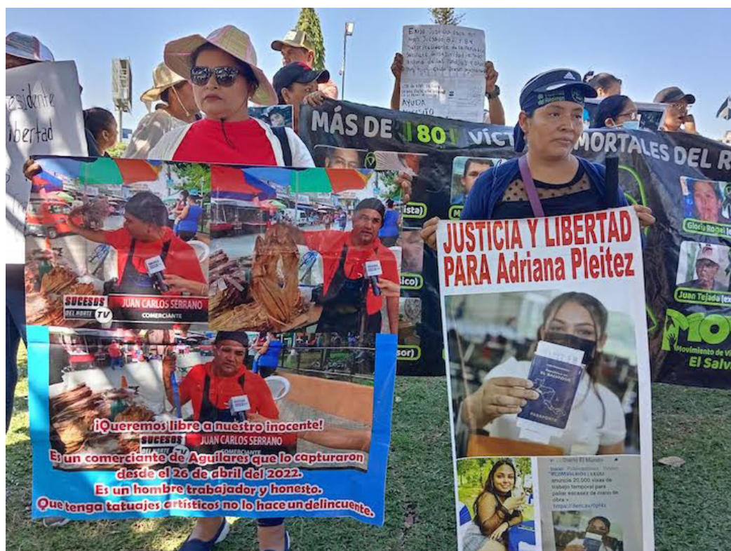
Madres y familiares se unen en la búsqueda de la libertad de sus hijos e hijas y para denunciar las injusticias del régimen de excepción.

La incertidumbre y denuncia de los familiares que se aglutinan en el MOVIR se incrementa por los fallecimientos de las personas bajo custodia del Estado salvadoreño. “Es gravísimo que 170 personas