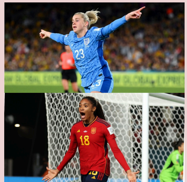
España e Inglaterra se enfrentarán en la final del Mundial Femenino 2023 pero solo una levantará la copa.

En los cuartos de final eliminó a una empoderada Colombia que llegó hasta dicha instancia por primera vez en la historia y también como la única de Latino-