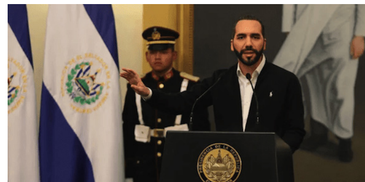
Nayib Bukele anunció el 15 de septiembre del año pasado que competirá para un período presidencial más, pese a estar prohibido por Constitución.

Bukele fue electo candidato presidencial de Nuevas Ideas el 9 de julio.