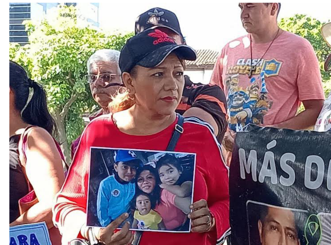
En la marcha y protesta se muestran fotografías de hijos e hijas inocentes que de manera arbitraria han sido detenidos.

Mientras, sobre la intención de realizar “audiencias masivas”, Ramírez, consideró una aberración al debido proceso que luego de