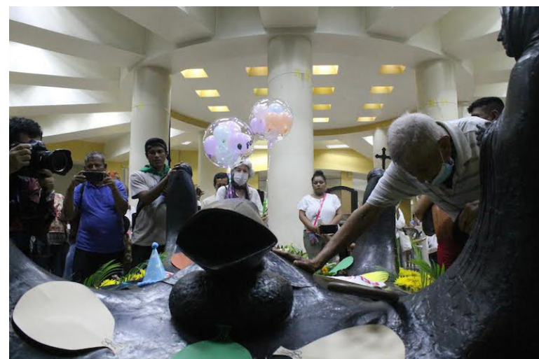
En su mayoría quienes asisten a la cripta cada año, son hombres y mujeres humildes, muchos le conocieron en vida, y llegan para dar gracias a Dios, y a pastor por los favores recibidos.

critas sus homilías. “Yo quiero agradecer, pues, todas las manifestaciones de amistad y de solidaridad que con esa ocasión me brindaron y las recibo como obispo y pongo a los pies de Cristo, pues, todo este homenaje para que todo redunde en su gloria. Por la fineza y la ternura del mensaje...”, expresó Mons. Romero, en la homilía del 21 de agosto de 1977, luego de agradecer las felicitaciones que recibió por su natalicio número 60, cuando en vida modestamente