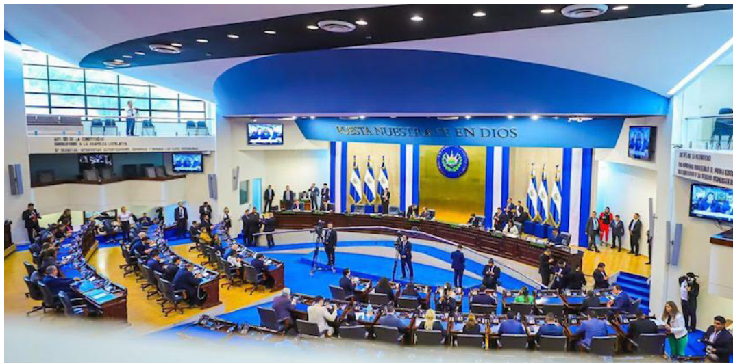
Asamblea Legislativa autoriza al Gobierno que emita títulos valores por un monto de 500 millones de dólares.

En el decreto se mencionó que los fondos obtenidos se destinarán para “atender diferentes