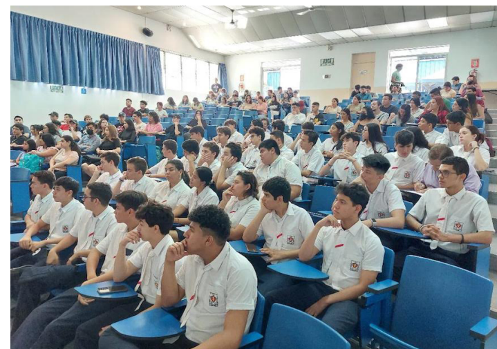
Estudiantes universitarios y de bachillerato del colegio Salvadoreño Español, participan de la actividad, que tenía como objetivo que las nuevas generaciones se interesen por la temática de los indígenas.

"Si el pueblo indígena hubiera sido parte de esos Acuerdos de Paz quizá habría algunas resoluciones a estas alturas, pero la vida política en El Salvador, generalmente, ha excluido al pueblo indígena desde un inicio, desde la creación de la República. Yo creo que los espacios para conocer y ahondar en la realidad del pueblo indígena, hoy día son pocos, pero hay que crearlos", considera Flores, y remarca que "una forma de hacerlo es precisamente el cine, y lo que se busca es una reparación, y que todos seamos partícipes de ese proceso de reparación porque es una deuda cultural, política y económica, y no digamos de las tierras, esas tierras usurpadas en el 32', en definitiva tienen que ser resueltas o buscar una forma de cómo resolverlo", concluye.