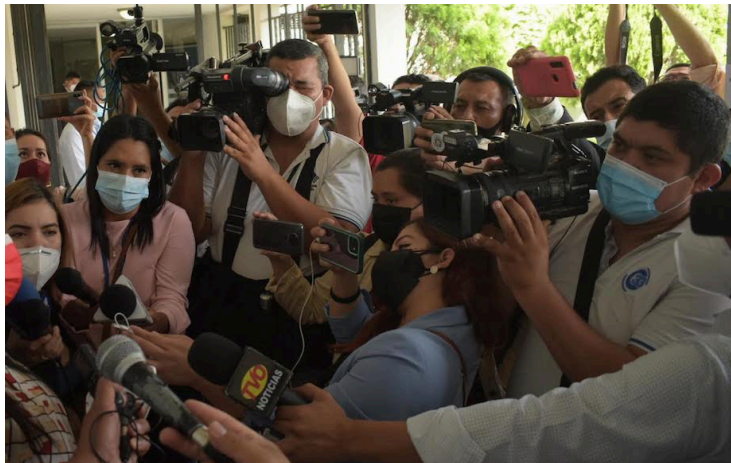
La APES condena que el presidente de la República, Nayib Bukele, intente criminalizar la labor periodística.