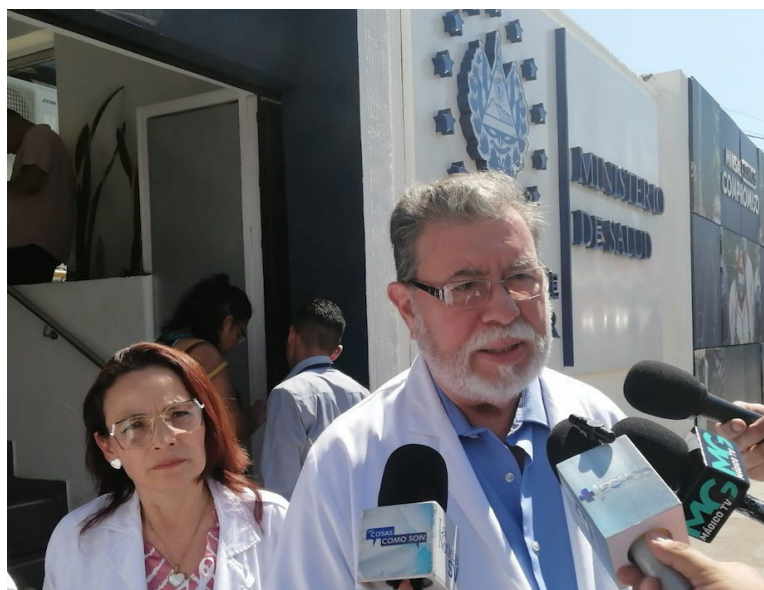
Para resolver los problemas de doctores graduados y estudiantes suspendidos de sus puestos, el Colegio Médico entregó al Ministerio de Salud, una solicitud e iniciar un diálogo.

“El problema es desde que dejaron sin plaza a los mé-