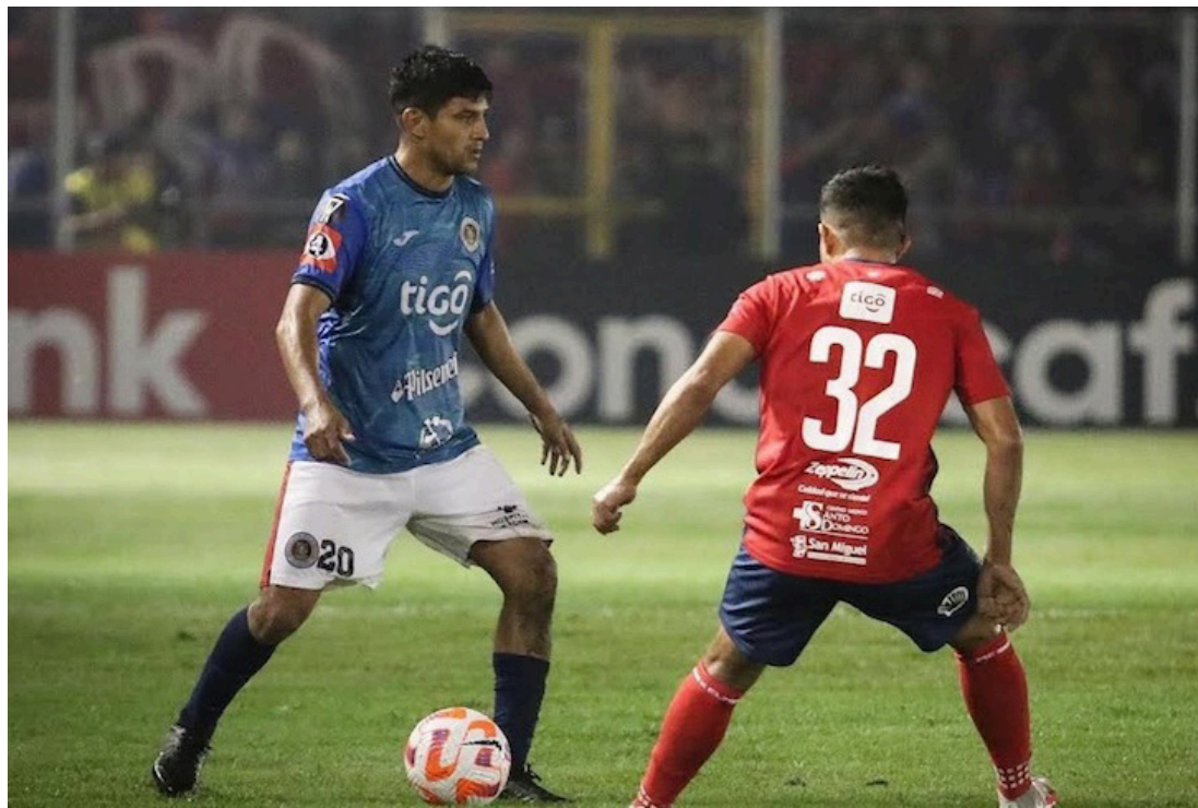
FAS en el partido debut de la Copa Centroamericana de CONCACAF ante Xelajú de Guatemala.