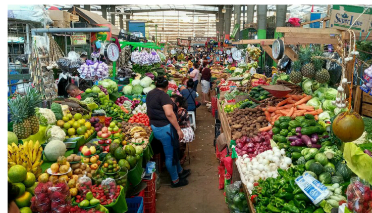
Los salvadoreños cada día se enfrentan a no poder adquirir alimentos saludables, por el encarecimiento de estos y la falta de producción de otros como los insumos agrícolas.

Detalló que el precio de la canasta básica ronda los $250, pero el salario mínimo actual no al-