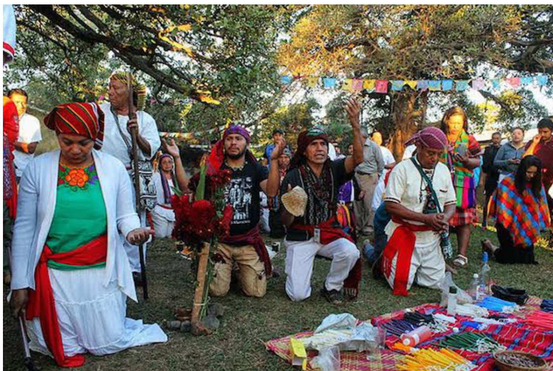
Las poblaciones originarias conmemoraron este 9 de agosto, el Día Internacional de los Pueblos Indígenas, decretado por Naciones Unidas.

Las poblaciones originarias conmemoraron este 9 de agosto,