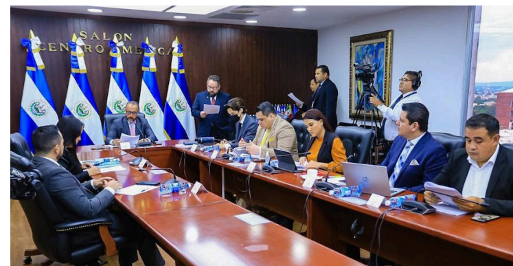
Comisión especial de antejuicio sesiona por primera vez y queda abierta permanentemente.