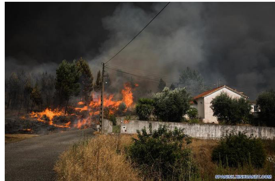
Uno de los incendios, que se declaró el viernes en la localidad turística de Portbou (provincia de Girona, noreste), destruyó unas 600 hectáreas de matorral y bosque.