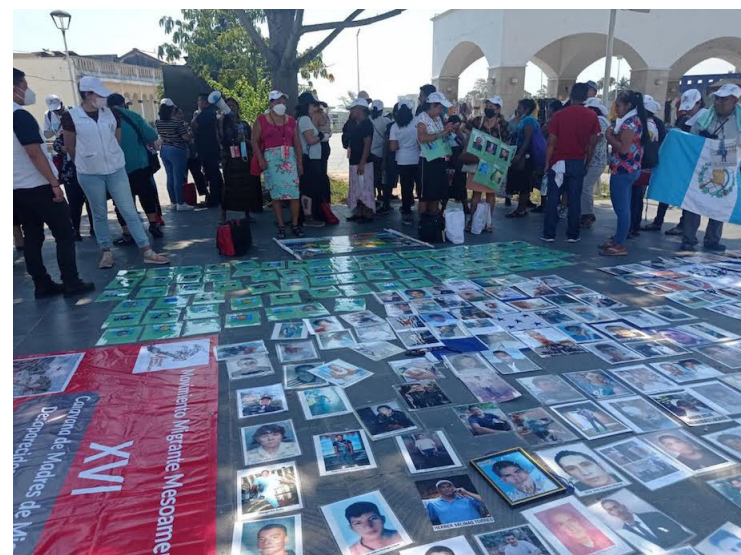
COFAMIDES cuenta con un banco de datos genético, y se ha logrado la identificación de 80 migrantes que fueron víctimas.

Destacado La decisión de presentar una iniciativa de ley, ante la Asamblea Legislativa, es obtener respuestas de las demandas y prioridades de este sector vulnerable de la población salvadoreña, que se enfrentan a violaciones en sus derechos cuando emigran.