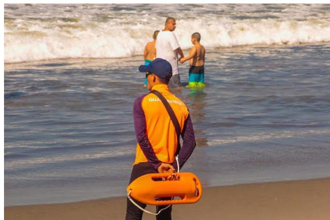
Protección Civil, mantiene vigilancia en las playas del país, reportando 49 rescates acuáticos, entre el 29 de julio hasta el 5 de agosto de 2023.