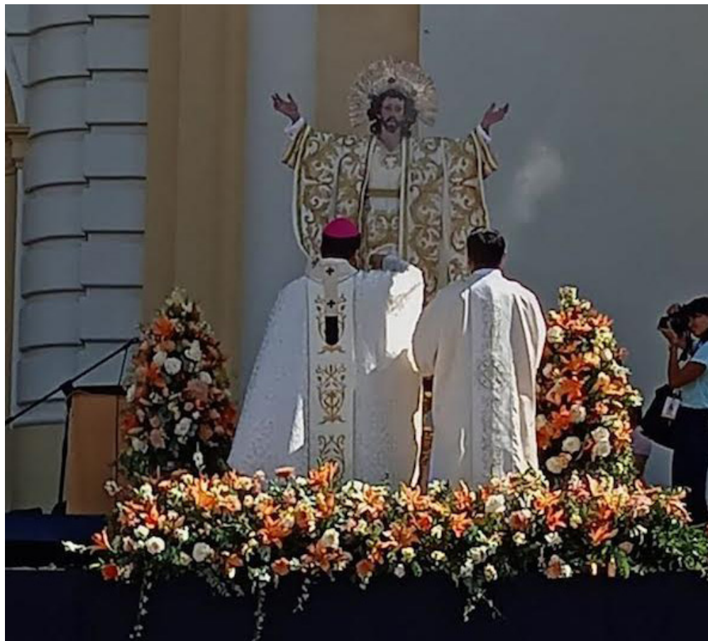
La celebración litúrgica que marcó la finalización de las fiestas al Divino Salvador del Mundo, patrono del país, se realiza en catedral metropolitana, junto a miles de feligreses salvadoreños.

Asimismo, citó homilias de San Oscar Romero, sobre la injusticia, el ocultamiento de la verdad y el deber de la iglesia con los más vulnerables. También retomó las reflexiones del papa Francisco sobre los pobres y su relación con Jesucristo, en cuanto a construir una sociedad más justa y solidaria.