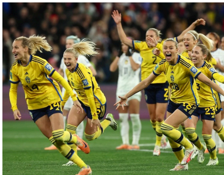
Por primera vez en la historia del Mundial Femenino, Estados Unidos es eliminado en octavos de final. Y fue Suecia quien hizo la hazaña.

El polémico partido favoreció a Suecia, y con ello el pase a los cuartos de final, en donde se enfrentarán a Japón. Las suecas resistieron el marcador de 0x0 en el tiempo regular y en el complementario. La serie fue una de las más intensas, y llenas de suspenso pero las suecas