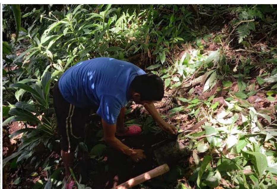
Mujeres, hombres y niños participaron del proceso de reforestación y abono del bosque que resguarda el manantial del cual se abastecen, a fin de minimizar los impactos de la sequía y deforestación.