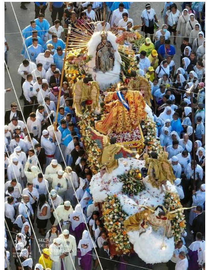
La fiesta en honor al Divino Salvador del Mundo, es de las más esperadas por los salvadoreños, ya que el 5 de agosto se realiza la transfiguración, conocida como “bajada”.