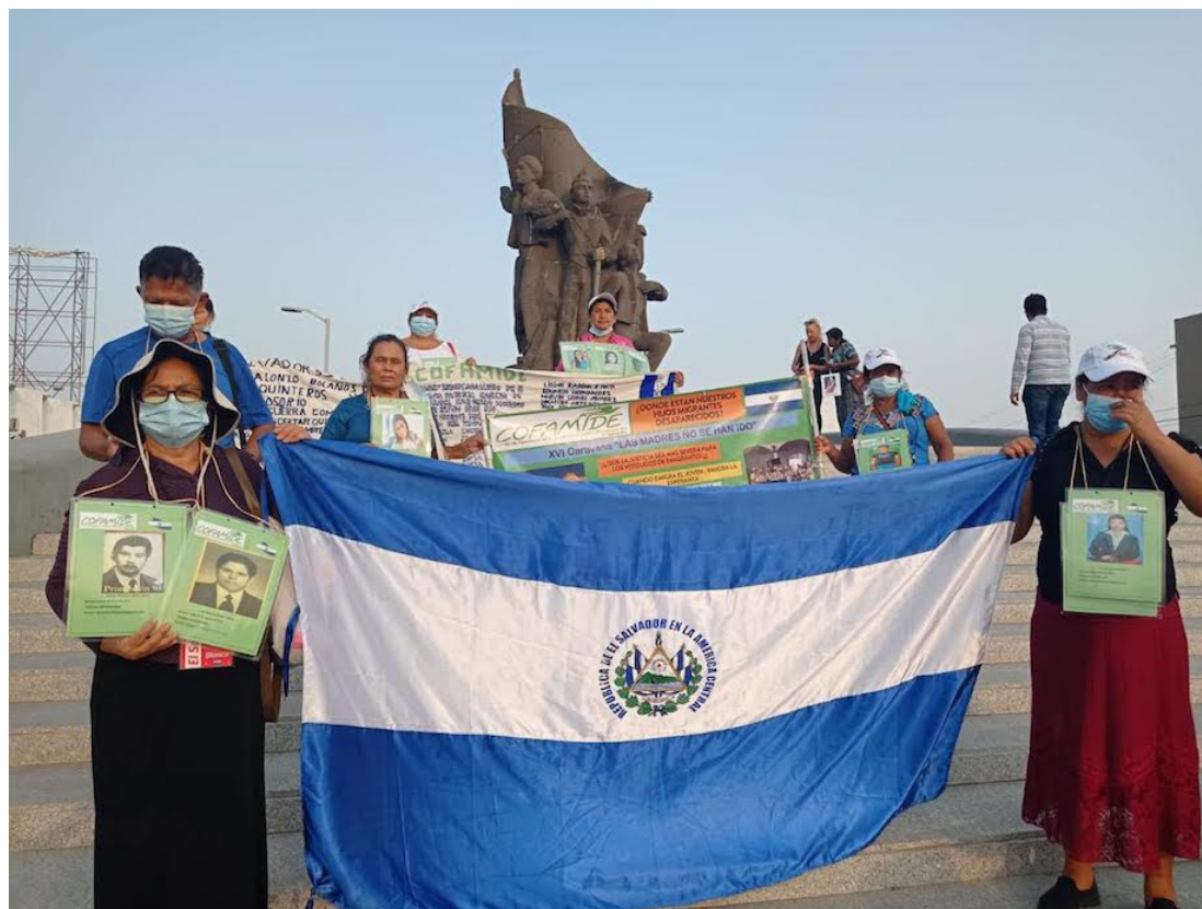
Las Madres Centroamericanas que buscan a sus hijas e hijos en la Ruta del Migrante, han realizado diferentes protestas, para denunciar las desapariciones de sus hijos.

problemática que por muchos años no se le dio importancia, y era la búsqueda de migrantes fallecidos y desaparecidos, porque antes sólo les interesaban los migrantes que lograban llegar a territorio estadounidense y enviaban remesas, no a los migrantes en tránsito.