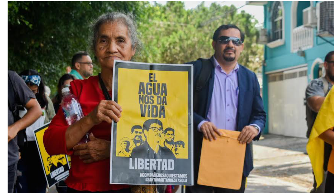
La comunidad demandó que por legalidad y por humanidad, los líderes comunitarios sean excarcelados de forma inmediata para que reciban la atención médica requerida.

En ese contexto, la comunidad demandó que por legalidad y por humanidad, los líderes comunitarios sean excarcelados de forma inmediata para que reciban la atención médica requerida con urgencia y se concrete el arresto domiciliario ordenado