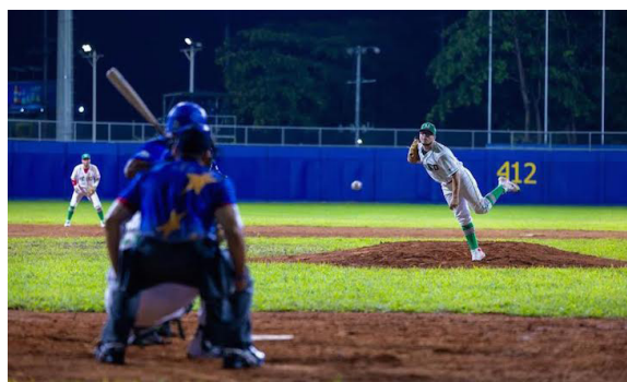
Tres atletas que participaron en los Juegos Centroamericanos y del Caribe San Salvador 2023 dieron positivo a casos de dopaje.