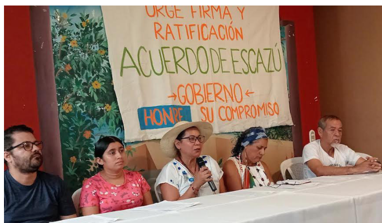
Organizaciones sociales, territoriales y comunitarias, a escala nacional exigen al gobierno la adhesión del país al Acuerdo de Escazú que permite acceso a la información pública, la participación, la contraloría social y el reconocimiento de las personas defensoras en materia de medio ambiente.

“Hemos venido documentando en El Salvador, a raíz de las visitas territoriales y el acercamiento que hemos tenido con las comunidades de conocer ¿cuál es la situación ambiental que se está enfren-