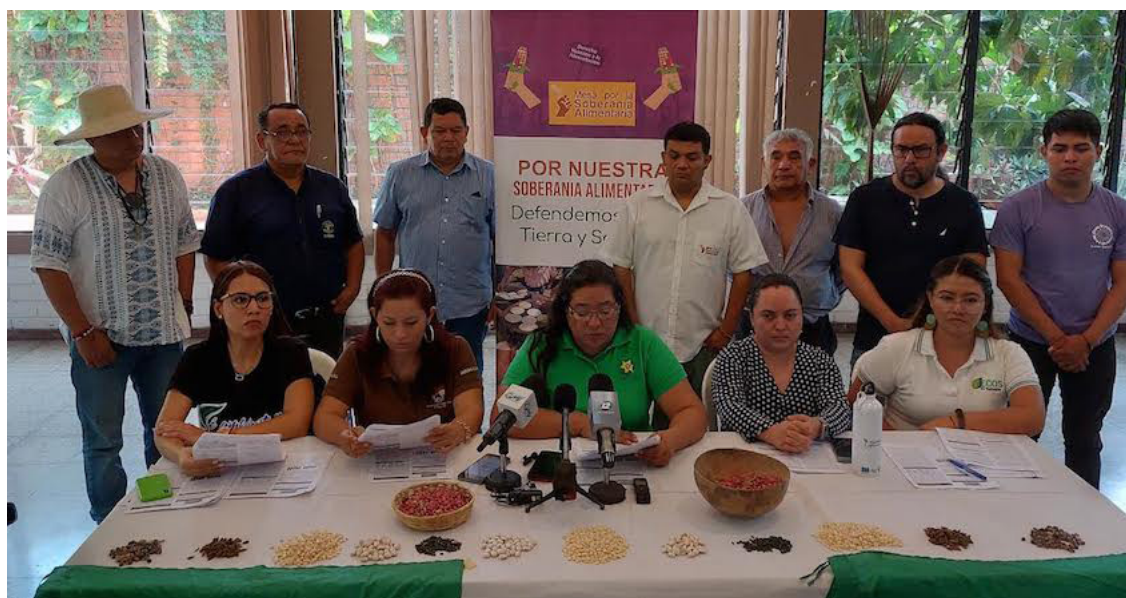
Las organizaciones que integran la Mesa por la Soberanía Alimentaria se pronuncian ante la creciente crisis alimentaria, reflejada en el alto costo de la Canasta Básica, y que afecta a 1.8 millones de salvadoreños en pobreza este 2023.

“Los alimentos que tuvieron incremento en sus precios entre el 2019 al 2023, son: frijol (81%), pan (44%), Grasas (40%), Tortilla (34%), frutas (29%), leche (27%), huevos (19%), verduras (14%), carnes