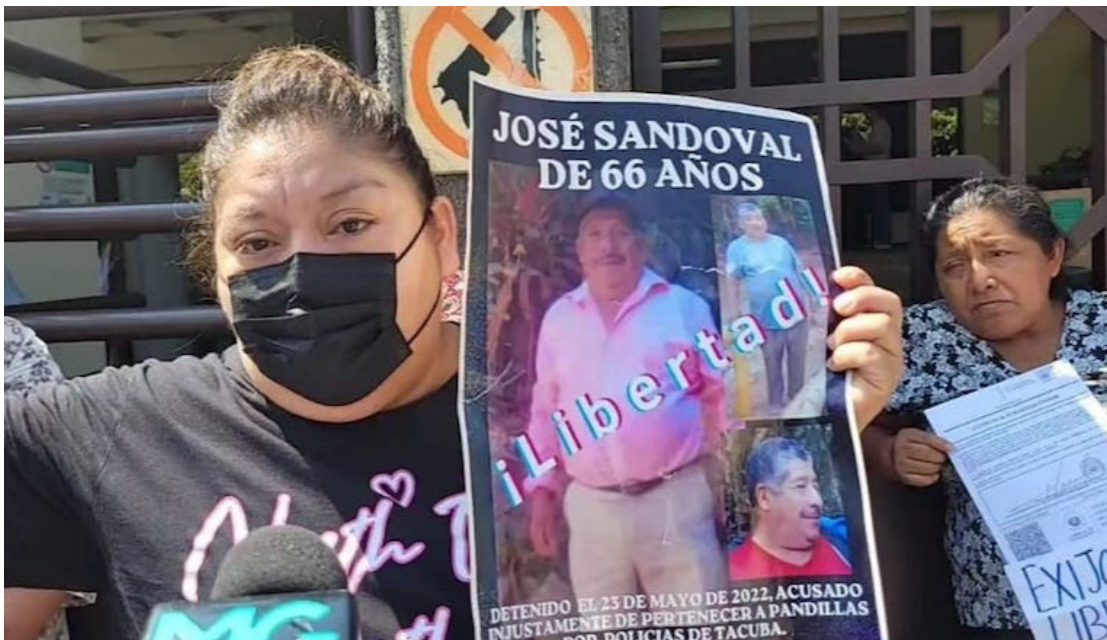
MOVIR y Socorro Jurídico Humanitario presentan una demanda de inconstitucionalidad, por autorizar 2 años más de investigación a los capturados bajo el Régimen de Excepción y la no individualización de los casos.