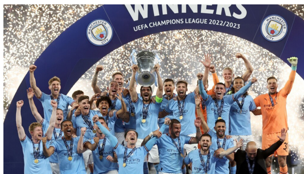
El Manchester City se consagra campeón de la Champions League de la edición 2022-23.

Todo listo. La UEFA Champions League reveló todos los detalles para la fase de grupos de la edición 2023-2024, en la que participarán 32 equipos por la Copa de Europa. Todos los detalles sobre los grupos más destacados y las fechas claves, luego del sorteo que se llevó a cabo en Múnich.