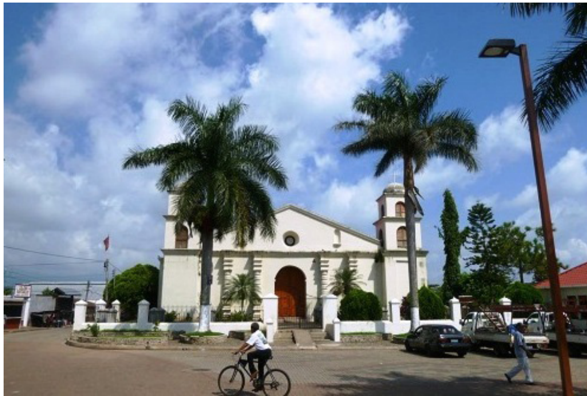
El Movimiento de Unificación Indígena de Nahuizalco (MUIINA), junto a otras organizaciones de occidente denuncian intimidación por parte de agentes de la Policía Nacional Civil (PNC), en contra de líderes comunales indígenas.

El objetivo de la acción, se dijo por parte de los denunciantes, era que los elementos de seguridad querían el Documento Único de Identificación de la madre, de la esposa y de la hermana de la persona que fuera intimidada por las autoridades de seguridad pública. “Al cuestionarles el porqué de tales acciones, los representantes de la PNC guardaron silencio, mientras un soldado expre-