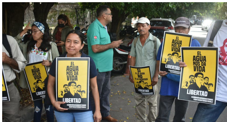
Comunidad Santa Marta exige en las afueras de la DGCP el cumplimiento de la resolución que ordena arresto domiciliario para los líderes comunitarios capturados el 11 de enero de este año.

Los defensores ambientales son acusados de cometer un presunto asesinato en 1989, durante la guerra civil. Sin embargo, las señales en el gobierno de Nayib Bukele de una posible reactivación de proyectos mineros hace pensar que el proceso judicial busca debilitar la resistencia comunitaria al respecto. Lo anterior, tomando en cuenta que los detenidos fueron parte de la lucha por prohibir la explotación de la minera metálica en el país, gracias a una fuerte organización comunal.