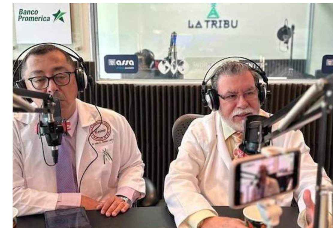
Representantes del Colegio Médico mencionan que desconocen los verdaderos motivos del ministro de Salud, Francisco Alabi, para dialogar.

Montoya denunció que de otros sectores de salud aproximadamente 20 son los despedidos, quienes prefieren el anonimato por temor a alguna represalia, ya que algu-