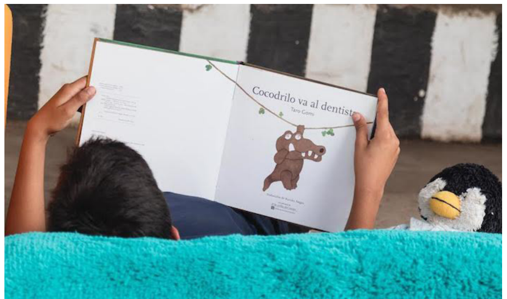
Dentro de este programa se desarrolla el proyecto: “Una escuela, mil historias”, que se ha realizado con éxito en Morazán.