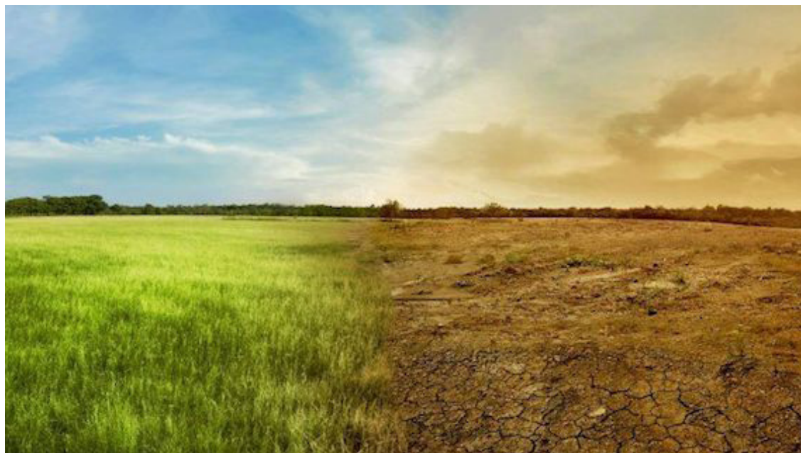
El calentamiento global en El Salvador, ya se está viviendo con la sequía, falta de producción y las elevadas temperaturas.

do de hambre. Hay cerca de un millón o más de personas que están en situación de hambres es decir, desnutrición severa y esos problemas no son importante para las personas que están manejando el gobierno actualmente”, expresó Martínez. A esta situación, Martínez, se suma “cierta enajenación” de las emociones de la gente al creer que existe una figura salvadora, cuando realmente se necesita mayor organización e identificación de los problemas que les aquejan en el territorio y demandar al gobierno sus soluciones.