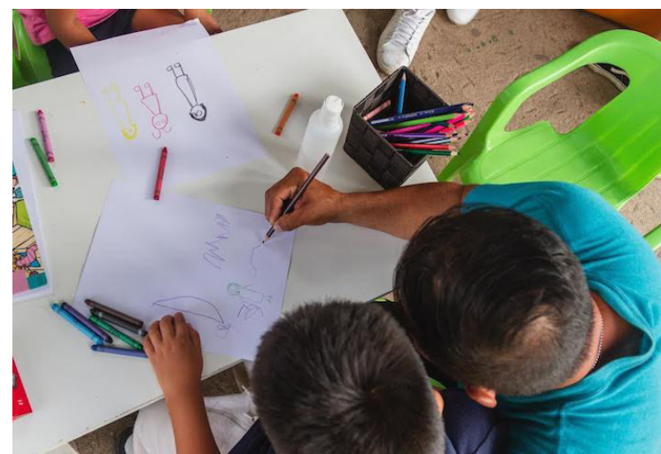
ConTextos impulsa programas y proyectos encaminados a fortalecer el conocimiento, y el abordaje de situaciones, a través de la lectura y la escritura.