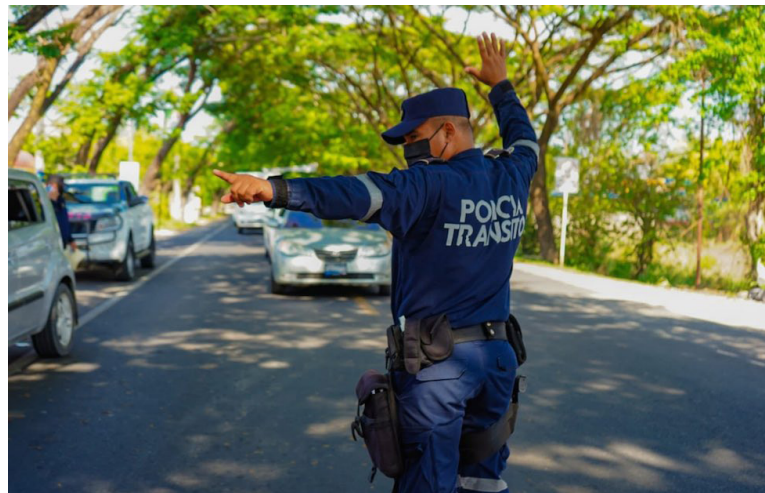
El Plan Vacación Agosto 2023 contempla controles vehiculares y antidoping, para prevenir la accidentabilidad vial.

Mientras que, el Cuerpo de Bomberos de El Salvador contará con 75 inspectores, quienes llevarán a jornadas de verificaciones en restaurantes, con el objetivo de