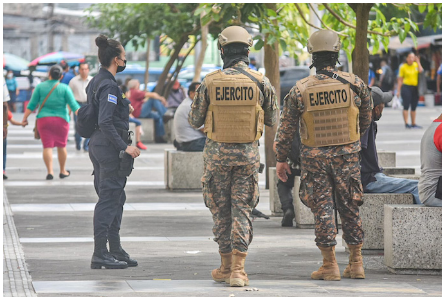
Agentes de la PNC y Fuerza Armada patrullan las calles de San Salvador.