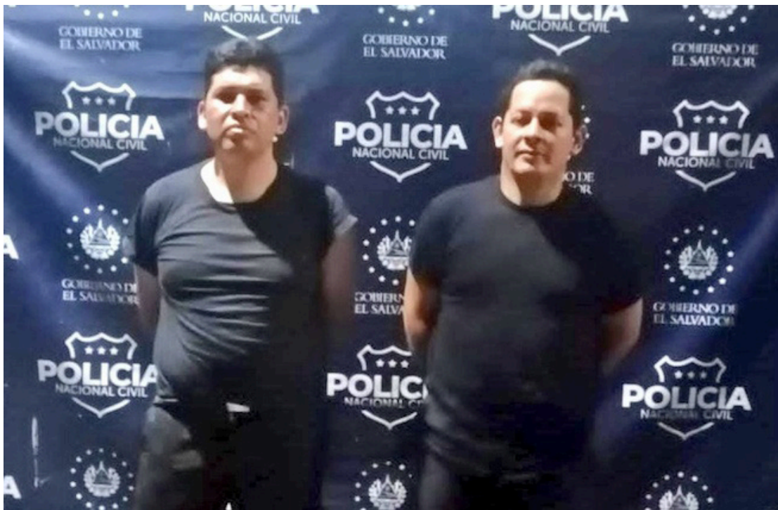
4 agentes policiales fueron detenidos por extorsionar a ciudadanos para no detenerlos.