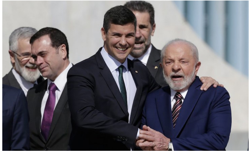
El presidente brasileño, Luiz Inácio Lula da Silva (d), estrecha la mano con el presidente electo de Paraguay, Santiago Peña (i-frente), en el Palacio de la Alvorada, en Brasilia, Brasil, 28 de julio de 2023.

En 1973, Brasil y Paraguay firmaron un acuerdo sobre la utilización de la energía producida por la hidroeléctrica, que se divide a partes iguales entre Brasil y Paraguay, que no utiliza toda la