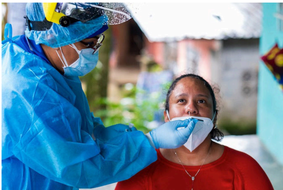
Los países deben desarrollar e implementar urgentemente sistemas basados en la atención primera de salud, pide el director de la Organización Panamericana de la Salud, doctor Jarbas Barbosa a la Región de las Américas.

“Ha llegado el momento de ir más allá de las declaraciones políticas y las aspiraciones, y pasar de la teoría a la práctica. Juntos podemos construir sistemas de salud resilientes que protejan, promuevan y garanticen el derecho a la salud. Y mediante la inversión, la innovación y la implementación podemos aprender de la historia, superar desafíos pasados y acelerar logros en materia de salud creando un futuro más próspero para todos”, puntualizó Barbosa.