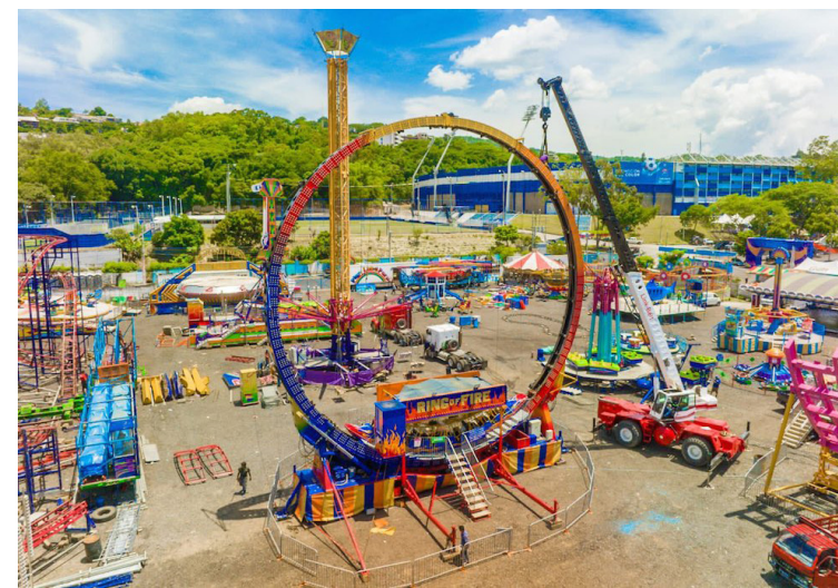
El campo de la feria “Sívarland”, es uno de los atractivos durante las Fiestas Agostinas, instalado en los alrededores del Estadio Cuscatlán.

La comuna capitalina indicó que Protección Civil Municipal, junto a cuerpos de socorro, mantendrán presencia en los desfiles, Sívarland y el Centro Histórico para atender emergencias, a tra-