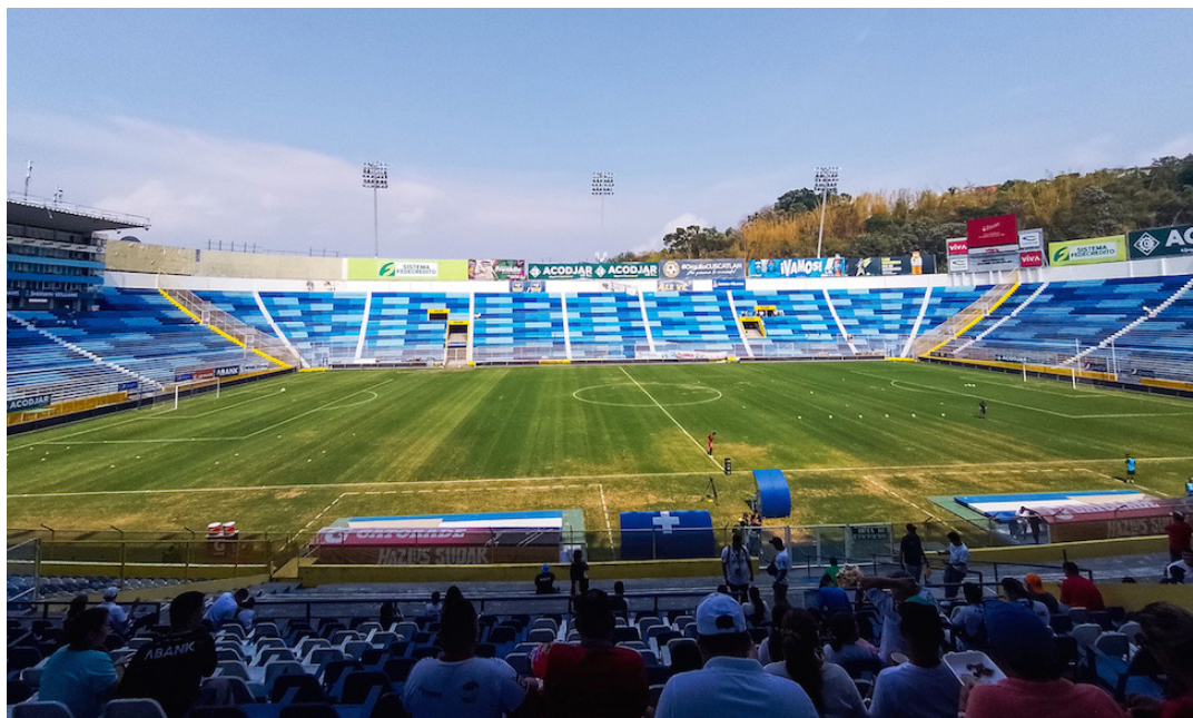
Para el Apertura 2023 se prohíbe el consumo y venta de alcohol en los estadios como parte de las medidas de seguridad.

Las bases de competencia establecen en el capítulo I: "Responsabilidad de los clubes participantes de control y vigilancia interna y externa", que en los estadios autorizados se prohíbe el ingreso de personas en evidentes estado de ebriedad, bajo los efectos de sustancias alucinógenas, personas que lleguen a insultar o crear problemas a otros aficionados, prensa, al club o autoridades deportivas, o también que desarrollen actividades de propagan-