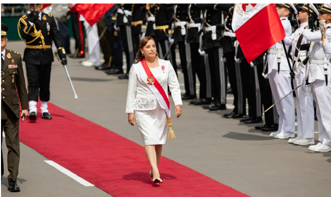
La presidenta peruana, Dina Boluarte, pasa revista a la Guardia de Honor a su llegada a la ceremonia con motivo de la celebración de las Fiestas Patrias, en Lima, Perú, el 28 de julio de 2023.

“El plan estuvo claramente dirigido a dañar o destruir valiosos activos críticos, como aeropuertos, puentes, carreteras, comisarías”, para aislar a importantes regiones del sur, recordó, al tiempo que precisó que esas acciones dejaron daños valorados en 5.500 millones de soles (unos 1.532 millones de dólares).