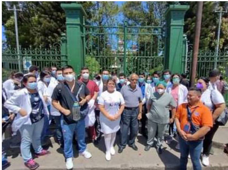
Organizaciones sociales denuncian y condenan la suspensión arbitraria de los médicos internos del Hospital Rosales.

Además, violenta el derecho a educación de las personas que se desempeñan como residentes de medicina en los hospitales y centros de salud nacionales, pues siguen siendo personal en forma-