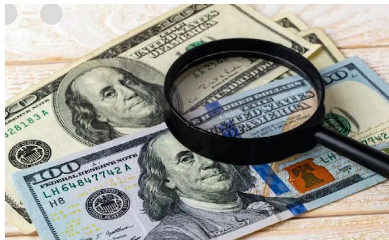
El ingreso de los partidos políticos en 2022 fue de $1.3 millones, proveniente únicamente de aportes de personas naturales y jurídicas.