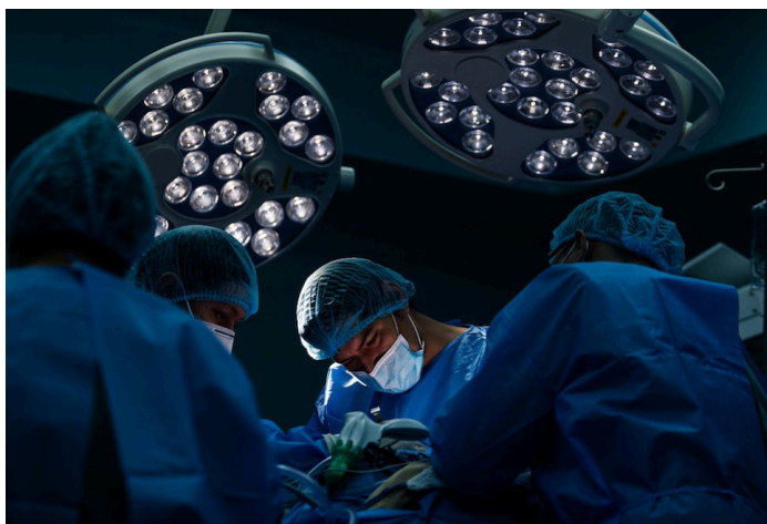
Familiares de la víctima denuncian que a la joven le cortaron el intestino mientras fue sometida a la cesárea, causándole la muerte. FOTO DE ILUSTRACIÓN/CORTESÍA.

“El médico nunca realiza procedimientos médicos o quirúrgicos pensando en hacer daño y la medicina no es una ciencia exacta,