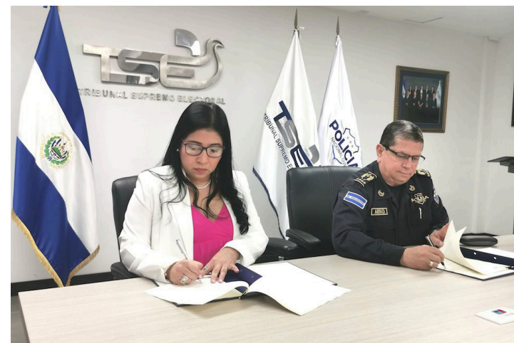
Tribunal Supremo Electoral (TSE) y la Policía Nacional Civil (PNC) firman un convenio de cooperación, para la seguridad durante las votaciones de 2024.

El convenio de cooperación interinstitucional con la PNC incluye identificar enlaces estratégicos en los países donde el TSE habilite centros de votación, para coordinar la seguridad con las autoridades locales, a fin de que la diáspora pueda acudir de forma tranquila a ejercer su derecho al voto el 4 de febrero de 2024.