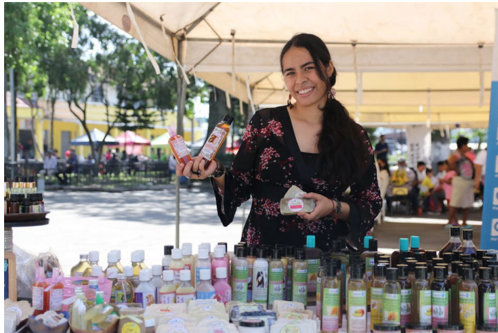
Plan Internacional a través del programa “Nueva generación de oportunidades”, beneficia a jóvenes emprendedores para que puedan crear sus modelos de negocio.

La transformación digital ha generado condiciones de mayor oportunidad al acceso de recursos técnicos e informáticos, pero también genera riesgos los cuales están relacionados con la forma de participar en estos sitios de tecnología o redes sociales, por