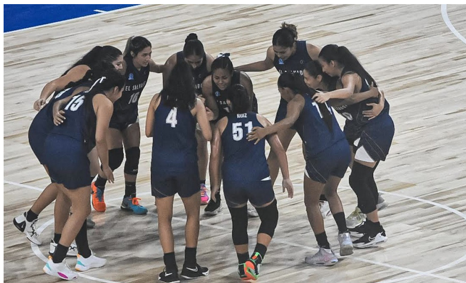
La selección de El Salvador enfrentará a Nicaragua en el debut, luego a Panamá en las dos primeras jornadas del COCABA 2023.

El Campeonato Centroamericano es la vía de clasificación para