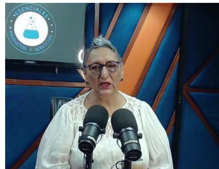
Lorena Peña, expresidenta de la Asamblea Legislativa y dirigente del FMLN, señala un 70% de participación en las elecciones internas de su partido.