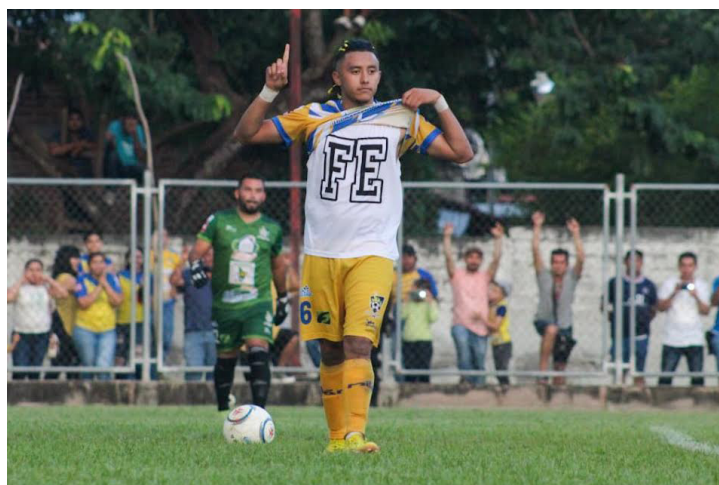
Jocoro jugará como local en el estadio Metropolitano de San Pedro Sula en Honduras, debido a las malas condiciones de los escenarios deportivos en El Salvador.

"Debido a las dificultades para poder realizar nuestros encuentros deportivos internacionales en los estadios de nuestro país, en donde ningún estadio cuenta con las condiciones y la aprobación de CONCACAF, hemos gestio-