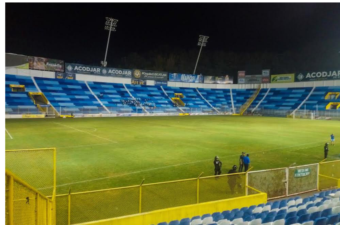
Águila y FAS no cuentan con sede previo al inicio de la Copa Centroamericana de CONCACAF tras la reconstrucción del estadio Cuscatlán.

Águila debutará en el torneo regional como local ante Diriangén, de Nicaragua, a las 6 de la tarde del jueves 17 de agosto, mientras