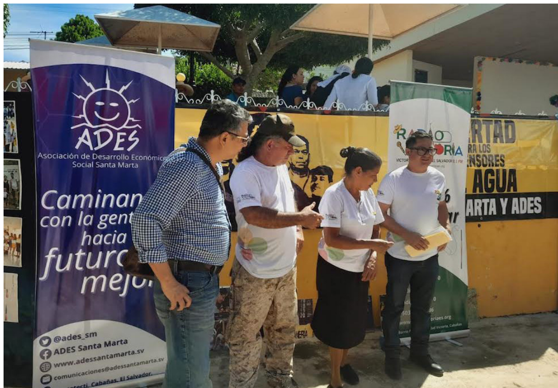
La Asociación de Desarrollo Económico Social Santa Marta (ADES), realiza un festival cultural en el marco de la celebración del trigésimo aniversario de Radio Victoria.

La Asociación de Desarrollo Económico Social Santa Marta (ADES) realizó la celebración del trigésimo aniversario de Radio Victoria, reconociendo su trabajo