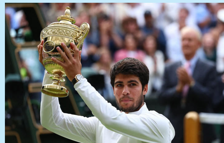
Carlos Alcaraz levanta la presea del campeonato de Wimbledon al derrotar a Novak Djokovic en la final.

“Es un sueño hecho realidad, es genial ganar, pero, in-