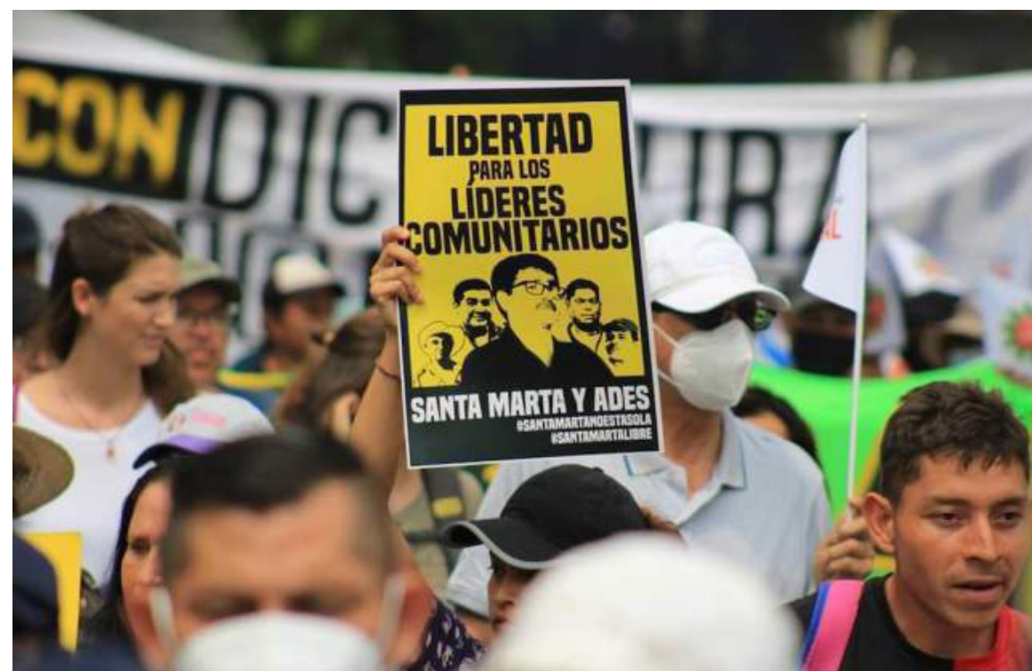
En la agenda de la Comisión Interamericana de Derechos Humanos (CIDH), las Organizaciones presentaron el caso de los líderes de Santa Marta, durante el 187 Período de Sesiones de la CIDH, en el que se abordó la “situación de los derechos humanos en El Salvador en el marco del estado de excepción”.

Fuentes cercanas al caso dijeron a Diario Co Latino que dicha audiencia “representa una oportunidad para que el Estado salvadoreño acate el llamado de Naciones Unidas y el clamor de más de 250 organizaciones de 30 países que piden la libertad de los líderes de Santa Marta y ADES”.