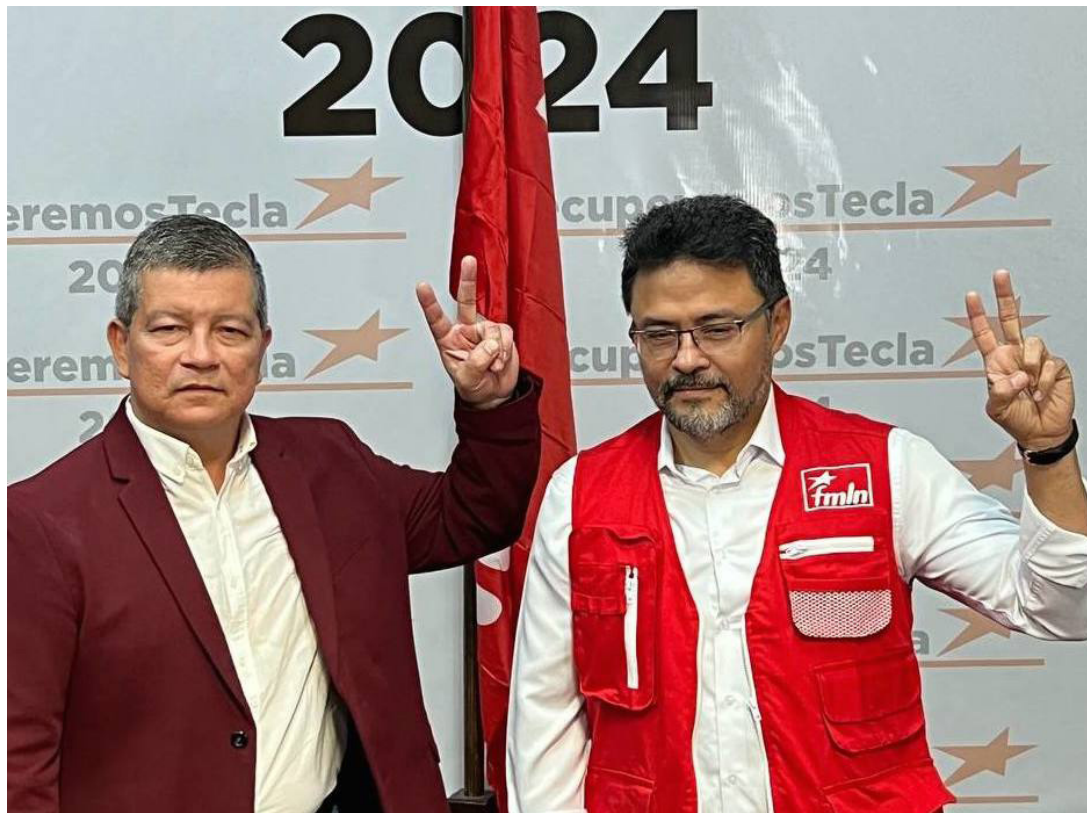
Manuel Flores y Werner Marroquín fueron presentados, como los candidatos únicos que van aspirar a la elección presidencial por el partido Frente Farabundo Martí para la Liberación Nacional (FMLN), de cara a los comicios de 2024.

profunda en nuestro partido y hoy se va a consolidar en la votación nacional en donde casi el 100% de nuestros candidatos son jóvenes, con mucha presencia de mujeres y como mucho resurgimiento de liderazgos en los departamentos y orgulloso de haber votado y más orgulloso de estar con los líderes a escala nacional”, indicó.