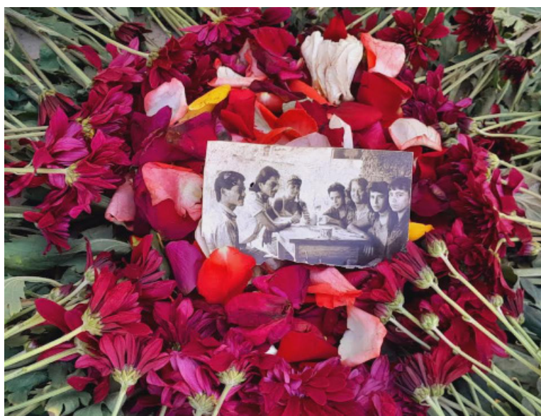
Luego de sufrir la persecución militar, las masacres y el exilio durante el conflicto armado, por la “cruel guerra civil salvadoreña”, decidieron volver para repoblar ese territorio con el único objetivo de “refundar una comunidad bajo un concepto alternativo”.