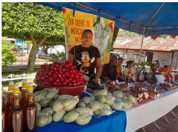
Para los que trabajan en el proyecto de la radio, el esfuerzo ha significado muchos retos y desafíos importantes porque es la comunidad el verdadero corazón, y la razón de ser.