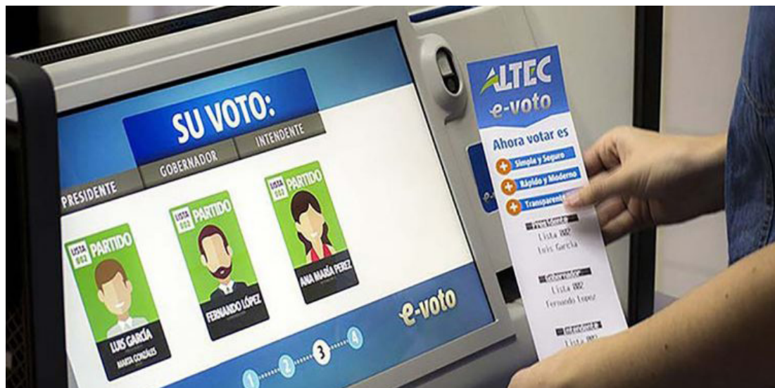
La diáspora podrá votar en El Salvador con documento de identidad vigente; los residentes en el exterior emitirán el sufragio con DUI vigente o vencido y con pasaporte.