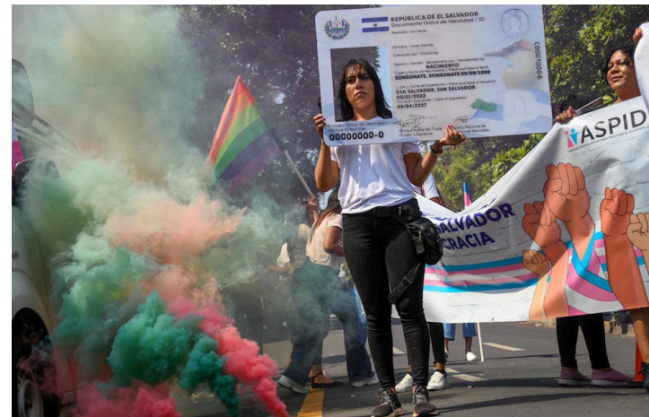
La población LGBTIQ+ pide aplicar la normativa y penalizar los delitos motivados por prejuicios, basados en la orientación sexual y la identidad de género.

Sin embargo, son numerosos los testimonios de agresiones de personas LGTBI, quienes han tenido que huir de sus comunidades o desplazarse forzosamente, debido a la violencia directa en su contra.