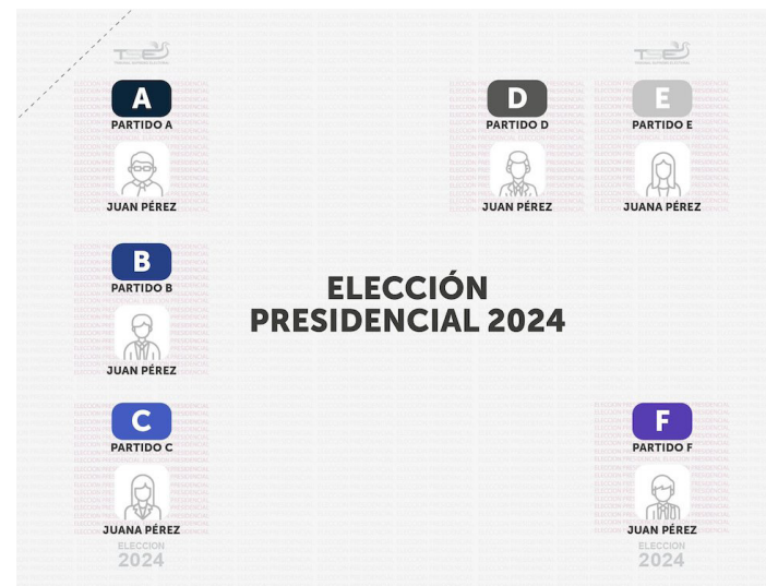
Así se vería la papeleta de votación para presidente de la República, luego que la Asamblea aprobó incluir la fotografía del candidato.

Es de contextualizar que tanto para diputado de la Asamblea Le-