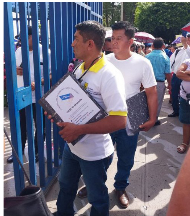
Líderes de COFOA de diferentes comunidades presentarán hoy denuncias por Estafa agravada en la FGR.

COFOA es un ministerio de la Pastoral Social, de la Diócesis de Zacatecoluca, que con el modelo de organización comunitaria basada en la Fe de PICO o Pueblo Impulsando Comunidades a través de la Organización, intenta ayudar a los cristianos a llevar sus valores de Fe a la vida pública. Además, busca ubicar a los servidores públicos, en el contexto para el cual son electos y sensibilizar a estos funcionarios públicos en su compromiso de servicio al