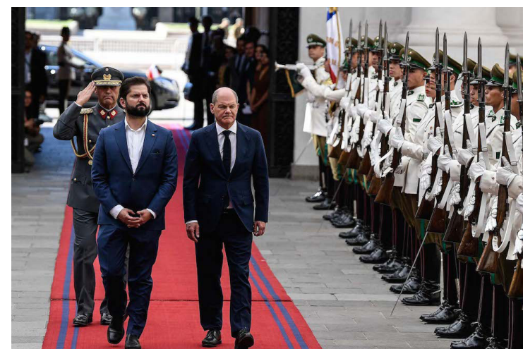
El presidente chileno, Gabriel Boric (izquierda), y el canciller alemán, Olaf Scholz (derecha), pasan revista a la guardia de honor en el Palacio de La Moneda, en Santiago, capital de Chile, el 29 de enero de 2023. Scholz realiza una visita oficial a Chile entre el domingo 29 y el lunes 30 de enero.

El gobierno chileno aseguró que la delegación sudamericana refrendará en la gira la importancia de una transición verde y digital justa, al igual que abordará la modernización del acuerdo entre la UE y Chile.