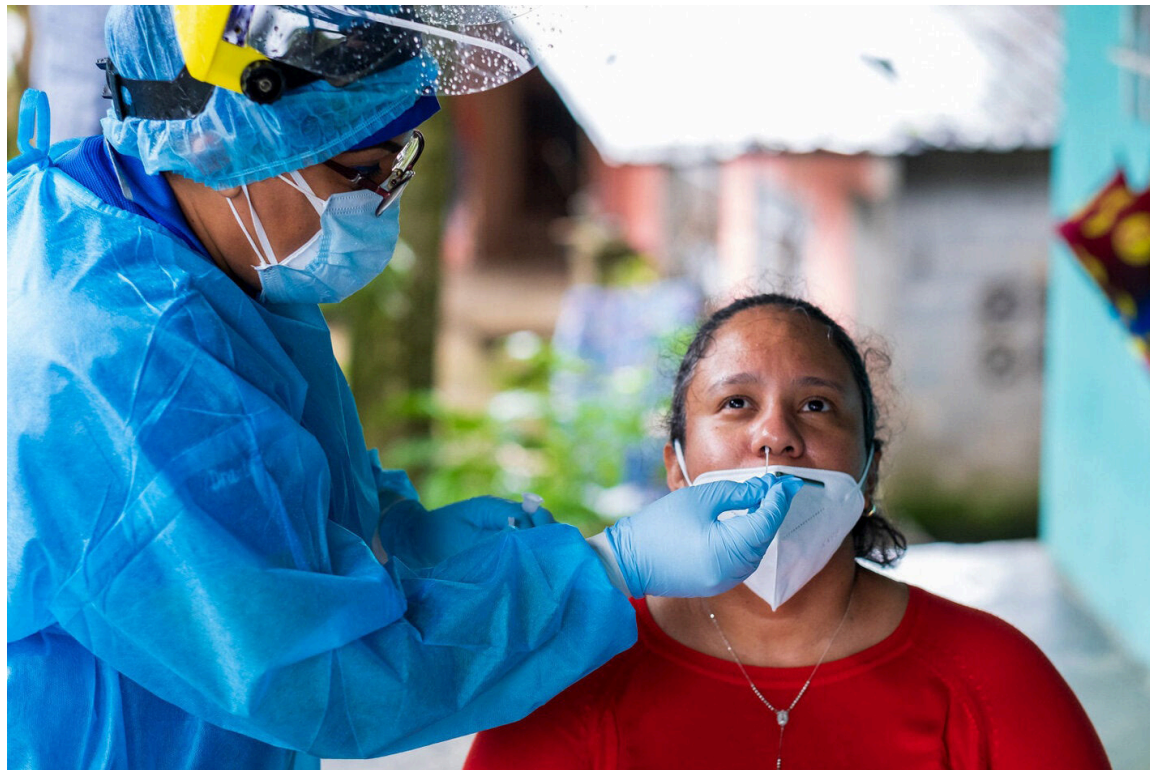
Los procesos de consulta han sido impulsados y se encuentran orientados por los Estados Miembros de la Organización Mundial de la Salud (OMS), el cual, tiene como objetivo “no repetir las repercusiones sanitarias, sociales y económicas de la pandemia de la Covid-19”.

Los representantes de los ministerios de Salud y de Relaciones Exteriores de los países de las Américas asistieron a la segunda reunión, convocada por el director de la OPS, a fin de facilitar una “participación significativa” en cuanto a las deliberaciones y lograr avances. En este segundo encuentro participaron miembros de las misiones permanentes de los países ante las Naciones Unidas (ONU) en Ginebra y ante