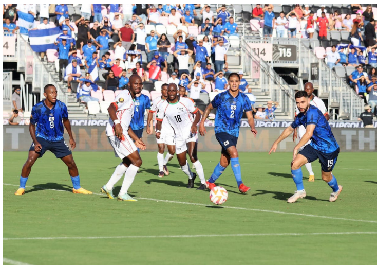
La selecta se enfrentará a Guatemala en el debut en la Liga de Naciones de CONCACAF en septiembre.

El primer partido será ante Guatemala, el próximo jueves 7 de septiembre, con la sede y horarios aún por confirmar. Luego, el domingo 10 del mismo mes contra Trinidad y Tobago. El viernes 13 de octubre ante Martinica y cerrará con la misma selección el martes 17 como local. Hay que destacar el pasado que arrastra la selecta contra Martinica, en la fase de grupos de la Copa Oro, donde los cari-