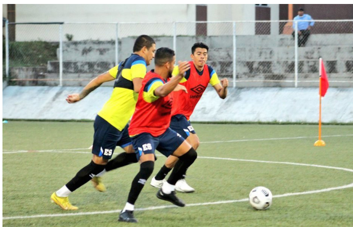
La Primera División se amparará en el reglamento de la FIFA y solo prestará a los jugadores previo a los encuentros internacionales.

“Hemos tratado de poner la mayoría de juegos en fines de semana, recordemos también