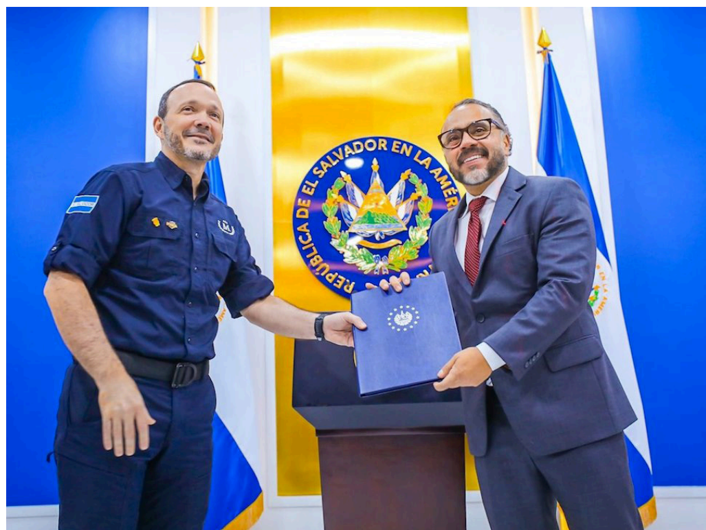
Ministro de Seguridad, Gustavo Villatoro, entrega al presidente de la Asamblea, Ernesto Castro la solicitud de prórroga al régimen.