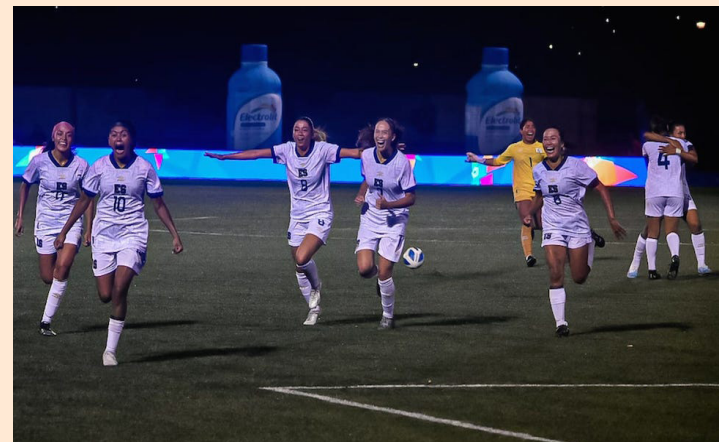
La selección mayor femenina debutará ante Nicaragua en la clasificatoria rumbo a la Copa Oro W de CONCACAF.

El Salvador vs Nicaragua (3 de diciembre)