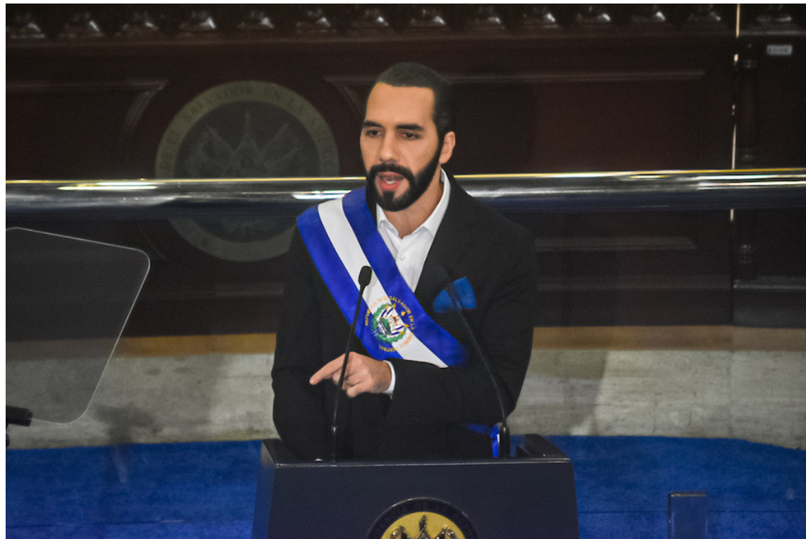
Nayib Bukele es el candidato presidencial de Nuevas Ideas a pesar de que la Constitución de la República lo prohíbe.

La eventual “licencia” anunciada por el vicepresidente, que pedirá ambos en diciembre, “pretende dar la impresión de estar cumpliendo con los requisitos; sin em-