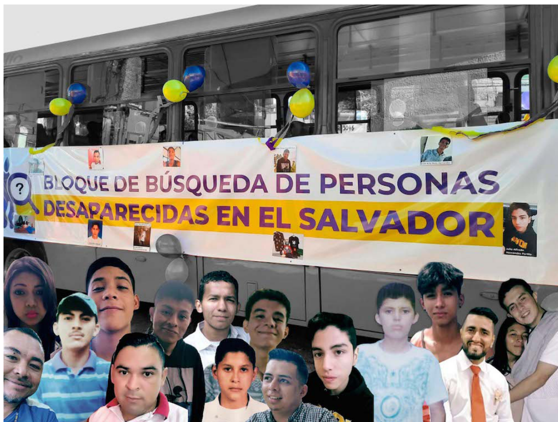
El Bloque de Búsqueda de Personas Desaparecidas en El Salvador realiza un llamado simbólico al Estado para que incremente los esfuerzos para atender de manera adecuada a los cientos de casos de víctimas de desaparición.

“El objetivo es coordinar trabajo conjunto desde las posibilidades que tenemos como familias y organizaciones sociales, para obtener respuestas en relación a los casos denunciados. Esto incluye alternativas para problemáticas como el proceso