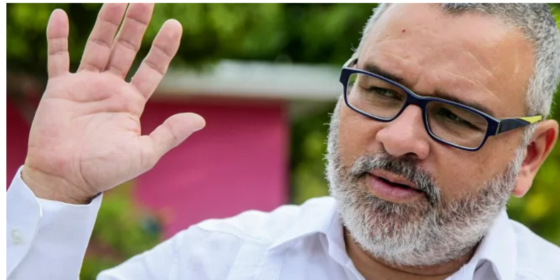
Mauricio Funes, expresidente de El Salvador es condenado a 6 años de prisión por supuesta evasión de impuesto.