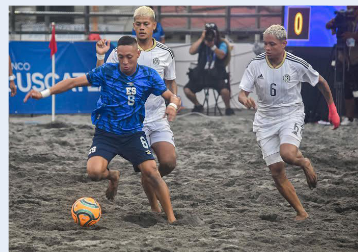
El Salvador vence con autoridad a Costa Rica en el Complejo Deportivo Flor Blanca y se mete a la final en los Juegos Centroamericanos.

Tras un sufrido primer tiempo donde la selección de playa perdió la ventaja y la remontada que tuvo