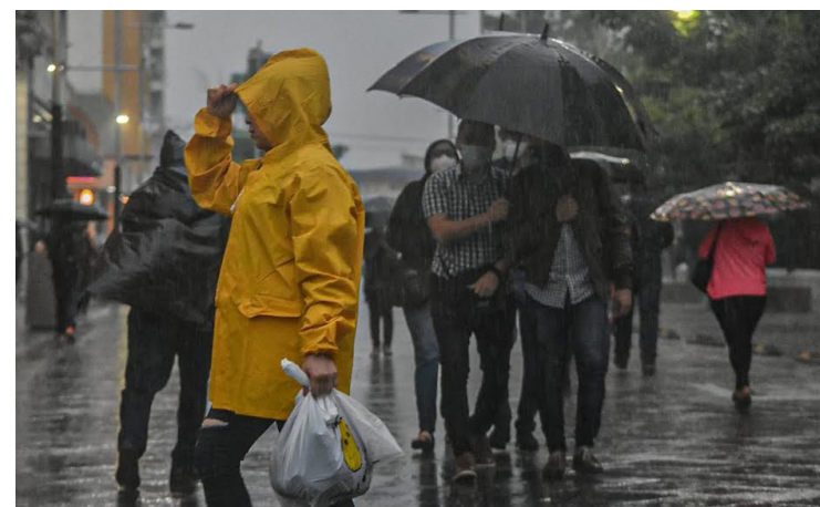
Según el Ministerio de Medio Ambiente y Recursos Naturales (MARN), las lluvias continuarán con un ambiente caluroso en el día, fresco por la noche y madrugada. Esto se debe a la influencia de la onda tropical que desde el día miércoles afecta al país.

En la costa de El Salvador, las condiciones previstas de oleaje y viento en el mar son apropiadas para actividades como pesca, transporte y turismo maríti-