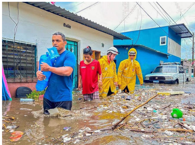
La MPGR ha cubierto solo en 2022, a 5 mil 320 personas de 1, 814 familias en 29 comunidades del país, quienes han enfrentado los “efectos adversos” de las tormentas tropicales.

“Fortalecer los sistemas de alertas y la acción tempranas necesarias para salvar vidas y medios de subsistencia”, como plantea la Organización Meteorológica Mundial (OMM) solicitó la Mesa Permanente para la Gestión de Riesgo (MPGR).