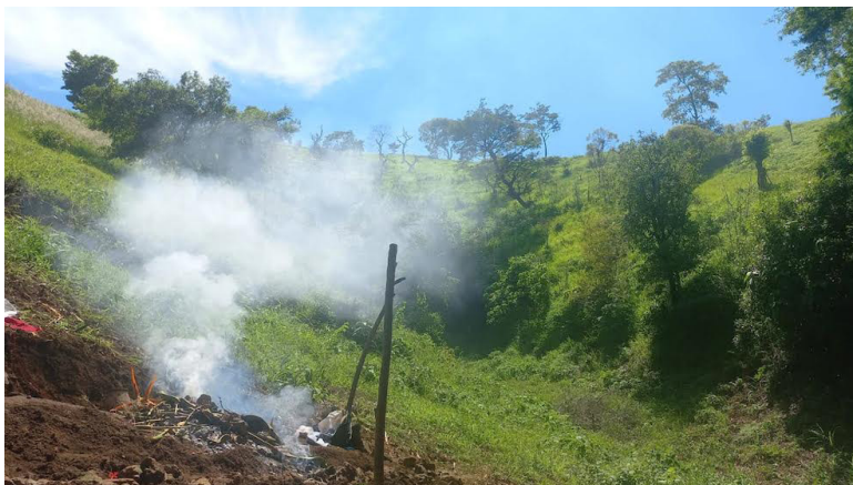
A finales de mayo de este año, se llevó a cabo una inspección por parte de la jueza del juzgado ambiental de Santa Tecla, en la cual se pudo evidenciar la destrucción severa del lugar.

En la actualidad, gran parte del cerro y su cúspide han desaparecido, mientras cientos de camiones salen diariamente con material pétreo, dejando un desolador panorama, muerto y sin vegetación alguna.