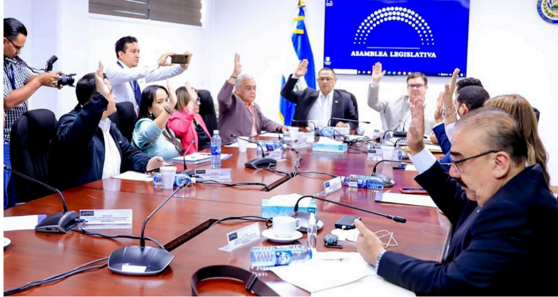
Los diputados emiten dictamen favorable para ratificar el contrato de préstamo suscrito con el CAF denominado Programa para la Transformación del Clima de Negocios de El Salvador, a través de la Facilitación del Comercio e Inversiones FOTO: DIARIO CO LATINO / CORTESÍA.