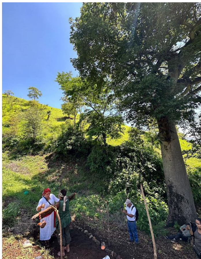
Las comunidades de Quezaltepeque, de la Federación de Pueblos Originarios y Afrodescendientes del Sur, participan de la celebración de consagración, en la zona del Cerrito, en la parte que aún cuenta con vegetación.

Es de destacar que ningún gobierno ha retomado sus demandas, por ello, enfatizan su llamado a las autoridades actuales, pero ven con preocupación que las empresas SALTEX, de la Roca, Prefasa, Precasa, MEGABLOCK entre otras mantienen su constante explotación, incluso, han denunciado en las últimas semanas volquetas extrayendo material rocoso, con dis-