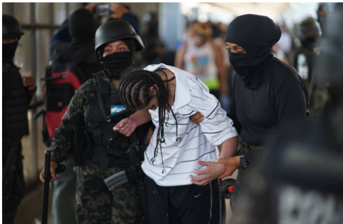
La Comisión Interamericana de Derechos Humanos (CIDH), urge al Estado de Honduras, adopte medidas inmediatas y efectivas con perspectiva de género y garantizar los derechos a la vida e integridad personal de las mujeres bajo custodia, y garantice no se repitan esos hechos.

El Gobierno de Honduras anunció que habilitará las “islas del Cisne” para el traslado de los líderes de las organizaciones criminales consideradas de alta peligrosidad y se capacitarán y formarán al menos dos mil nuevos