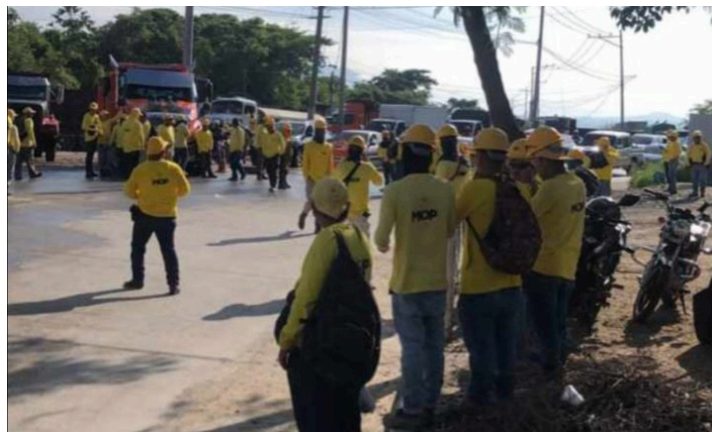
Trabajadores subcontratados por el MOP, cerraron el paso vehicular en el Redondel Integración, debido a la falta de pago de salario, horas extras y otras prestaciones.