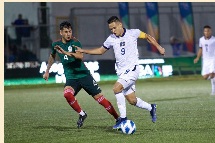
La selección nacional sub-22 se enfrentará a Costa Rica en las semifinales luego de empatar contra México en los Juegos Centroamericanos 2023.