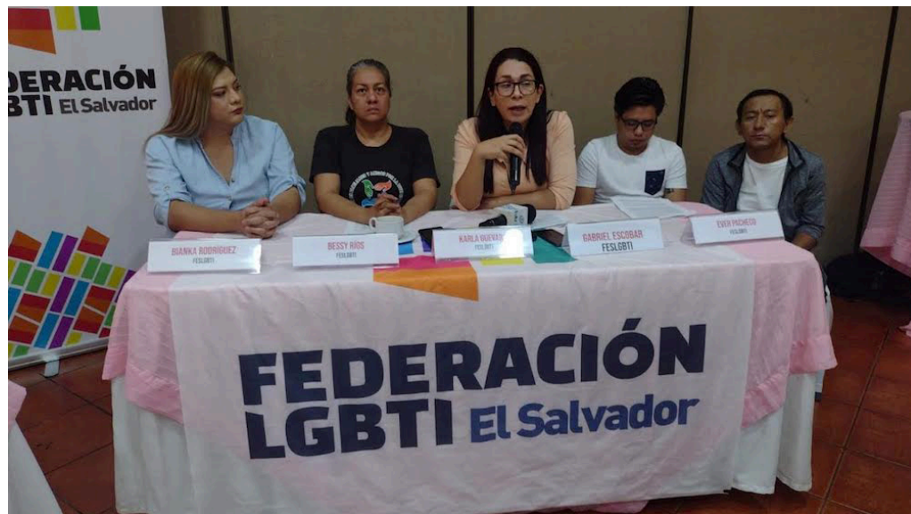
Las integrantes de la Federación LGBTI El Salvador, se pronuncian en el Mes del Orgullo de la Diversidad Sexual, condenando los 15 meses de estado de excepción y los discursos de odio que consideraron han ido en aumento en los últimos años.