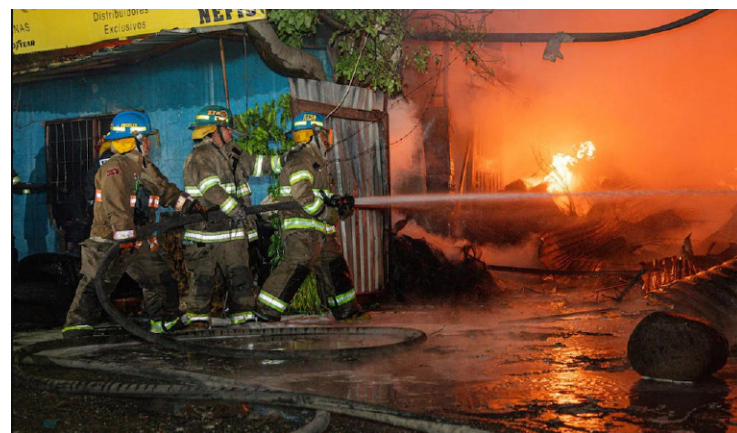
El Cuerpo de Bomberos tendrá una asignación de $10 millones, para su funcionamiento en 2023.

El funcionamiento del instituto, según explicaron los parlamentarios, permitirá mejorar la producción y calidad del café, reducir los costos del proceso, ser resiliente ante la vulnerabilidad climática y posicionar al país en-