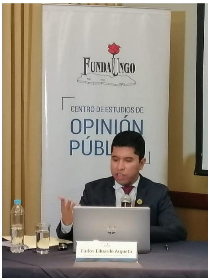
La Fundación Dr. Guillermo Manuel Ungo (FUNDAUNGO) presenta los principales resultados de la encuesta "Evaluación de la gestión gubernamental y temas de actualidad del 2023".

La Fundación Dr. Guillermo Manuel Ungo (FUNDAUNGO) dio a conocer los principales resultados de la encuesta "Evaluación de la gestión gubernamental y temas de actualidad del 2023", la cual reveló que en los próximos comicios de 2024 una tercera parte de la población consultada expresó un cierto nivel de incertidumbre sobre ejercer o no el sufragio; mientras que, el 83.2% expresan con certeza su decisión de asistir a las urnas.