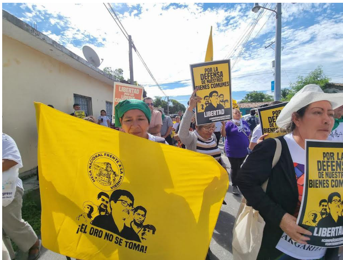
Las organizaciones ambientalistas y comunitarias de San Isidro, demandaron del Fiscal General de la República investigar a los autores intelectuales de los asesinados por el conflicto minero del 2009.

“Recientemente, las comunidades de Cabañas han denunciado