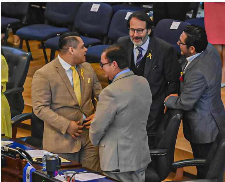
Diputados de Nuevas Ideas avalan que el Comité de los Juegos Centroamericanos y del Caribe San Salvador 2023 disponga de otras instituciones públicas, para el desarrollo de las actividades.