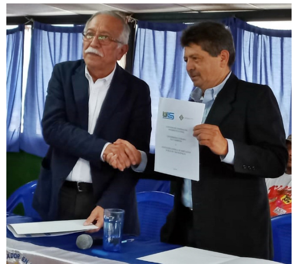
AGEPYM y la Universidad Luterana firman un convenio para que los afiliados y sus hijos, puedan estudiar una carrera universitaria con cuotas preferenciales.

una en San Salvador y otra en Cabañas, con cual tendrán más acceso para quienes son del interior del país.