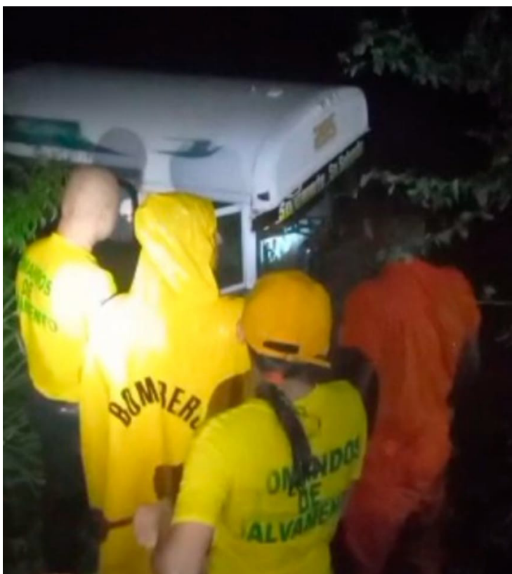
El conductor de un autobús de la ruta 205 fue rescatado, luego que la repunta de un río en Sonsonate, arrastró la unidad de transporte.

Un equipo de rescatistas logró llegar hasta el autobús para poner a salvo al motorista, que se encontraba con una crisis nerviosa.