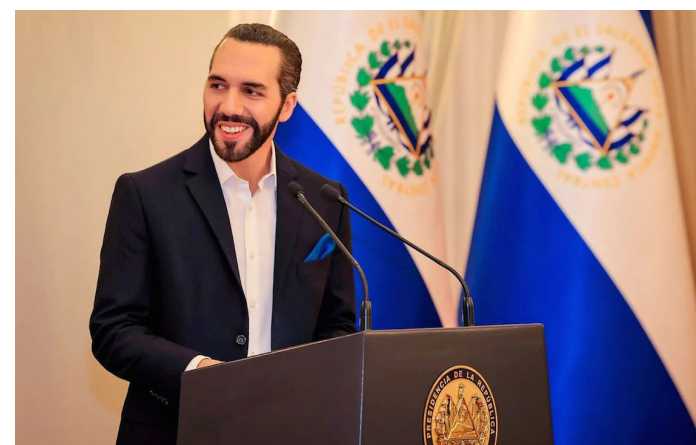
Nayib Bukele se inscribe como precandidato presidencial por el partido Nuevas Ideas para una reelección presidencial a pesar de estar prohibida por la Constitución.

“A partir de eso y que se están alineando los poderes del Estado, se empieza a consolidar ese plan. Está claro que la Constitución prohíbe la reelección inmediata. Han sido muy creativos en querer tergiversar esto e interpretarlo a su favor y la misma Sala de lo Constitucional impuesta, que es inconstitucional, emitió una resolución supuestamente habilitando