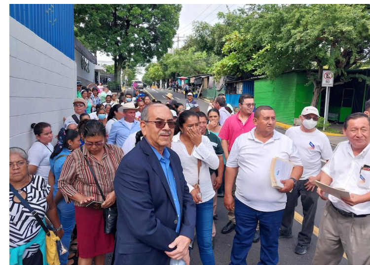
COFOA acompaña a alrededor de 7,500 familias que no cuentan con escrituras de sus propiedades.