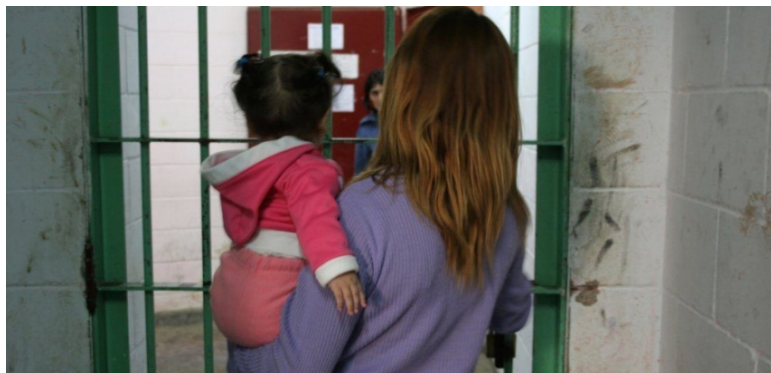
En el informe también se abordó que la mujeres privadas de libertad enfrentan falta de políticas penitenciarias respetuosas, entre las que destacan. la no atención a las prisioneras que tienen a sus hijos conviviendo con ellas en la cárcel.

La Comisión Interamericana de Derechos Humanos (CIDH) presentó su informe “Mujeres Privadas de Libertad en las Américas”, que analiza la situación que enfrentan las mujeres encarceladas, junto a factores que dan lugar a su detención, los obstáculos en el acceso a las medidas alternativas y desafíos que enfrentan para su reinserción en la sociedad. Con especial enfoque en países del Norte de Centroamérica.