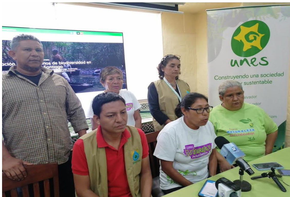
La Unidad Ecológica Salvadoreña (UNES) y la Mesa por la Sustentabilidad de los Territorios de Sonsonate (MESUTSO), lanzan el “Geovisor Web de Conflictividad Socioambiental”.

“Se busca responder a las necesidades de defensa de estos derechos ambientales y culturales en el país y también en la región centroamericana. En esta primera fase del proyecto hemos logrado