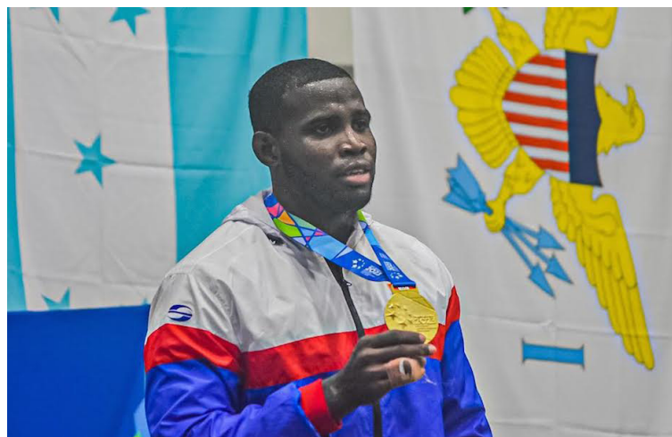
La delegación de Cuba sigue materializando su esfuerzo en letras doradas, actualmente es el tercer país con más medallas doradas en los Juegos Centroamericanos y del Caribe San Salvador 2023.

Entre las disciplinas más destacados de la isla, hasta el momento, está el judo, boxeo, gimnasia artística, levantamiento de pesas, natación, pentatlón moderno, remo, tenis de mesa y tiro.