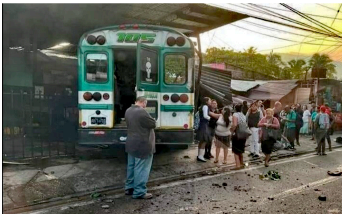
Un autobús de la ruta 105 que hace su recorrido de Jayaque, Sonsonate, a San Salvador, que según las autoridades iba a excesiva velocidad fue sacado de la vía por otra unidad del transporte colectivo, impactando contra una vivienda y un taller, en el incidente resultaron 11 lesionados.

Asimismo, la Dirección General de Transporte de Carga tiene básculas que se pueden instalar, para verificar el transporte de carga, si una unidad sobrepasa el peso, no solo es infraccionado, también piden que otra unidad llegue a quitar la sobrecarga.