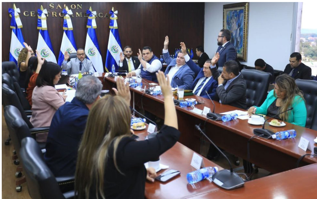
Comisión Política estudia propuesta de reducción de municipios a 44.

Chalatenango Sur tendrá los siguientes distritos: Chalatenango, Arcatao, Azacualpa, Comalapa, Concepción Quezaltepeque, El Carrizal, La Laguna, Las Vueltas, Nombre de Jesús, Nueva Trinidad, Ojos de Agua, Potonico, San Antonio de La Cruz, San Antonio Los Ranchos, San Francisco