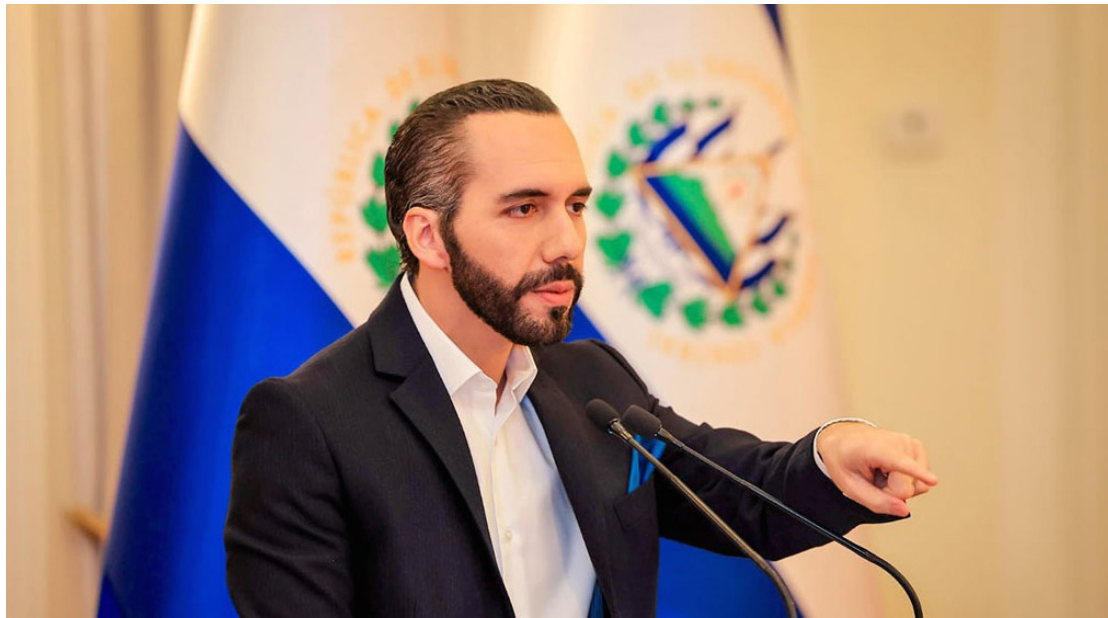
Presidente de la República Nayib Bukele.

En su informe “Carrera de obstáculos: Confrontando las barreras para investigar la corrupción en El Salvador”, el grupo asegura que la lucha contra este fenómeno experimenta retrocesos significativos, debido a reformas legislativas que impiden el acceso a la información pública necesaria para detectar este tipo de actos, y la posibilidad