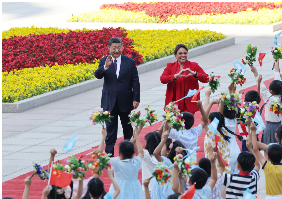
El presidente chino, Xi Jinping, celebra una ceremonia de bienvenida a la presidenta de la República de Honduras, Iris Xiomara Castro Sarmiento, en la plaza frente a la entrada este del Gran Salón del Pueblo antes de sus conversaciones en Beijing, capital de China, el 12 de junio de 2023.

municado conjunto emitido después de la conclusión de las conversaciones, China y Honduras acordaron reforzar la orientación política, promover los intercambios en todos los niveles, fortalecer los intercambios culturales y la cooperación en diversos ámbitos y ser buenos amigos y socios que tengan respeto mutuo, igualdad, beneficios mutuos y desarrollo común.