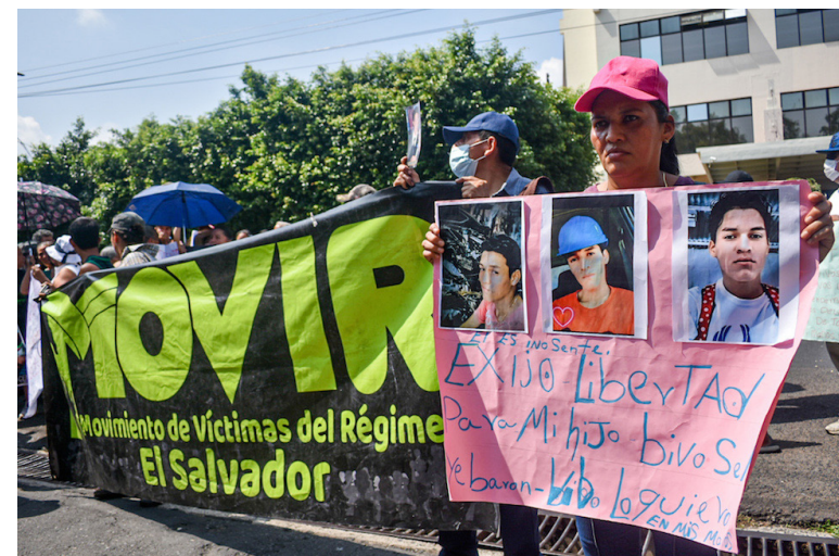
El informe que los familiares solicitan a Medicina Legal servirá para constatar si alguna de las personas fallecidas pertenece a alguno de los grupos familiares que demandan libertad para detenidos injustamente.

“Esta situación mantiene en seria preocupación a las familias de las personas presas inocentes pues no hay una entidad oficial que esté avisando de la situación de salud u hospitalización de los reos y reas. Hasta hoy, todo hace suponer que son asesinatos, dadas las señales que se visibilizan en