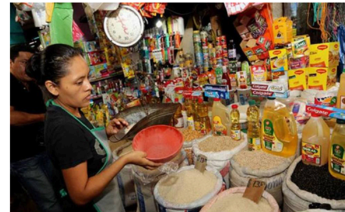
Los frijoles, el arroz y el maíz podrían elevar su costo debido a un déficit de 8 millones de quintales de granos básicos, denuncia la Mesa Agropecuaria Rural Indígena.

“Todos sabemos que hay un déficit alimentario este año, y claro, eso se debe al alza de los insumos agrícolas en los últimos dos años. El quintal de sulfato valía 11 dólares y ahora su costo es de 32 dólares, eso ha hecho que muchos agricultores ya no siembran dos manzanas, ahora siembran sólo una manzana; otros que alquilaban una manzana hoy están haciendo media manzana, y así van de-