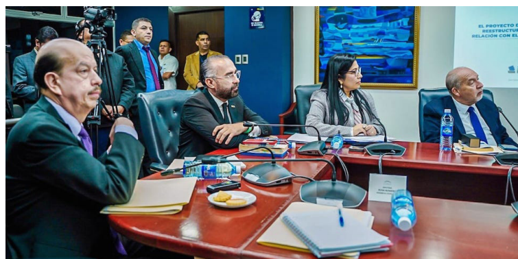
Magistrados del TSE piden a la Asamblea Legislativa ampliar por 15 días más las elecciones internas de los partidos políticos, a fin de adecuarse a la nueva distribución de municipios.

Debido a las reformas que reduce el número de diputados y municipios, la presidenta del Tribunal Supremo Electoral (TSE), Dora Martínez, propuso a la Comisión Política de la Asamblea Legislativa ampliar por 15 días más el plazo para que los partidos políticos celebren sus elecciones internas, ya que la fecha límite es el 5 de julio de 2023.