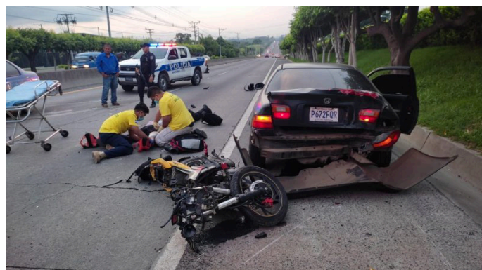
Un motociclista falleció en un accidente de tránsito en el kilómetro 19 de Nejapa, el conductor chocó contra un carro particular, recibió lesiones en la cabeza, tórax y piernas.

En lo que va del año, hasta la fecha, se reportan 7,618 accidentes de tránsito, 4,621 personas lesionadas y 531 fallecidos.