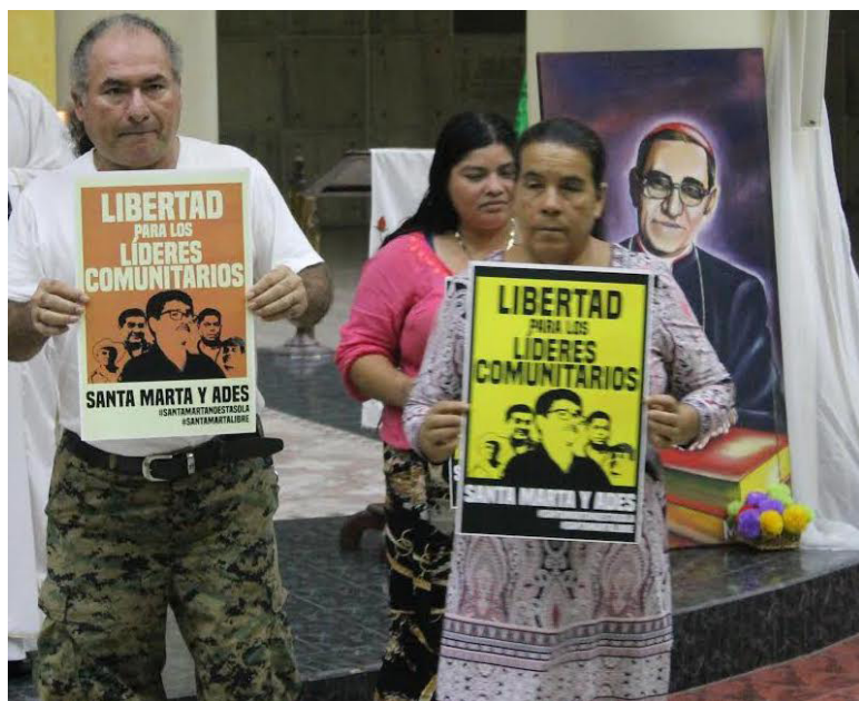
Representantes de Santa Marta y ADES piden la liberación de los cinco ambientalistas detenidos desde el 11 de enero, cuyo trabajo fue clave para demostrar la inviabilidad de la minería en el país.

“Durante cinco meses el Estado salvadoreño se ha ensañado contra estos humildes y valientes luchadores sociales que salvaron al país del terrible desastre de la minería metálica, que amenazaba directamente al agua, medioambiente, la agricultura y la continuidad de la vida misma. Su trabajo fue clave para demostrar la inviabilidad de la minería y