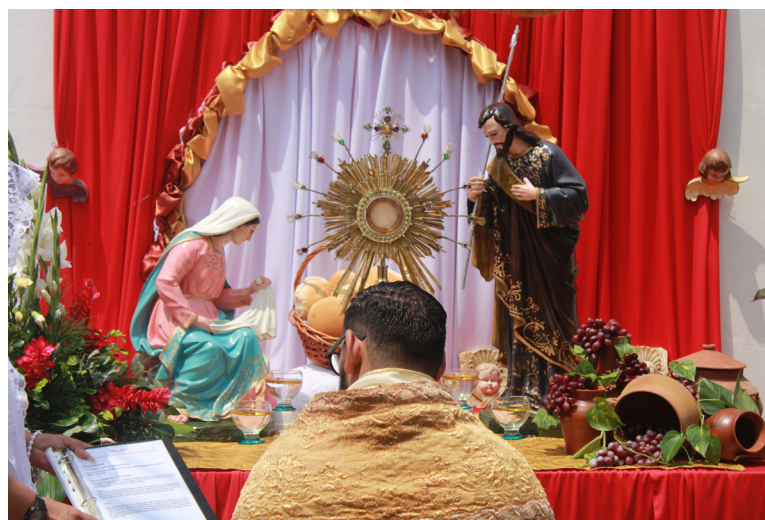
La feligresía católica recuerda con el Corpus Christi la institución de la eucaristía, que tuvo lugar durante la Última Cena de Jesús el Jueves Santo.

Explicó que por ello, la cruz y resurrección están íntimamente unidas con la eucaristía, cada vez que se celebra este memorial es la actualización de la pasión y muerte del