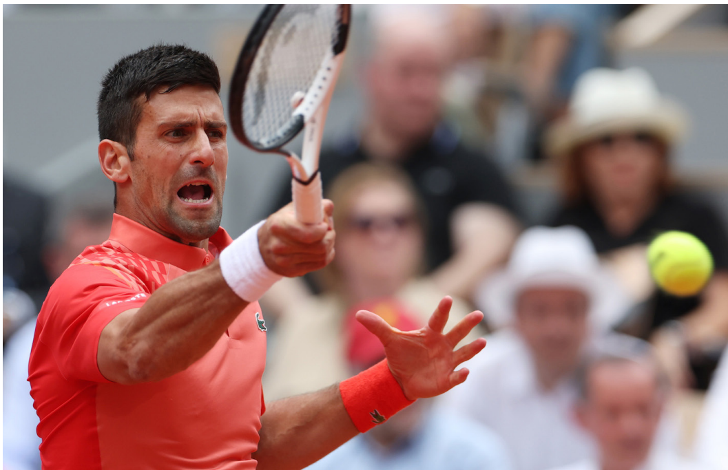
Novak Djokovic de Serbia realiza una devolución durante la final individual masculina contra Casper Ruud de Noruega en el torneo de tenis Abierto de Francia en Roland Garros en París, Francia, el 11 de junio de 2023.