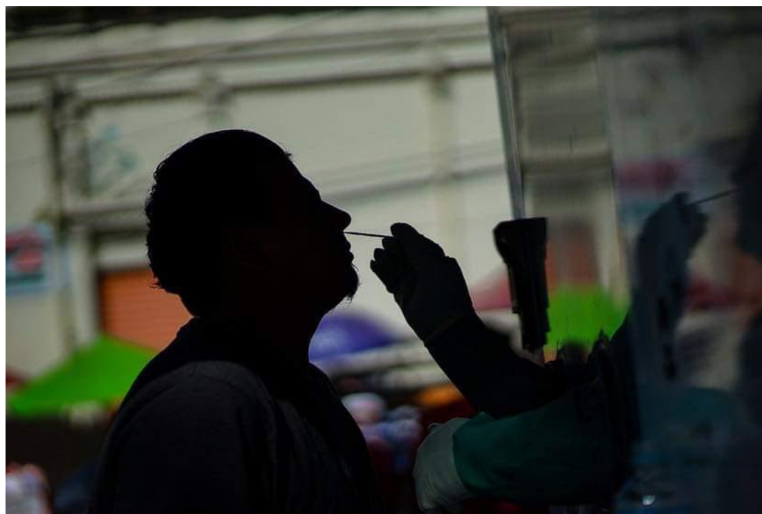
Tras la pandemia del Covid 19, la Organización Panamericana de Salud (OPS), muestra su preocupación en un informe, sobre las enfermedades mentales cuya incidencia se agravó, con la pandemia.

La Organización Panamericana de Salud (OPS) señaló, luego de presentado su nuevo informe, que la “salud mental debe ocupar un lugar prioritario en la agenda política tras la pandemia del Covid 19. El informe destaca que las enfermedades mentales han representado históricamente una importante carga de discapacidad y mortalidad en la región que se agravó con la reciente pandemia.