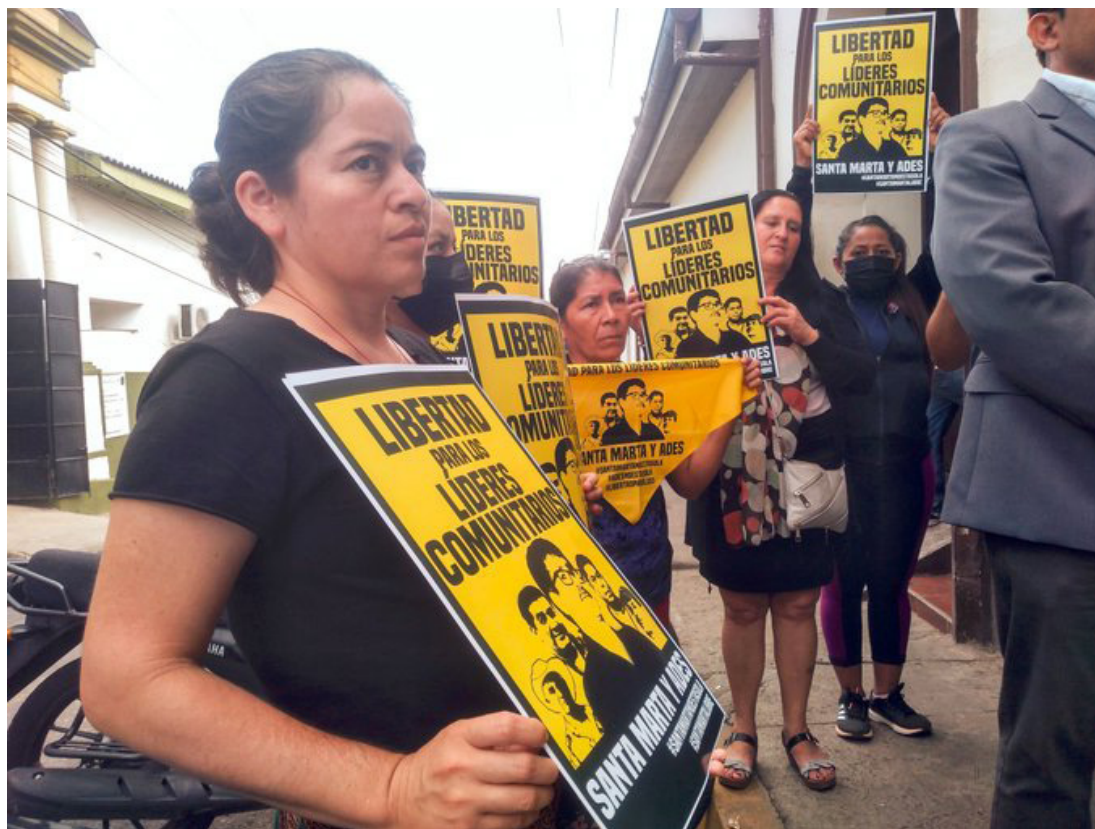
La petición es que se “liberen y se revise el motivo porque el que han sido detenidos” y que se señale nuevamente una audiencia de revisión de medidas.

realice de nuevo una audiencia de revisión de medidas para que se pueda discutir nuevamente este punto y puedan tener la oportunidad estas personas detenidas de quedar en libertad”, explicó el abogado.