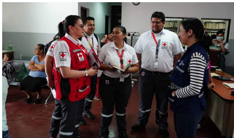
Cruz Roja mediante el proyecto “Protección y Acceso a la Salud en El Salvador”, desarrolla capacitaciones y mejoramiento de infraestructura en diferentes centros asistenciales del país.

En la región occidental la institución ha colaborado con la implementación de micro proyectos de pintura, reparación de portones, entrega de chalecos,