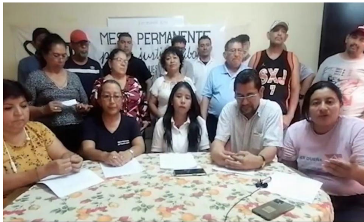
La Mesa Permanente por la Justicia Laboral calificó los despidos como una “transgresión a la estabilidad laboral”.

“A los y las trabajadoras de la Alcaldía de Soyapango se les ha impedido el ingreso a las instalaciones o centros de trabajo. Y la