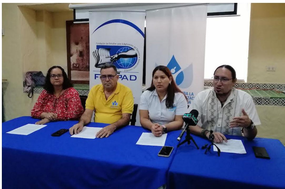
En el Día del Medio Ambiente la Alianza Nacional contra la Privatización del Agua, realiza un balance ambiental a cuatro años del presidente Nayib Bukele, afirman que las poblaciones más vulnerables siguen recargándole responsabilidades que son del Estado.

En El Salvador el derecho humano al agua no queda garantizado por decreto legislativo y que junto a la falta de participación ciudadana en la toma de decisiones para la gestión de estos bienes hídricos, los únicos beneficiados son los sectores de poder económico, agregó. “Las Juntas de Agua y