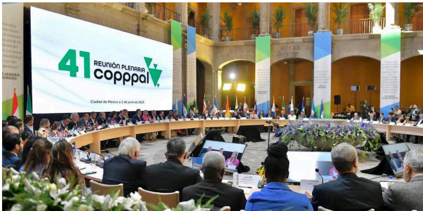
La COPPAL pide a las Naciones Unidas una investigación sobre los presos políticos en El Salvador, y adoptar medidas que propicien su libertad.