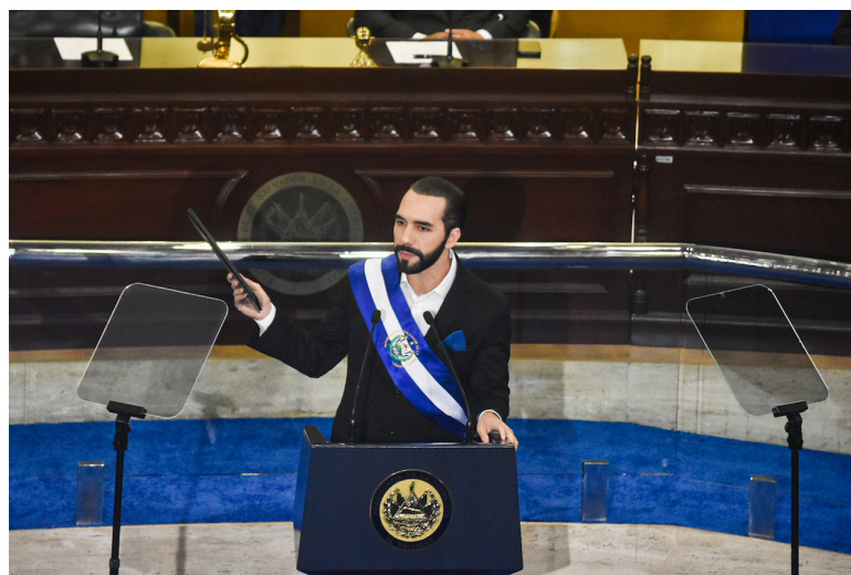
Bukele sostiene en su mano izquierda la propuesta para reducir el número de municipios.

“La oposición dice que, por qué no se captura a los corruptos de ahora, en primer lugar, no es la oposición quien va a decir a qué corrupto van a capturar primero. Creo que de-