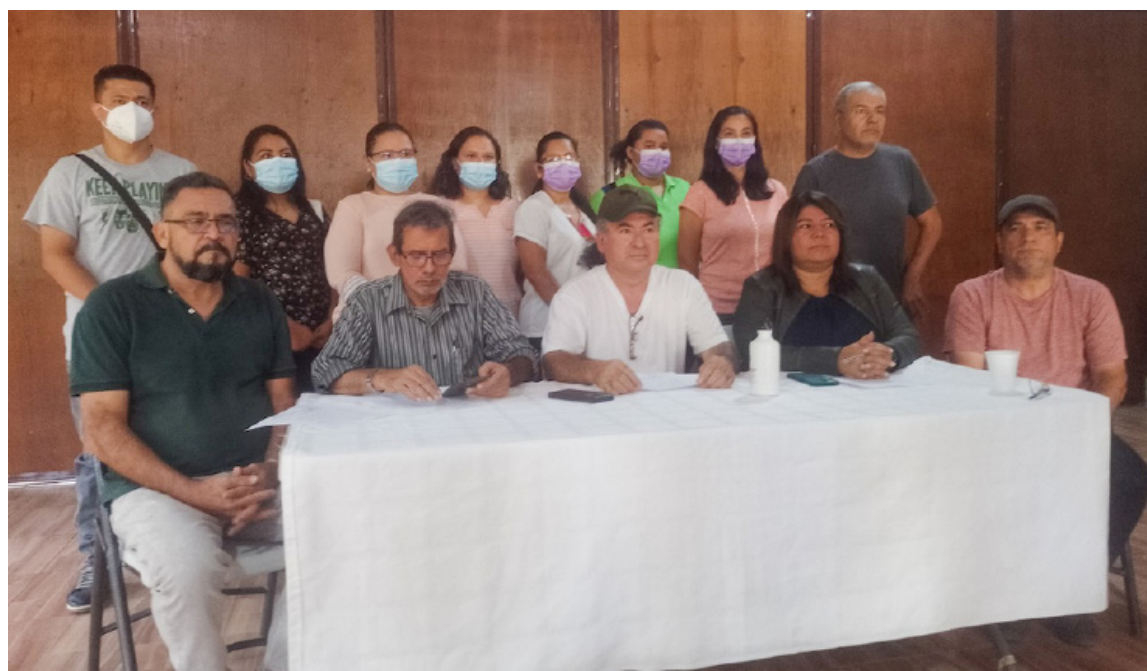
Miembros de la comunidad de Santa Marta y ADES denuncian la falta de resolución del proceso judicial de la Cámara de Segunda Instancia del centro de Cojutepeque, en donde los magistrados presentan discrepancia en el proceso.

Miembros de la Comunidad Santa Marta y de la Asociación de Desarrollo Económico y Social (ADES) denunciaron este lunes que la apelación a la Cámara de Segunda Instancia de la Segunda Sección del Centro de Cojutepeque, por el proceso judicial de los 5 detenidos el pasado 11 de enero, está siendo bloqueado por dos magistrados.