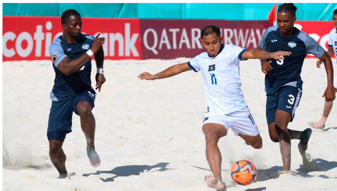
La selección de fútbol playa se exhibe y derrota sin problema a Islas Turcas, en el partido debut del Campeonato de Beach Soccer de CONCACAF 2023 rumbo al mundial.