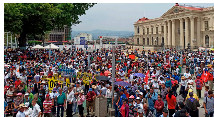
Las organizaciones que conforma el BRP expresan en que la multitudinaria marcha y concentración del 1o de mayo, participaron muchos sectores afectados por la política gubernamental.

El Bloque denunció que el gobierno lanzó al desempleo a 19,000 empleados públicos, mantiene a 400 sindicatos en la ilegalidad, despoja de sus tierras a miles de familias campesinas, persigue a opositores políticos y encarcela a miles de personas humildes e