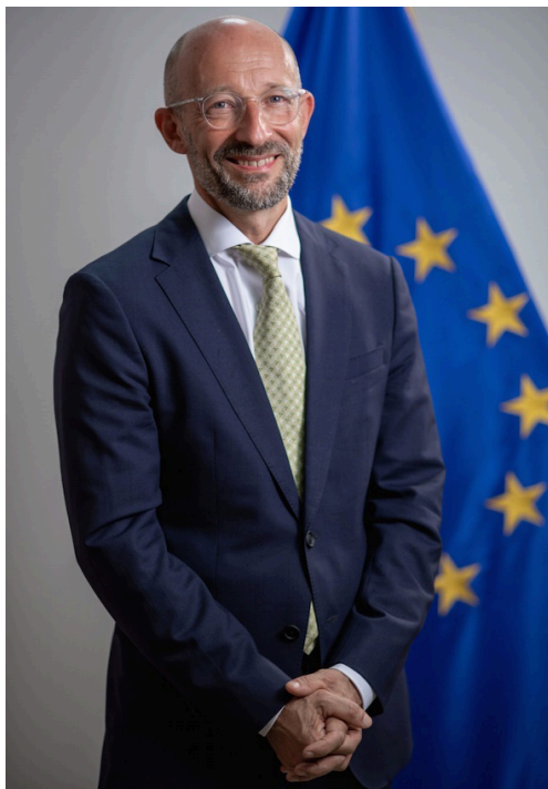
François Roudié Embajador de la Unión Europea @FrancoisRoudie