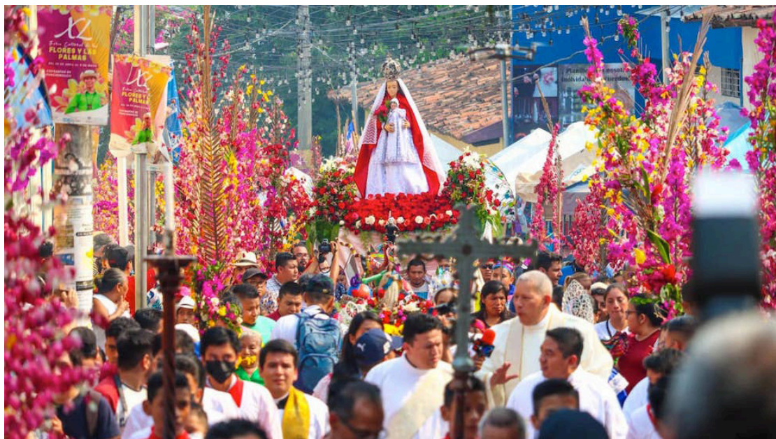
La procesión de las Flores y las Palmas, en Panchimalco, es en honor a la Virgen María, también se pide a Dios por una abundante cosecha.

Este reconocimiento también fue otorgado al Tata de las cofradías, Don Teofilo, quien es un elemento clave para seguir manteniendo viva esta tradición que se celebra desde hace