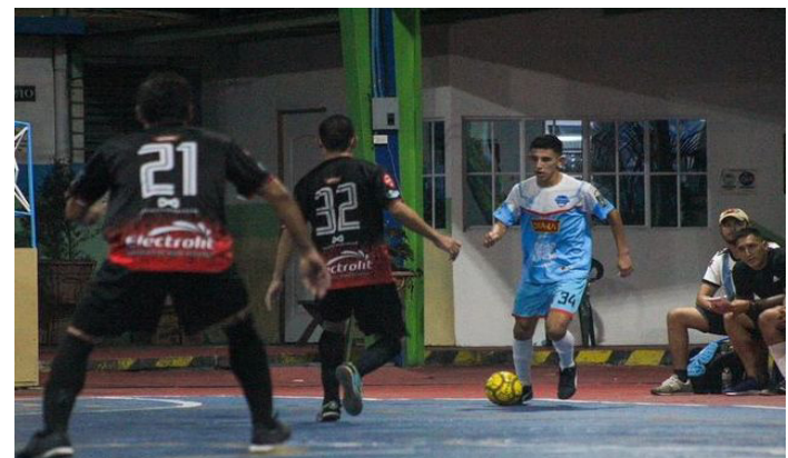
Ilopango responde con goleada a BeSport para ubicarse en la primera posición de la tabla de la Liga Mayor de Fútbol Sala, y avanza invicto.

que en la séptima, y Cuscatlán con 0 en la última casilla.