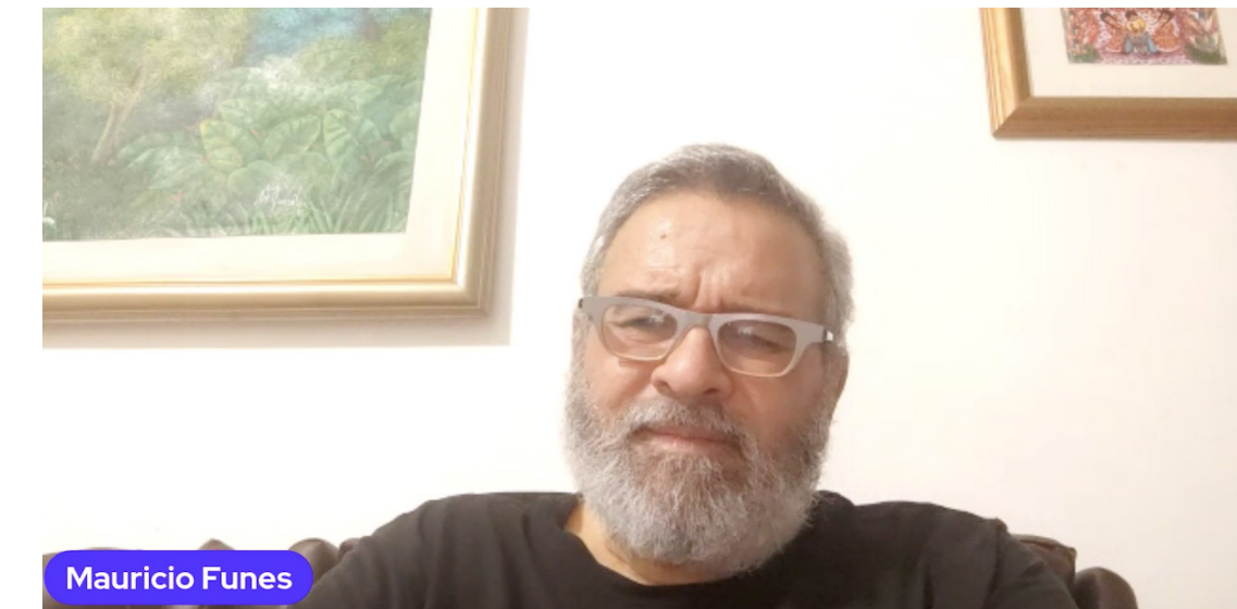
Mauricio Funes sostiene que nunca se le notificó el nombramiento del abogado defensor público en el juicio del caso tregua, donde fue condenado a 14 años de prisión.

Fue el Juzgado Especializado de Sentencia “C” de San Salvador que declaró culpable por los delitos de agrupaciones ilícitas, dándole una pena de 8 años, y por incumplimiento de deberes una pena de 6 años. Por los mismos delitos, fue condenado el exministro de Justicia y Seguridad Pública, David Munguía Payés, a este se le sumó el delito de actos arbitrarios. En total, a Payés se le condenó a 18 años. Tanto a Funes como a Payés se les culpó por presuntamente permitir que las pandillas “se fortalecieron económicamente y en territorio, a cambio de reducir el índice de homici-