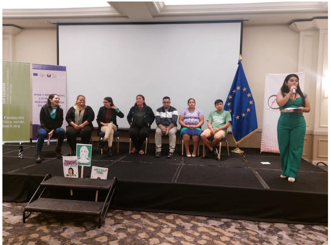
El consorcio de organizaciones : Colectiva Feminista, Agrupación Ciudadana contra la Despenalización del Aborto, AIETI, la Fundación Heinrich Böll Stiftung con el financiamiento de la Unión Europea, lanzan proyecto “Vivas y empoderadas, luchando por nuestros derechos en El Salvador”.

Mientras, para la segunda etapa esperan fortalecer los conocimientos y el diálogo sobre los