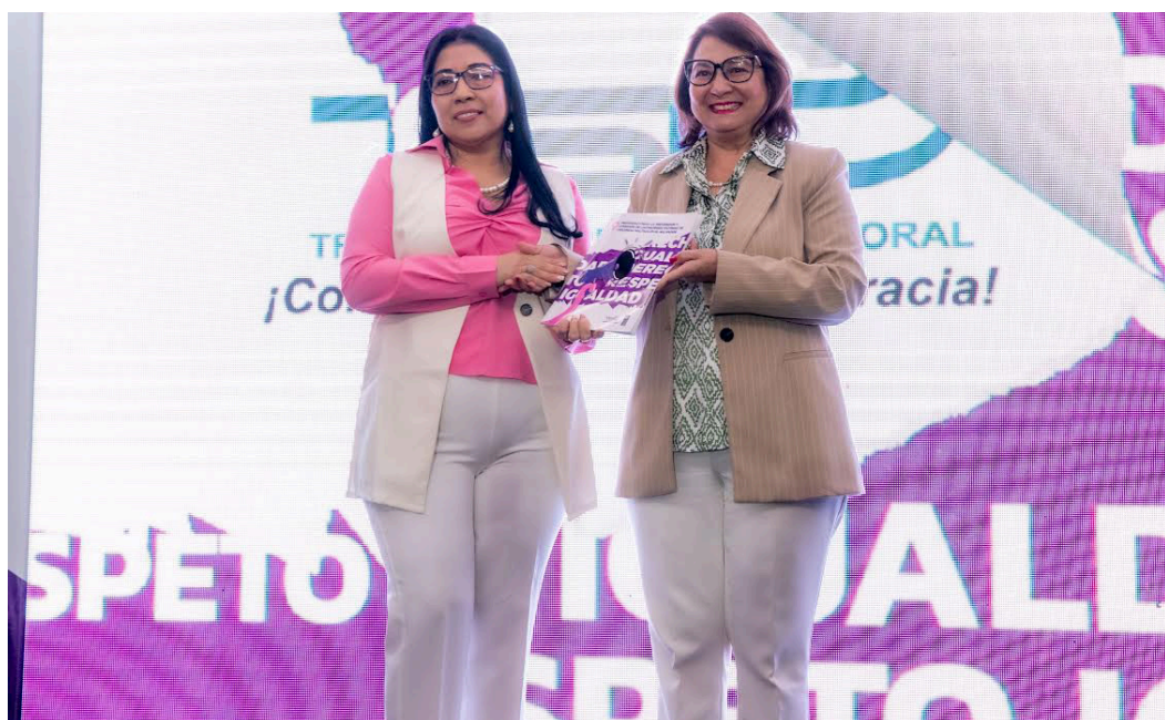
El TSE y PNUD El Salvador lanzan el protocolo de "Atención a Mujeres Víctimas de Violencia Política" en el país.