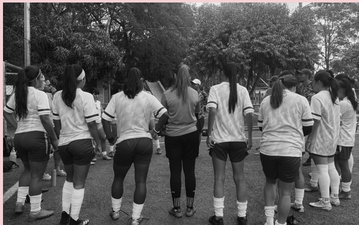
La Liga Femenina enfrenta un segundo paro en sus actividades deportivas ante los hechos ocurridos el fin de semana pasado. Hasta la fecha no se conoce cuándo se retomarán los partidos de semifinales.

Nuevamente, el fútbol profesional de El Salvador vuelve a estar en el limbo a causa de la reciente tragedia ocurrida en el estadio Cuscatlán, donde 12 aficionados fallecieron tras una estampida humana y un centenar más resultaron lesionados, situación que dejó con un eco de incertidumbre en la reanudación de la Primera División, sin embargo, esta situación también afectó los diferentes sectores del deporte rey del país. Ante ello ¿Cuál es la situación actual de las diferentes ramas del balompié?