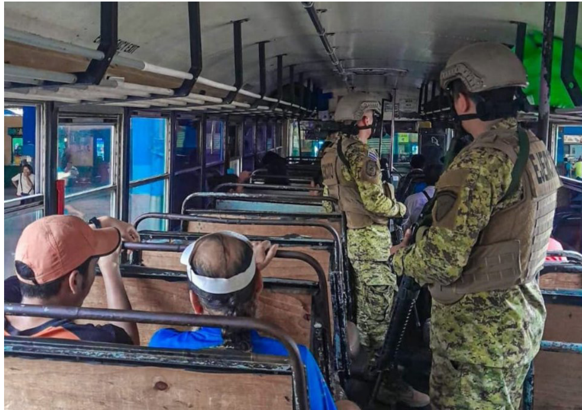
Fuerzas militares brindan seguridad ciudadana en el transporte colectivo como parte de las acciones del régimen de excepción.

Además, de expresar “preocupación” por el respaldo que el Gobierno salvadoreño ha