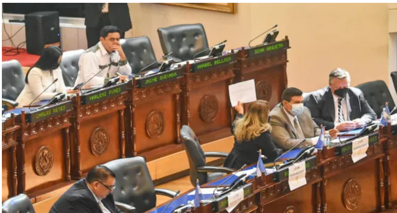
Tanto ARENA como el FMLN afirman que no harán coalición de cara a las elecciones de 2024; sino que buscan apoyar a la sociedad civil organizada.