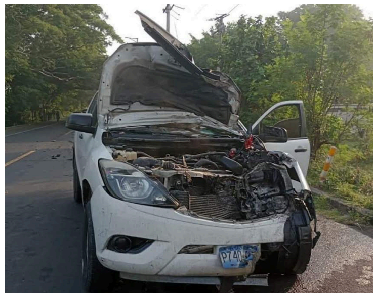
En el kilómetro 43 de la carretera Troncal del Norte, un motociclista por tratar de esquivar un perro, invadió el carril contrario e impactó de frente con un vehículo, falleciendo al instante.