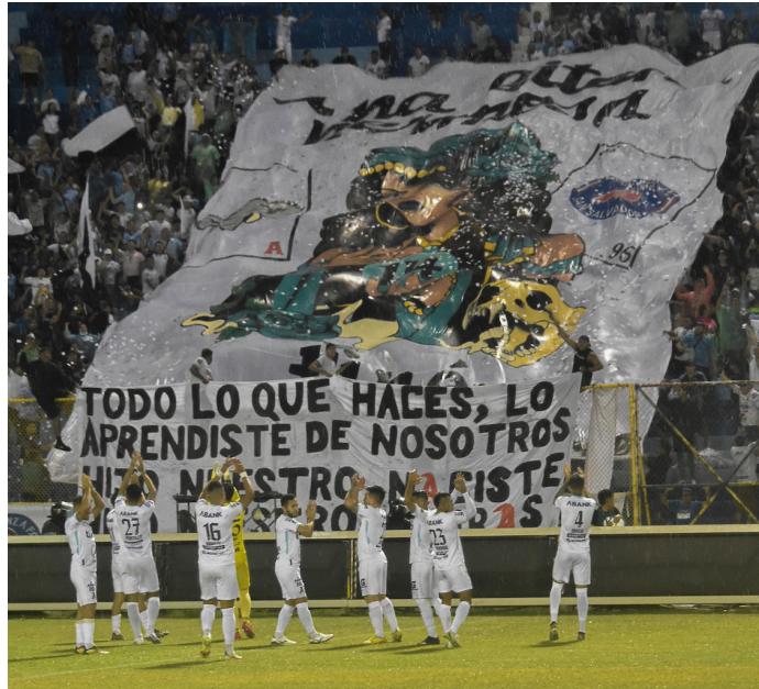
Alianza F.C. fue sancionada por la Comisión Disciplinaria de la FESFUT a jugar un año sin público y a pagar $30 mil por lo sucedido en el estadio Cuscatlán la noche del sábado 20 de mayo.