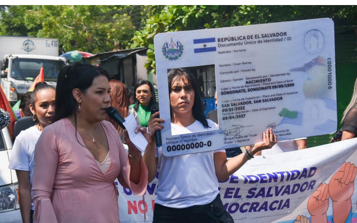
La Mesa por una Ley de Identidad de Género en El Salvador realiza un plantón frente a la Asamblea Legislativa, en el marco del Día Internacional contra la Transfobia, Homofobia y Bifobia.

Para Belloso, una muestra clara es la falta de voluntad cuando mandaron al archivo la primera propuesta de Ley de Identidad de Género, argumentando que era un tema que ya no tenía vigencia. En 2021 se presentó un nuevo proyecto de ley, pero la instancia legislativa nunca la ha puesto en la agenda.