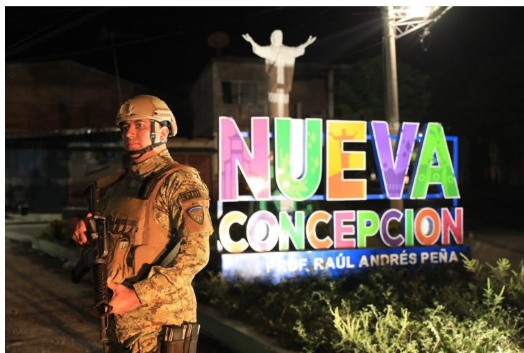
El cerco militar en Soyapango se instala a partir de este 17 de mayo y es con el objetivo de arrestar a los responsables del asesinato del agente policial.

Un nuevo cerco militar se ha instalado en el país, esta vez en Nueva Concepción, Chalatenango, luego que presuntos pandilleros asesinaron a un agente de la Policía Nacional Civil (PNC), mientras patrullaba la zona.