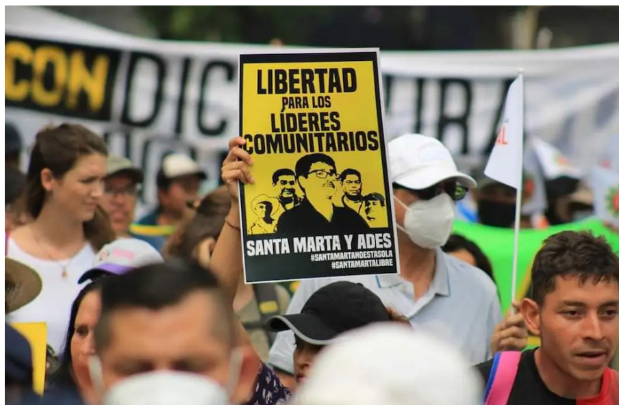
En enero de 2023, 5 líderes comunitarios fueron detenidos tras vincularse con un supuesto asesinato durante el conflicto armado.