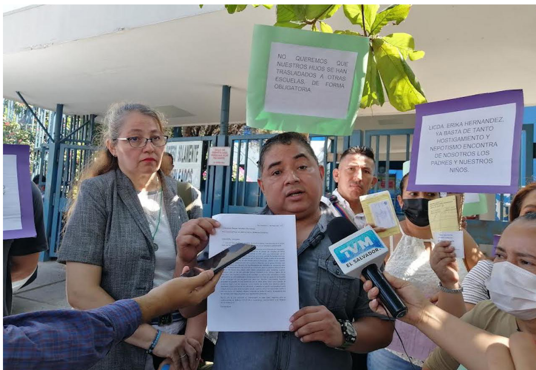
Madres y padres de familia, alumnos y docentes del Centro Escolar “Reinaldo Borja Porras”, dentro del Hospital Bloom rechazaron la decisión del Ministerio de Educación de cerrar las aulas estacionales a la niñez con enfermedades crónicas pero que no están internados en el hospital.

“Hubo una reunión con gente del despacho de la Primera Dama (Gabriela de Bukele), autoridades centrales y el Director Departamental de Educación y alegaron que los padres de familia estaban de acuerdo y que habían escogido las es-