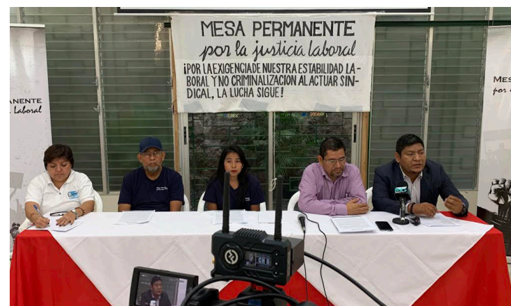
La Mesa Permanente por la Justicia Laboral (MPJL) denuncia que, en el país, no se están cumpliendo los derechos laborales de ningún ciudadano, además, existe vulneración a la libertad sindical.

“El alto costo de vida de la población se ha incrementado, la tarifas del transporte, energía eléctrica, agua potable, telefonía, internet; la canasta básica, el precio de la gasolina y el diésel, el precio del gas propano, y de los insumos agrícolas están elevadísimos y no existe un control de precios por parte de las instituciones competentes”, indicaron los representantes de la MPJL.