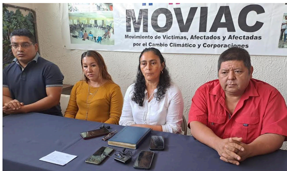
El MOVIAC considera que, con el pretexto de establecer una guerra contra las pandillas, el Gobierno busca desarticular las comunidades organizadas y movimientos sociales.

“En la Isla Tasajera, el gobierno apoyando a la familia Closa ha destruido cercos, casas y quemó plantaciones de marañón, con el fin de desarrollar megaproyectos turísticos”.