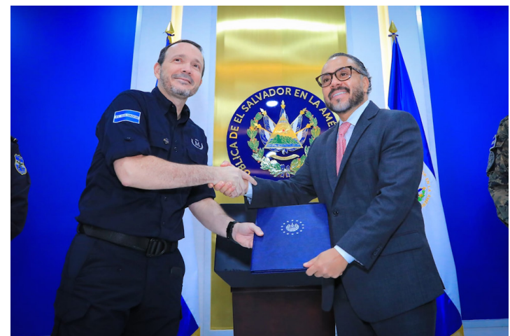
Momento en que el ministro de Seguridad, Gustavo Villatoro, entrega al presidente de la Asamblea Legislativa, Ernesto Castro, la solicitud para prorrogar el régimen de excepción.

El presidente del Congreso, Ernesto Castro, sostuvo que “sin