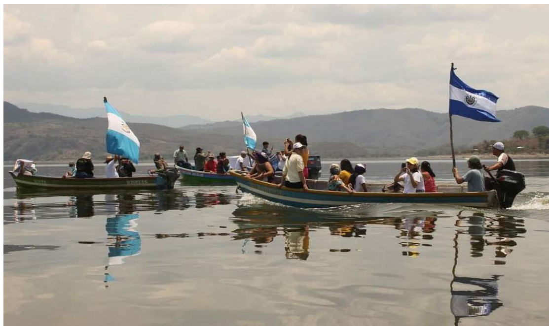
Organizaciones y comunidades transfronterizas de El Salvador y Guatemala, alzan su voz en contra del proyecto minero Cerro Blanco.

La polémica del proyecto minero Cerro Blanco data desde su nacimiento en 2007, con una licencia de exploración en el bolsillo de la minera y la presentación de un estudio de impacto ambiental de una mina subterránea, entregada por el Ministerio de Medio