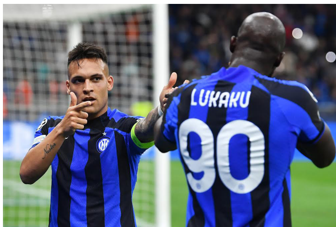
Lautaro Martínez y Romelu Lukaku celebran el gol del Inter en el partido de vuelta en las semifinales de la Champions League.

Sobre el primer tiempo, Theo Hernández generó uno de los pocos acercamientos de peligro para el Milán, equipo que en su intento por conseguir el empate en el global y buscar las oportunidades que alargaran el sueño por la Liga de Campeones, se implantó sobre el área de los