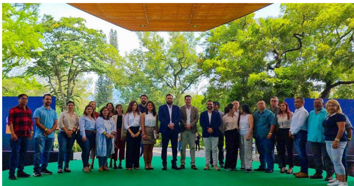
El primer Congreso Iberoamericano de Parques fue inaugurado con el objetivo de impulsar la gestión de los espacios públicos en el desarrollo de la población.

Este espacio será muy enriquecedor por el intercambio de experiencias y conocimientos entre expertos, que expondrán las últimas tendencias y prácticas en la gestión de parques públicos, privados y comunitarios, manifestó Durán en sus palabras de bienvenida.