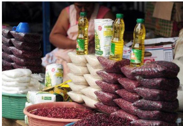
Los resultados del Primer Informe de Situación País 2023 del Instituto de Ciencia, Tecnología e Innovación de la UFG, indica un aumento de $30.40 en la canasta básica rural, donde vive la mayor parte de las familias pobres.

El Informe de Situación País 2023 detalló que la economía de El Salvador se desaceleró, en gran parte por el menor crecimiento