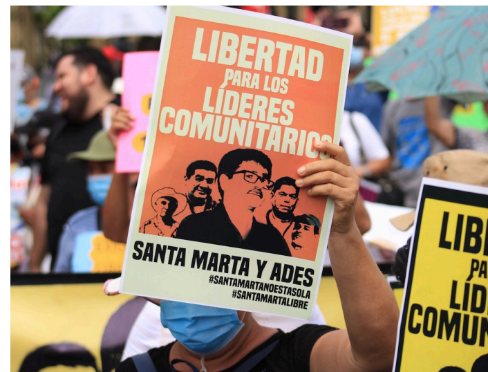
Mary Lawlor, relatora especial sobre la Situación de los Defensores de Derechos Humanos, pide la liberación de los cinco ambientalistas de la comunidad Santa Marta, municipio de Victoria, Cabañas.

Sin embargo, informes presentados por organizaciones de derechos humanos en sus evaluaciones sobre la situación de violencia a su labor, han identificado en sus análisis que el mayor agresor de las personas defensoras de derechos humanos, organizaciones sociales y periodistas, provienen del gobierno y de altos funcionarios, así como de troll centers.