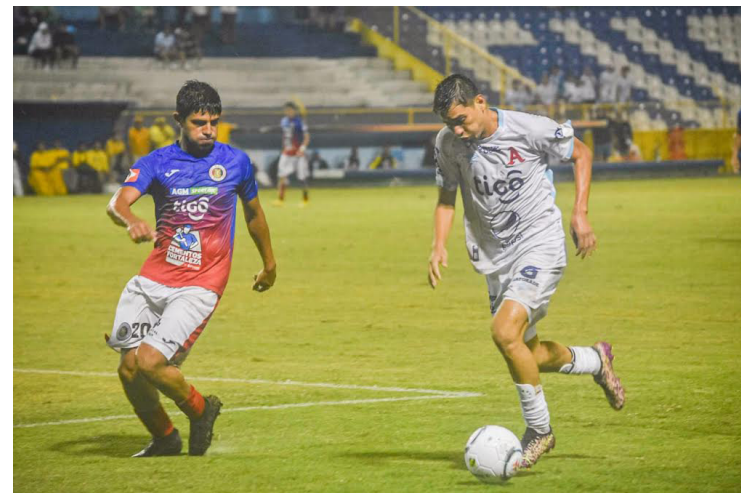
Alianza se enfrentará nuevamente al campeón del fútbol nacional para conseguir la primera victoria de los cuartos de final.

El precio varía entre los $6, $12 y los $18 para la afición de ambos clubes. Respecto a esta serie, el tanque fronterizo se impuso 2-0 a los jaguares en la fecha