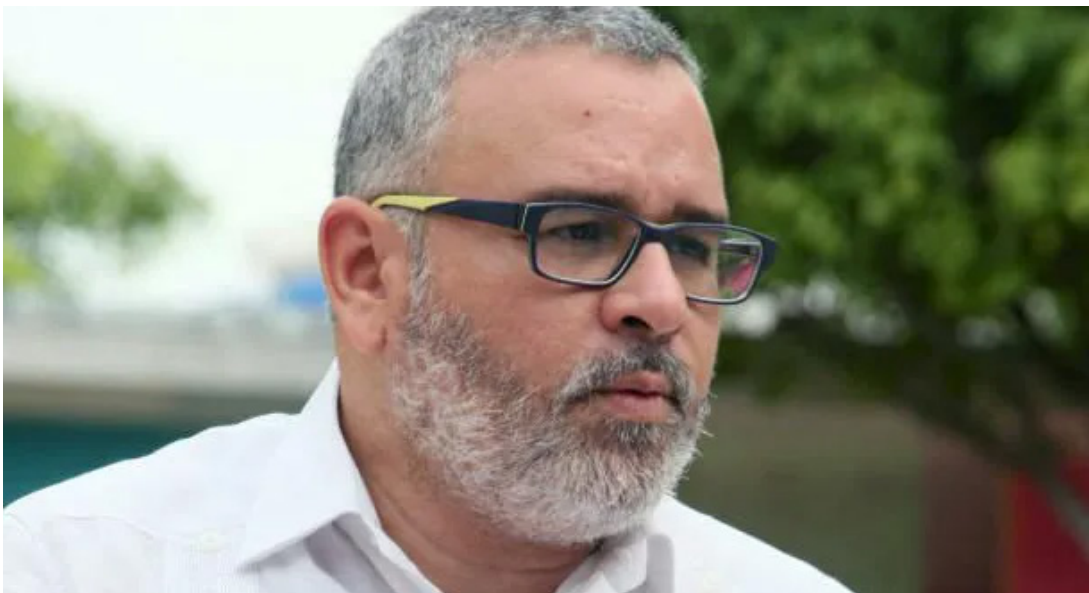
Mauricio Funes, expresidente de la República asegura que la FGR no presentó mayores pruebas sobre los delitos que a él y Payés se le imputan en el Caso Tregua.