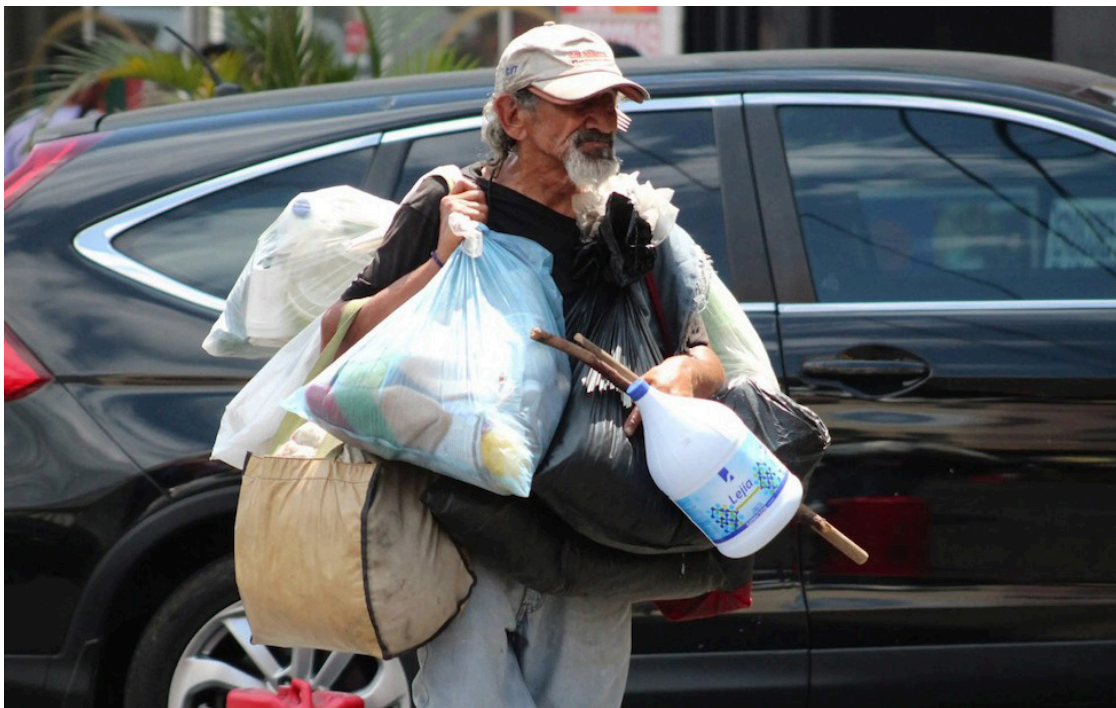
La CIDH y REDESCA señalan que la pandemia del COVID-19 agravó los derechos de las personas en situación de calle.