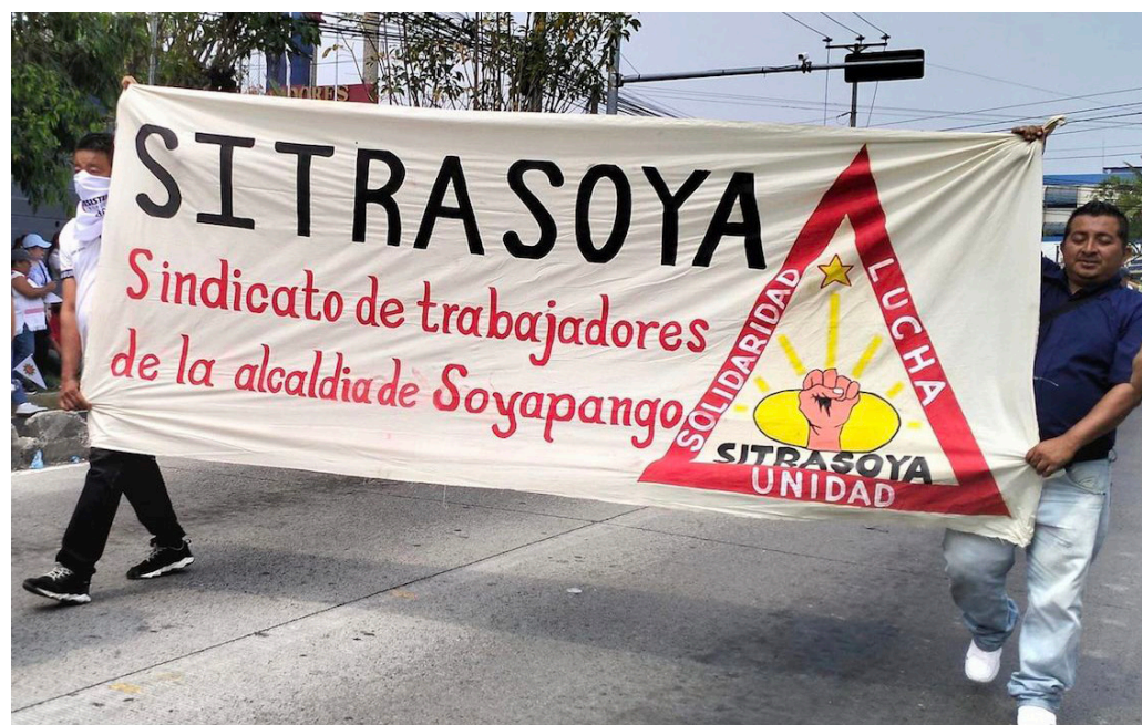
El concejo municipal de Soyapango con mayoría gobernada por el partido Nuevas Ideas, el pasado 12 de mayo aprobó un acuerdo para suprimir centenares de plazas.