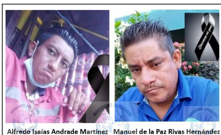
Socorro Jurídico reitera que desde el inicio del Régimen de Excepción, 200 personas han fallecido dentro de centros penitenciarios, el 92% no estaba perfilada como pandilleros.