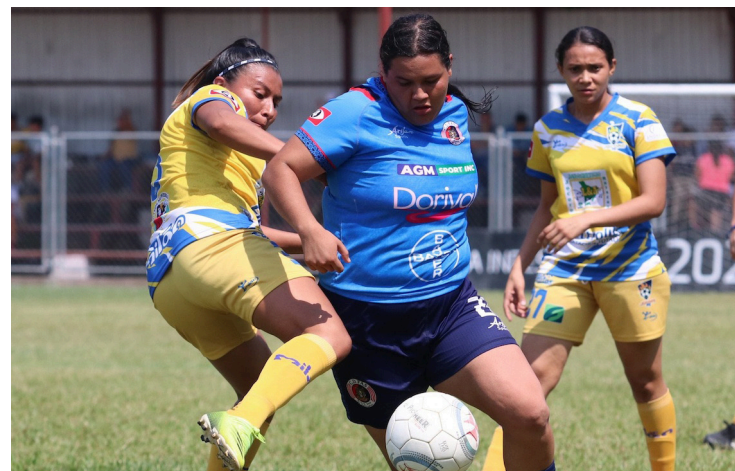
FAS Femenino congigie el último boleto a las semifinales del torneo Clausura 2023, luego de ganarle a Jocoro con global de 1-4.