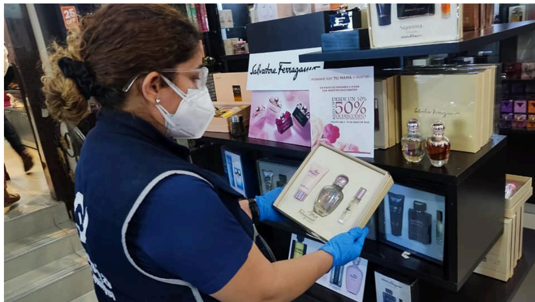
El 67% de los salvadoreños aprovecha las promociones, ofertas y descuentos para adquirir los regalos en el Día de las Madres.

Cada 10 de mayo los salvadoreños le rinden un tributo especial de reconocimiento y admiración a todas las madres, la mayoría decide celebrarlo en familia, ya sea con una comida especial, pasteles o un detalle para el ser que les dio la vida.