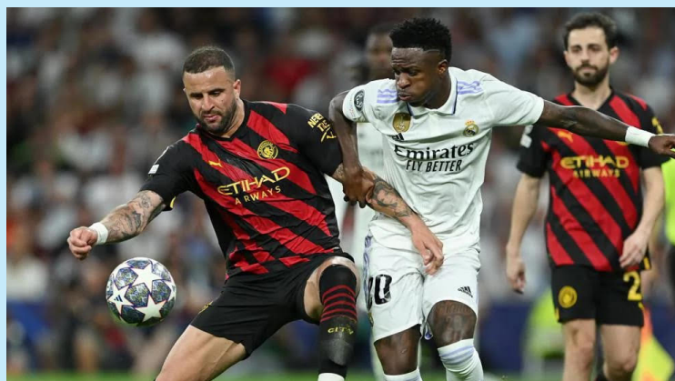
El Real Madrid y el Manchester City empatan por la mínima en el primer episodio de las semifinales de la Champions League.

De Bruyne respondió al Madrid 22 minutos después del entretiempo, contraataque en colectivo entre Grealish, Bernardo Silva, y el belga que puso el gol desde la zona frontal desde fuera del área. Los ingleses vieron la luz con empate, un resultado que podrán dominar con mayor confianza en el Etihad stadium el próximo miércoles 17 de mayo.