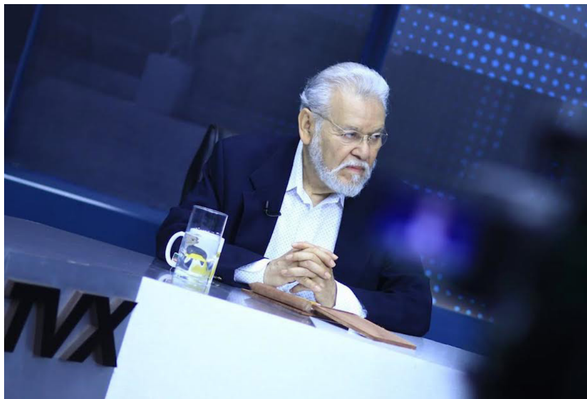
Carlos Vela en su visita a El Salvador participa en medios de comunicación, para analizar la situación política nacional.

“No podemos estar pensando por todas las leyes y programas que tiene el Gobierno, eso es lo que hay que derrotar. No es fácil pero sí se puede hacer. Esas propues-