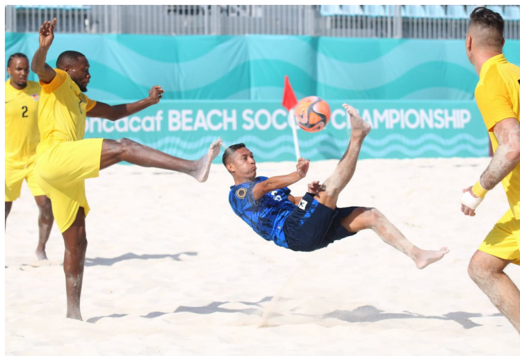
La Selecta de playa golea a Guadalupe para sentenciar su presencia en los cuartos de final del Campeonato de Beach Soccer de CONCACAF 2023.