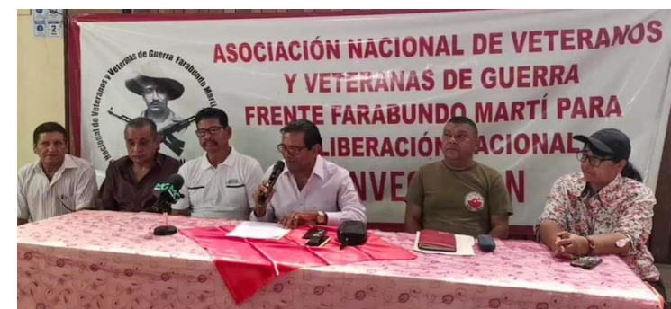
La Asociación Nacional de Veteranos de Guerra del Frente Farabundo Martí para la Liberación Nacional (ANVEGEFMLN) condena el incumplimiento de todas las promesas y compromisos, que el presidente Bukele asumió en su campaña electoral con los veteranos.

El presidente de ANVEGEFMLN exhortó a que se cumpla la ley y les otorgue el aumento a una la pensión de $300 sin ningún reparo, así como el pago de la prime-