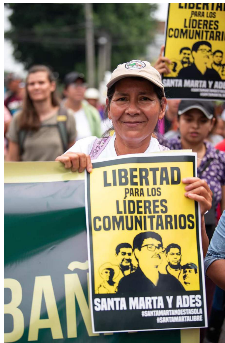
La Cámara de la Segunda Sección del Centro de Cojutepeque, resuelve y niega que los líderes comunitarios de Santa Marta y ADES, se mantengan libres durante su proceso judicial.

“Mientras, el magistrado Alvarado Ponce consideró viable revertir la detención y valoró como desproporcionada e ilegal la prisión preventiva de los ambientalistas, citando abundante jurisprudencia de la propia Cámara,