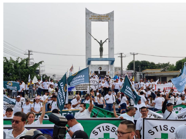
En la marcha del 1º de mayo, los sindicatos aglutinados en la Unidad Sindical Salvadoreña (USS) muestran su respaldo a la reelección presidencial, además, piden una nueva ley para las empresas de seguridad e incremento al salario mínimo por lo menos de $400. FOTO DIARIO CO LATINO/@UNIDADSINDICAL_.

Sostuvo que otra de las exigencias es dar respuesta a los agentes de seguridad privada, pues ya van dos años cuando se presentó la propuesta de la nueva ley y siguen esperando respuesta.