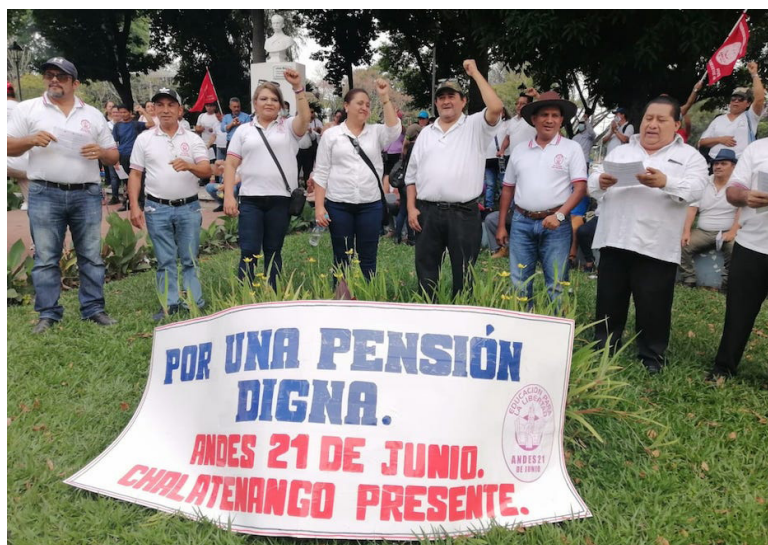
ANDES 21 de JUNIO señala su inconformidad con la Ley Integral del Sistema de Pensiones, porque solo favoreció a los trabajadores quienes ganan el salario mínimo y los pensionados; no así al sector docente y otros profesionales que ganan más de 2 salarios mínimos.

Los maestros consideraron que la Ley Integral del Sistema de Pensiones solo favoreció a los trabajadores que ganan el salario mínimo, y a quienes estaban pensionados, al