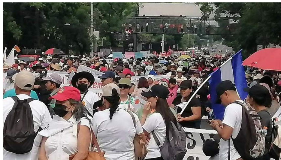
Las arbitrariedades cometidas en el marco del régimen de excepción que ya cumplió un año de vigencia se convirtió en una de las acciones de gobierno más criticada por los trabajadores y trabajadoras, que consideran afecta el estado democrático. Por lo que participaron en la marcha del 1o de mayo, que válida los derechos laborales de la clase trabajadora.

Asimismo, consideró que todo el contexto del Régimen de Ex-