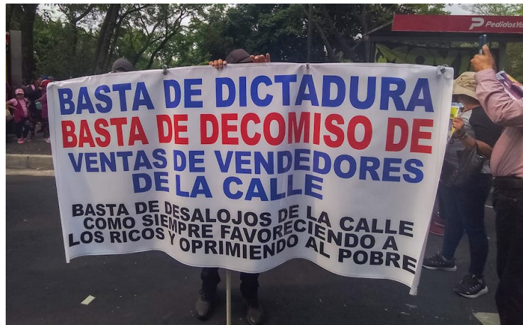
Represión y ausencia de un Estado de Derecho, es el contexto en el cual, la clase trabajadora salvadoreña continuará reivindicando sus derechos laborales y humanos.

"En El Salvador, la situación no difiere del resto del mundo, aún existen despidos