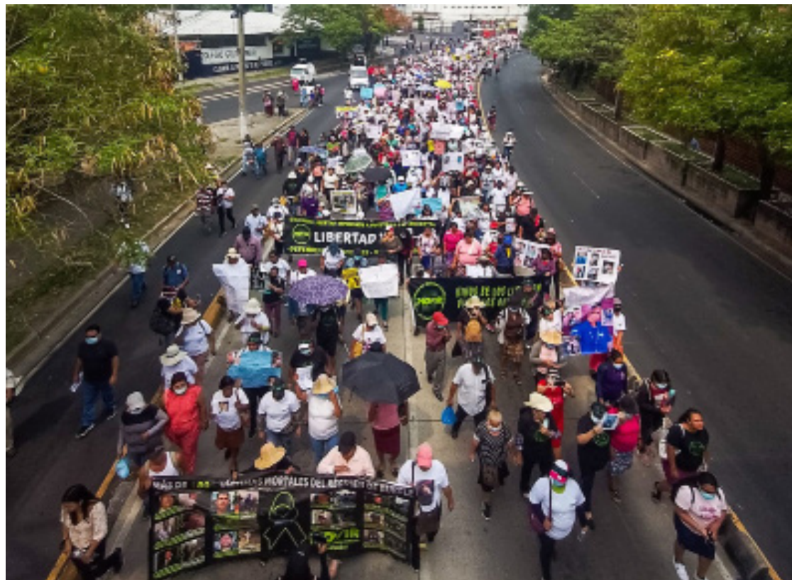
Miles de trabajadores marcharon la mañana de este lunes por las principales calles de San Salvador para exigir el cumplimiento y políticas a favor de la clase trabajadora.

Miles de salvadoreños se reunieron en un solo movimiento con diversos mensajes en pancartas para exigir al Estado que a través de la conmemoración de este 1 de mayo todos los derechos sean reivindicados a favor de la clase trabajadora, porque al no