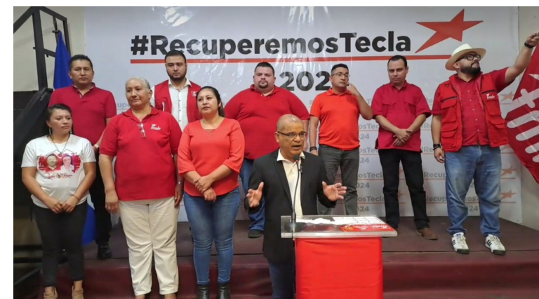
El FMLN presenta el primer grupo de precandidatos a diputados del departamento de La Libertad, quienes inician el proceso de inscripción correspondiente, tal como lo señala el Reglamento Interno y Estatutos del partido.