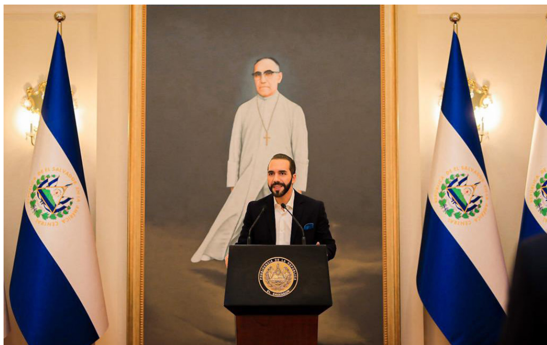
Bukele tiene previsto llegar este jueves a la Asamblea Legislativa a rendir un informe de sus 4 años de gestión.

El opositor dijo que en este primero de junio “quisiéramos escuchar un mensaje de propuesta y no de insultos a la oposición”.