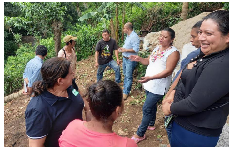
Pro Vida y la municipalidad de Nahuizalco, departamento de Sonsonate, colocan la primera piedra para el inicio de la construcción del Sistema de Captación de Aguas Lluvias con Lavaderos Públicos.

Estos proyectos también se han enfocado en las mujeres rurales que experimentan mayores obstáculos para obtener de manera integral su derecho fundamental a la salud y la educación. Así como, las escasas posibilidades de obtener servicios básicos para el desarrollo de sus vidas siendo sujetas de derechos.