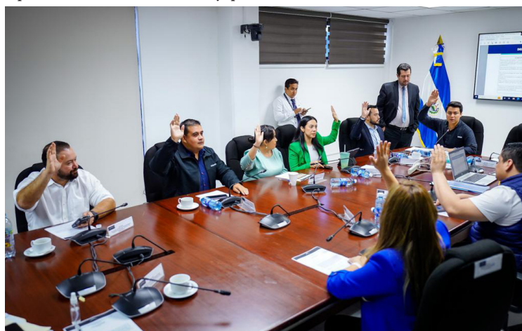
El traslado de dinero permitirá el pago de sueldos, contribuciones patronales, aguinaldos, financiar el beneficio de la canasta básica para beneficiarios de FROPOLYD, financiar el otorgamiento de créditos, entre otros.

El traslado de dinero permitirá el pago de sueldos, contribuciones patronales, aguinaldos, financiar el beneficio de la canasta básica para beneficiarios de FROPOLYD, con-