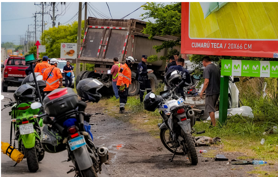
La PNC y cuerpos de socorro reportan un accidente de tránsito en la calle que conduce al desvío de San Juan Opico, La Libertad. Hasta la fecha se contabilizan 7,167 accidentes de viales; 4,356 personas lesionadas y 497 fallecidos.