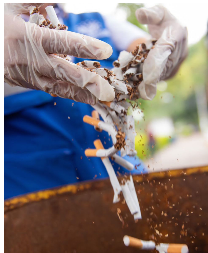
El consumo de tabaco causa anualmente 8 millones de muertes en el mundo y un millón en el continente americano. Afirma el director de la OPS, Doctor Jarbas Barbosa.

La Organización Panamericana de la Salud (OPS) enmarcó en el Día Mundial Sin Tabaco mensajes claros como que el tabaco daña el medio ambiente. Y que este cultivo envenena aguas, suelo, playas y calles de ciudades, con los productos químicos