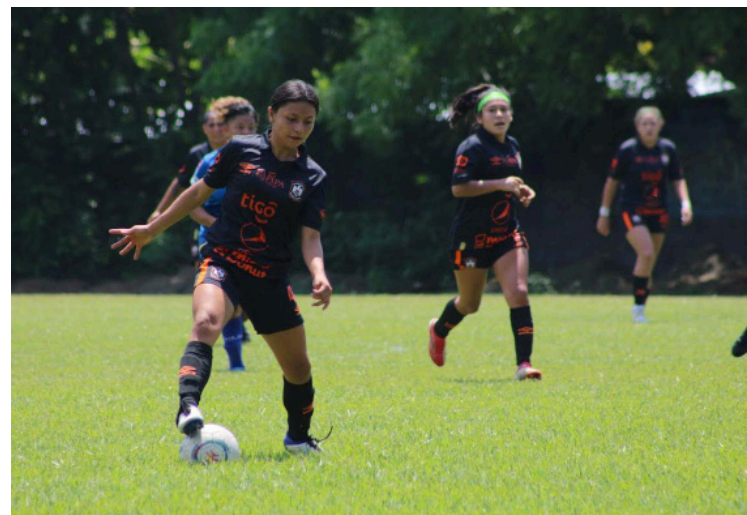
La Liga Mayor Femenina pide profesionalización ante falta de contratos profesionales y condiciones adecuadas.