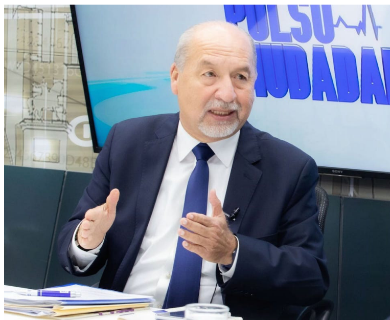
El magistrado del TSE, Guillermo Wellman, enfatiza que con el voto desde el exterior están a cero y corren el riesgo que ninguna empresa brinde el servicio.

“Descarto totalmente el fraude, con este organismo colegiado lo descarto totalmente, el llamado a la población es a que confíen en el Organismo Elec-