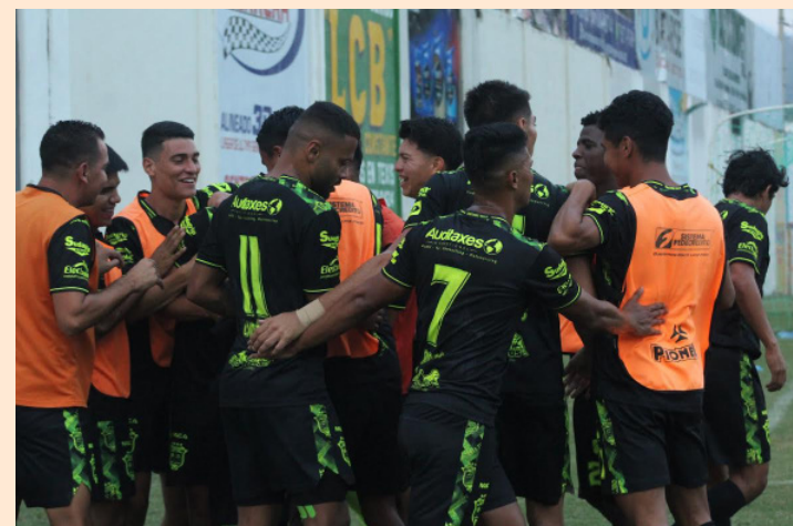
Jugadores de cuatro equipos de Primera División denuncian que los equipos no han cancelado salarios por más de un mes a pesar de que el torneo Clausura 2023 ya finalizó.

Este martes, la Federación Salvadoreña de Fútbol (FESFUT), a través del Comité de Regularización, solicitó los diferentes clubes de Primera División que los próximos contratos con jugadores deben ser con base a las normativas de la FIFA, como míni-