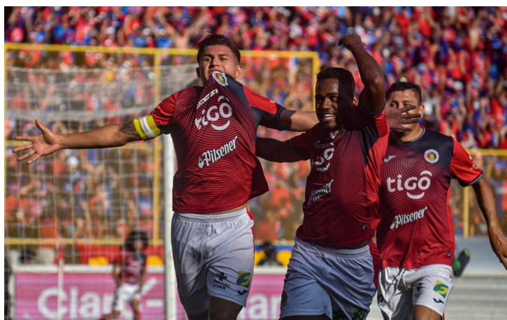
FAS incrementa su presencia en la azul y blanco al prestar 7 jugadores para el sexto micro ciclo dirigido por Hugo Pérez.

Los dos encuentros restantes de la jornada se llevarán a cabo el miércoles 3 de mayo. Primero, Dragón ante Firpo en el Juan Francisco Barraza a las 3:15 p.m. y a las 7:15 p.m. Alianza recibirá a FAS para redimirse del sabor amargo del partido ante Isidro Metapán, donde dejó escapar los tres puntos tras el empate en el partido del jueves pasado.