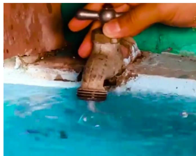
El Banco Mundial (BM) otorga un financiamiento de $100 millones para el “Proyecto de resiliencia del sector del agua en El Salvador”, que ayudará mejorar la calidad, fiabilidad y eficiencia de los servicios de abastecimiento de agua.