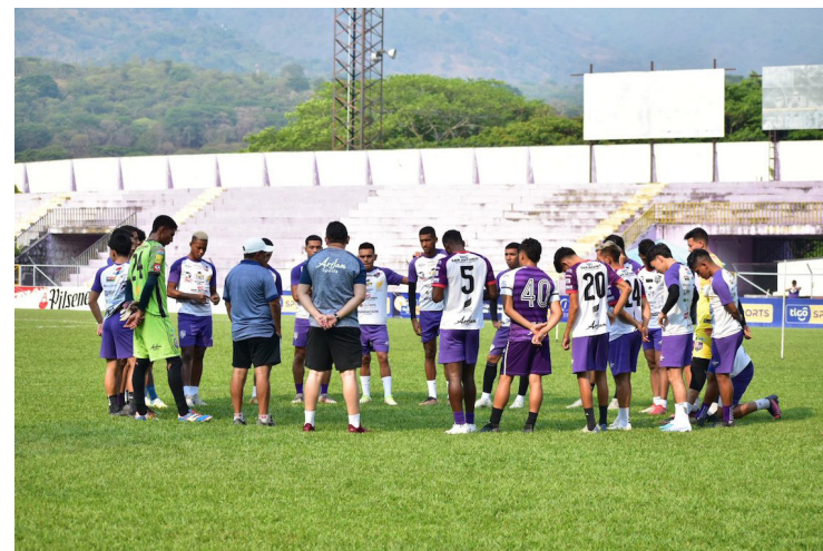
La jornada 20 del Clausura será un escenario para los equipos de la Liga Mayor para sentenciar la clasificación o el descenso.

Un duelo candente disputará Chalatenango en calidad de local ante Platense media hora después, el cuadro aún está dentro de la zona roja, no tanto como los alacranes pero si, en disputa en su mayoría con Firpo. Los alacranes llegan de dos derrotas, urgidos por ir por el resultado al ser el principal candidato al descenso y las próximas jornadas serán indispen-