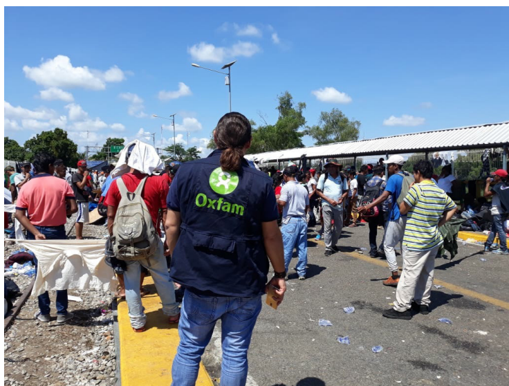
Foto de migrantes en México.

“La Unidad Especializada en Combate al Secuestro continúa con las investigaciones sobre los hechos que derivaron en la privación ilegal de la libertad de estas personas, y busca identificar a quien o quienes participaron en la retención forzada de los migrantes”, agregó la Fiscalía de Sonora.