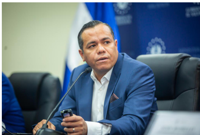
El ministro de Hacienda, Alejandro Zelaya, enfatiza que el 2 de mayo vence el período para declarar la Renta, el trámite puede llevarse a cabo desde el sitio web https://www.mh.gob.sv.

“Le recuerdo a nuestros contribuyentes que el período para la declaración de Renta vence el 2 de mayo, le pido a los salvadoreños que no esperen hasta el último día. Normalmente para presentar el trámite finaliza el 30 de abril, pero este año es una fecha no hábil, por tanto el período se extiende al 2 de mayo”, explicó el ministro de Hacienda, Alejandro Zelaya.