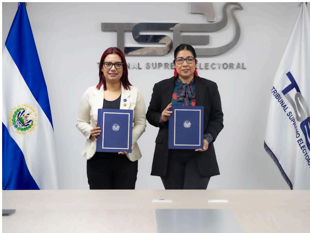
El TSE y el CONAIPD firman un convenio de cooperación interinstitucional, para garantizar el derecho del sufragio en condiciones de igualdad, libres de barreras o prácticas de discriminación.