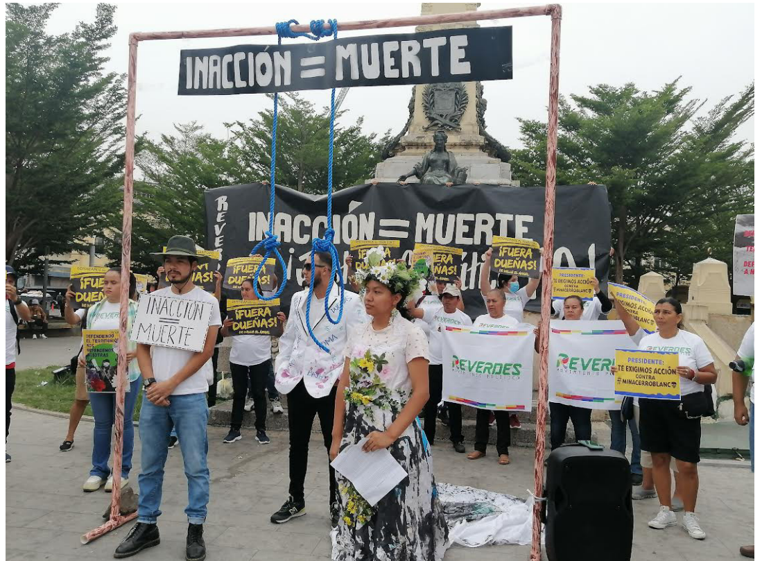
En el marco del Día Internacional de la Tierra el Movimiento Político Rebelión Verde El Salvador (ReverdES), se pronunció por una política nacional coherente orientada a la conservación de los ecosistemas del país y la protección de la vida de sus habitantes.

“En el caso de nuestro país su aporte a las emisiones globales de gases de efecto invernadero son insignificantes, pero existen acciones y políticas depredadoras de nuestros bienes natura-