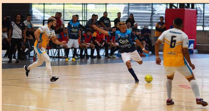
Los equipos de Fútbol Sala retoman las actividades oficiales de la liga, con la jornada 1 del torneo, luego del paro deportivo que se sufrió desde 2022.

Luego de la crisis futbolística que atravesó El Salvador en julio de 2022, ante las incidencias provocadas por el Instituto Nacional de los Deportes de El Salvador (INDES) al intervenir la Federación Salvadoreña de Fútbol (FESFUT), que estancó las actividades futbolística en general, incluso hasta con una amenaza de una posible sanción de la FIFA, las disciplinas que seguían estanca-