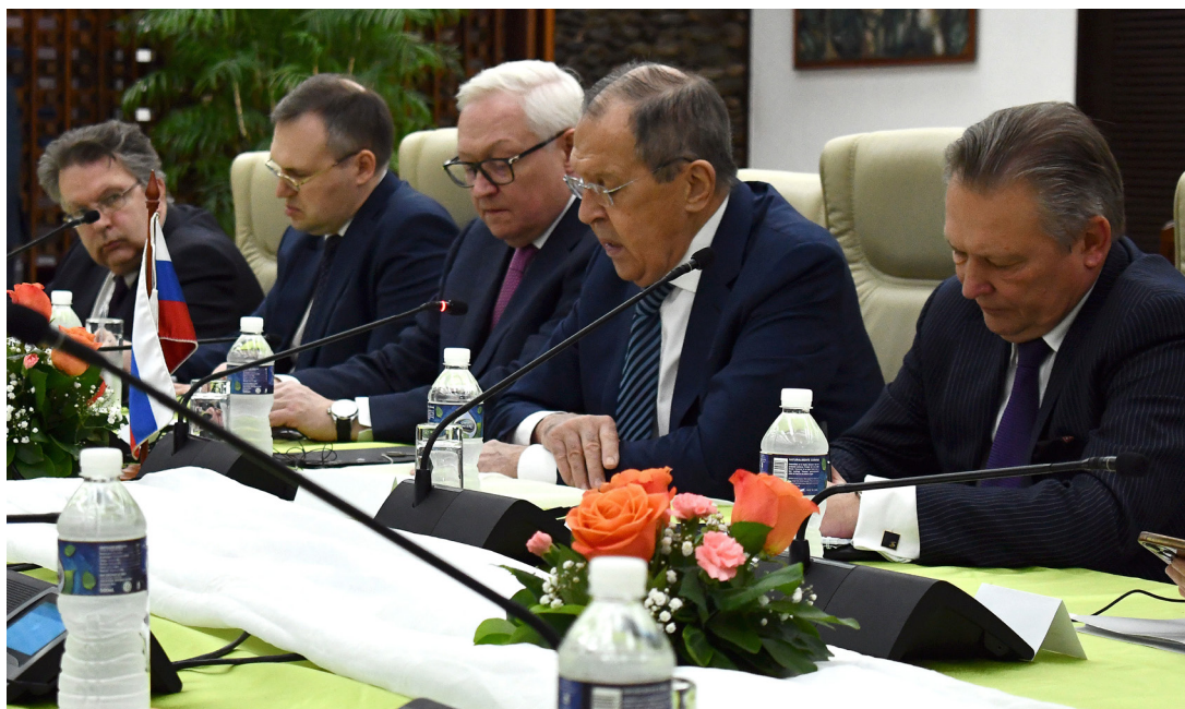
El ministro de Relaciones Exteriores de Rusia, Serguéi Lavrov (2-d), participa en una ronda de conversaciones, en La Habana, capital de Cuba, el 20 de abril de 2023. Serguéi Lavrov afirmó el jueves en la ciudad de La Habana que su país seguirá trabajando con Cuba en la arena internacional.

“Tenemos un amplio diálogo político y multidimensional entre presidentes, gobierno, parlamentos y cancillerías. Contamos con un mecanismo de consulta donde se abordan