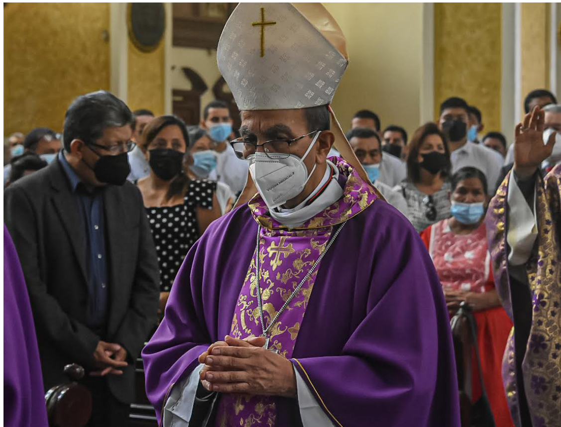
El cardenal Gregorio Rosa Chávez es un fuerte crítico del actual gobierno ya que Nayib Bukele, presidente de la nación, ha sentado las bases para socavar la democracia y el estado de Derecho.

- Bukele ha vuelto a la política de mano dura contra las pandillas. Esto nunca ha funcionado. ¿Cómo lo valora? Es el drama humano más doloroso. Ninguna persona que crea en la dignidad humana puede estar de acuerdo con esta política. En la propuesta del Gobierno no hay ningún componente de rehabilitación. El pandillero ha sido demonizado de tal manera que está destinado a morir en la cárcel. Ha sufrido tanto la población el azote de las pandillas que, atenazada por el miedo, piensa que si un pandillero es liberado, volverá a sus andadas. Por tanto, la opción es encerrarlo para toda la vida. Se