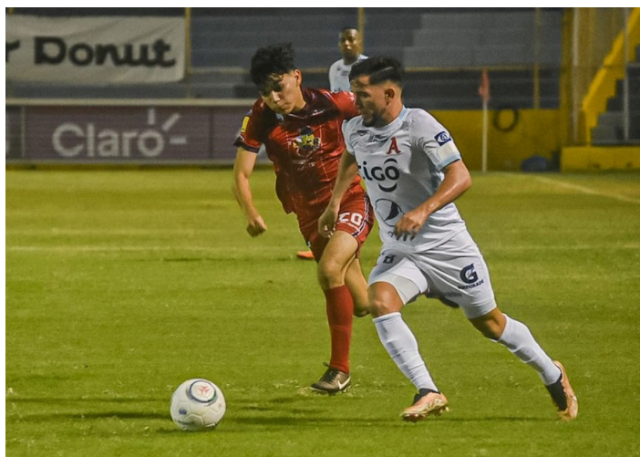
Chalatenango dará pelea por su permanencia en Primera División en las últimas cinco fechas de la fase regular del Clausura 2023.

Platense y Firpo están en la posición 10 y 9, con 29 y 30 puntos, respectivamente. Los gallos vienen de 3 derrotas y 2 empates,