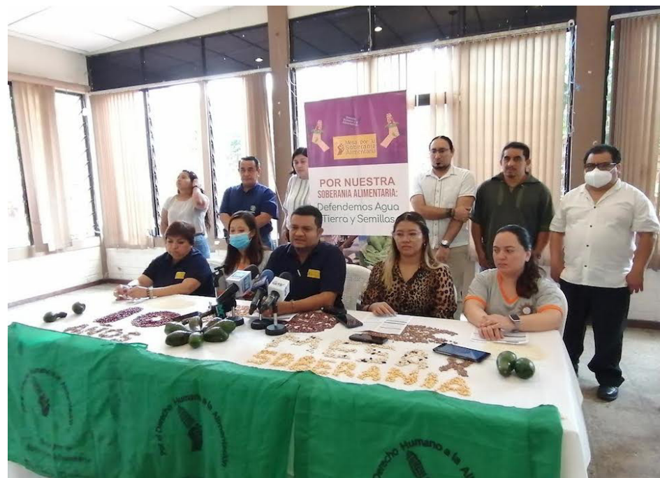
La Mesa por la Soberanía Alimentaria demandó al gobierno llevar a la realidad el Plan de Rescate Agropecuario, frente a la crisis alimentaria inminente.

No obstante, Blanco lamentó el “silencio” del Ministerio de Agricultura y Ganadería (MAG) y de otras institucio-