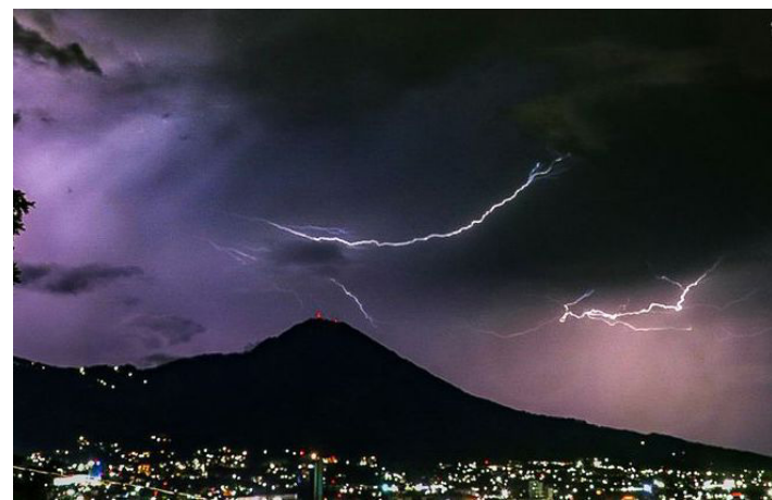
Madre e hijo murieron al ser impactados por un rayo cuando se encontraban bajo una champa en los alrededores del lago de Güija, al momento de una tormenta el pasado miércoles.

Cortez afirmó que la MPGR ha estado trabajando en la cuarta fase, la cual corresponde a la Gestión Local del Riesgo, “es decir, que las comunidades también trabajen su gestión local, porque son las comunidades quienes sufren los impactos y deberían tener claridad de las amenazas en su entorno, de las acciones, rutas de evacuación y medidas de mitigación si fuesen necesarias, vemos que hay colonias inundadas y la gente no sabe qué hacer”, reiteró.