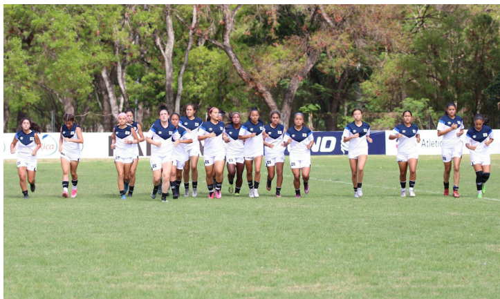
La selección sub-20 femenina se enfrentará a Canadá este sábado para buscar el boleto al mundial.