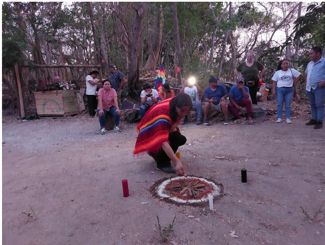
La ceremonia de inicio de ciclo es un espacio de participación de espiritualidad, ya que esta zona es considerada el lugar de nacimiento del taita por lo cual, se agradece a los sagrados elementos: Agua, Aire, Tierra y Fuego.

Aquino proviene de Santiago Nonualco, una de las poblaciones originarias más fuertes del ahora llamado Estado salvadoreño, se caracterizaron por ser una comunidad bien estructurada, y la cual sufrió el golpe directo de los invasores, luego enfrentó a los criollos quienes impusieron drásticas medi-