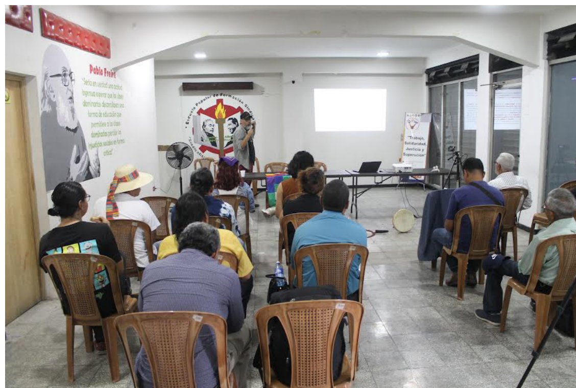
La Asociación de Arte y Cultura para el Desarrollo Social (As-Arte), desarrollan un conversatorio en cual se analizó desde la academia, la historia y los conocimientos ancestrales la vida del líder indígena.

En términos generales Lara Martínez coincide con los panelistas del conversatorio posterior, en relación a que Aquino era un personaje que gozaba de liderazgo, era respetado y muy