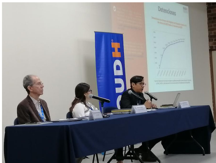
El Observatorio Universitario de Derechos Humanos (OUDH), presenta su cuarto informe “El estado de los derechos humanos en El Salvador, junto al Instituto de Derechos Humanos de la UCA (IDHUCA).

Santos señaló la complejidad del acceso a la justicia, que proviene como primer elemento “la centralización del poder”, que vulnera las garantías de cualquier personas y pueden ser detenidas aun que estas presenten su arraigo