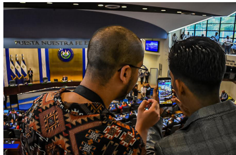
Las transmisiones en vivo es la forma por la que youtubers hacen su contenido en la Asamblea Legislativa.

Decenas de youtubers y generadores de contenido en redes sociales respondieron al llamado del presidente de la Asamblea Legislativa, Ernesto Castro, para asistir al Congreso y dar cobertura a la sesión plenaria ordinaria de este martes. Los youtubers y generadores de contenido superaron, en número, a los periodistas nacionales que dieron cobertura a ese órgano de Gobierno.