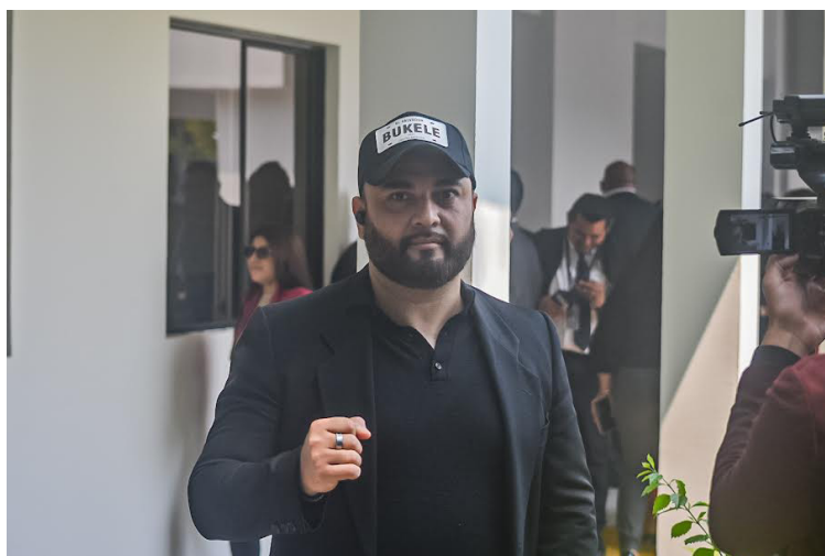
Algunos youtubers llegan con vestimenta alusiva al Gobierno o al presidente de la República tal y como se muestra en fotografía.