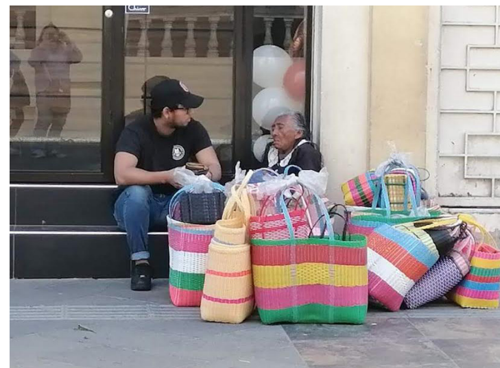
La Organización Panamericana de la Salud (OPS) la serie “Envejecimiento Saludable” para la región de las Américas con el fin de dotar de estrategias y políticas públicas a los Estados sobre el estado de vida de personas adultas mayores, que demandan entornos más amigables y mejor salud.

Asimismo, estos documentos contienen muchos artículos que