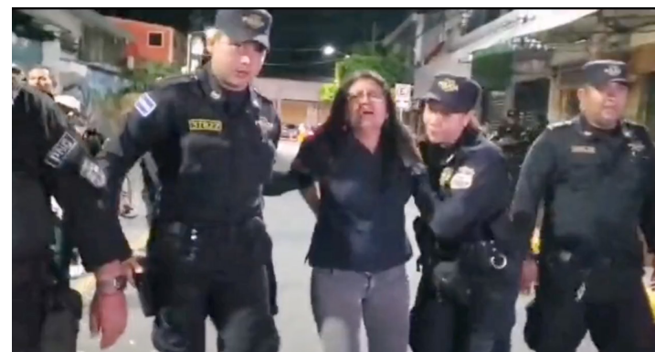
Diferentes sindicatos denuncian la persecución política y criminalización desatada por parte del gobierno, desde el inicio del Régimen de Excepción hasta la fecha se contabilizan 16 capturas ilegales y arbitrarias de sindicalistas.

zaron a tener una serie de fallas, despidos masivos, a muchos no se les ha pagado su correspondiente indemnización, los actuales empleados tampoco gozan de un beneficio económico a pesar del alto costo de la canasta básica; sin embargo, en la alcaldía se crearon nuevas plazas de gerencias, jefaturas con altos salarios.