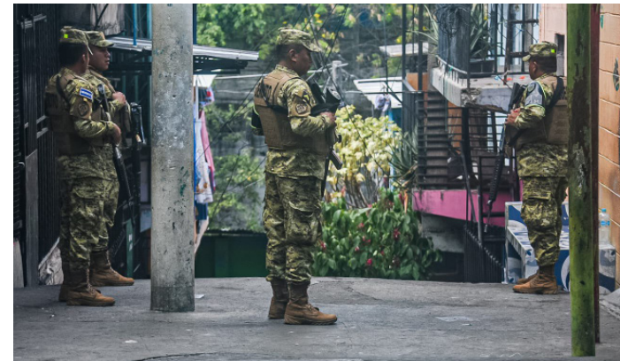
Un grupo de militares custodian la Comunidad La Tutunichapa en San Salvador, la cual, se encuentra bajo cerco militar desde el 24 de diciembre de 2022.

En enero de este año, el país cerró con 20 días sin homicidios, mientras que en febrero el país cerró con 21 días sin registrar muertes violentas. El mes pasado, se lograron 22 días sin homicidios, con las cifras de abril, El Salvador lleva 77 días