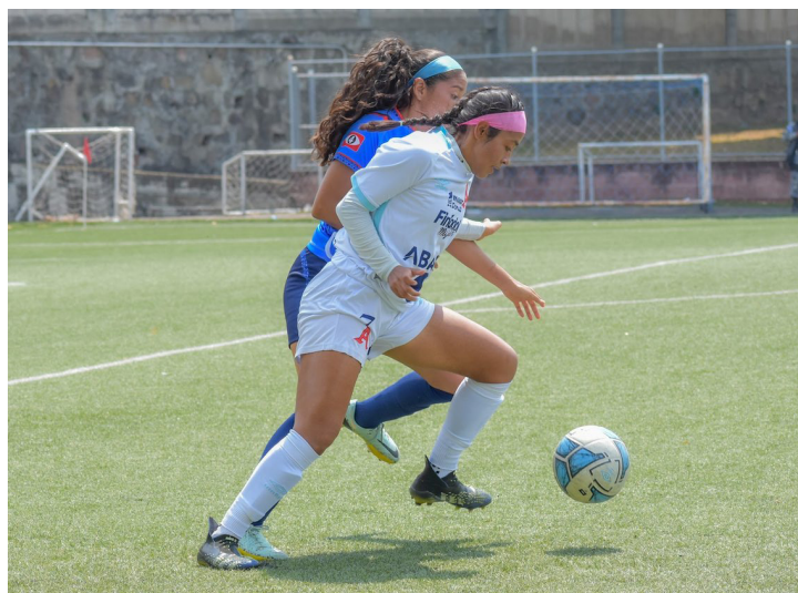
Los equipos de la Liga Femenina están a dos fechas para el inicio de los cuartos de final, en los que algunos clubes ya confirmaron su participación.

La jornada ocho del Clausura 2023 inició con la visita de Chalatenango a Once Deportivo, en la que el equi-