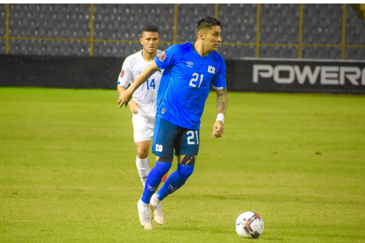
La Selecta se enfocará en llegar hasta las semifinales en la edición 2023 de la Copa Oro, para ello afrontará dos micro ciclos más y una gira por Asia.

Además, agregó que el último microciclo será en la última semana de abril, porque en mayo se llevará a cabo el tramo final del Clausura 2023, con los cuartos de final. Posterior a la final, se reunirán el 7 de junio, para la gira por Asia, que aún no está confirmada, y luego directo a la Copa Oro.