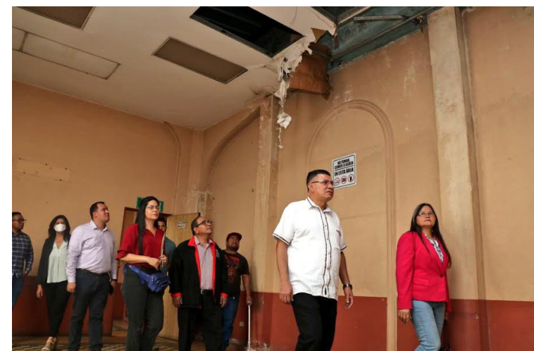
La UES inicia los trabajos de remozamiento y reparación del edificio donde fue fundada la Escuela de Medicina, conocido como “La Rotonda”, a fin de brindar mejores condiciones en la formación de profesionales.

Las autoridades pidieron a la población que ante cualquier emergencia suscitada por lluvias, llame al 2281-0888 o al 7070-3307 del Centro de Operaciones de Emergencias (COE) de Protección Civil.