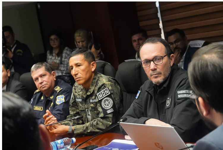
Gabinete de seguridad brinda un informe a la Asamblea Legislativa sobre el año de régimen de excepción.

Las autoridades brindaron detalles generales sobre la seguridad en el país en todo el año 2022, por ejemplo, los 20 delitos que tuvieron mayores incidencias fueron: Amenazas (9,038). Lesiones Culposas (7,798). Hurto (5,877). Lesiones (5,757). Estafa (5,631). Agrupaciones Ilícitas (4,860).