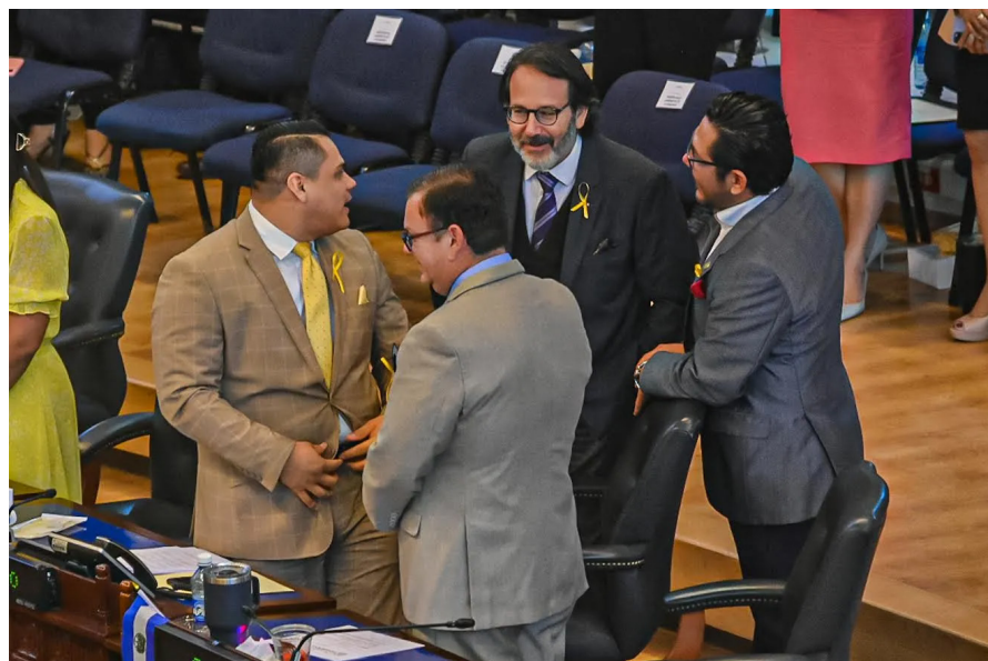
Diputados de Nuevas Ideas apoyan que youtubers y generadores de contenido asistan a la Asamblea Legislativa para que “informen” sobre el quehacer legislativo.

Los diputados del oficialismo han apoyado la medida ya que, según ellos, “se demuestra la libertad de prensa” y “el derecho a informar”.