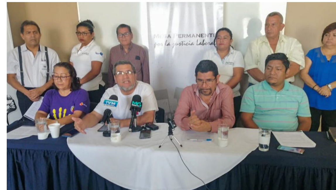
Integrantes de la Mesa Permanente por la Justicia Laboral (MPJL), anuncian la presentación de una demanda contra el Estado de El Salvador, ante la Comisión Interamericana de Derechos Humanos (CIDH) ante la reiterada violación de derechos laborales de la clase trabajadora.

“Haciendo una reseña breve la Sala de lo Constitucional, que recibió anteriormente un aproximado de 200 demandas de amparo de trabajadores y trabajadoras despedidas arbitrariamente, resolvió a través de medidas cautelares un estimado de 50 o 60 amparos y hubo reinstalados pro-