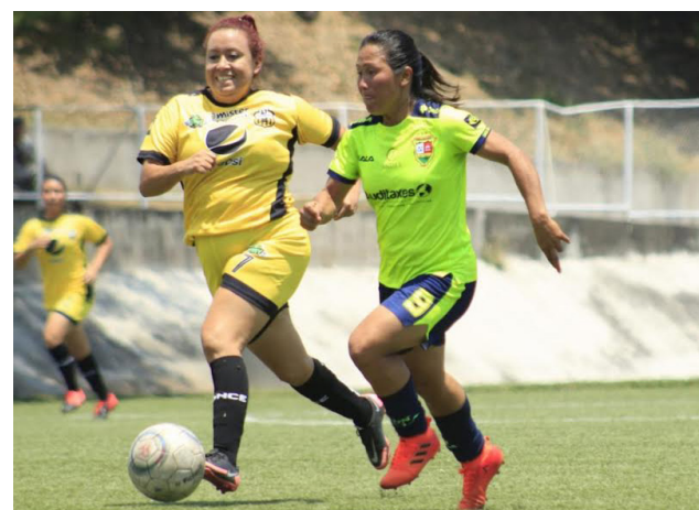
Santa Tecla castiga 15-1 a Once Deportivo en la jornada 7 del torneo Clausura 2023.