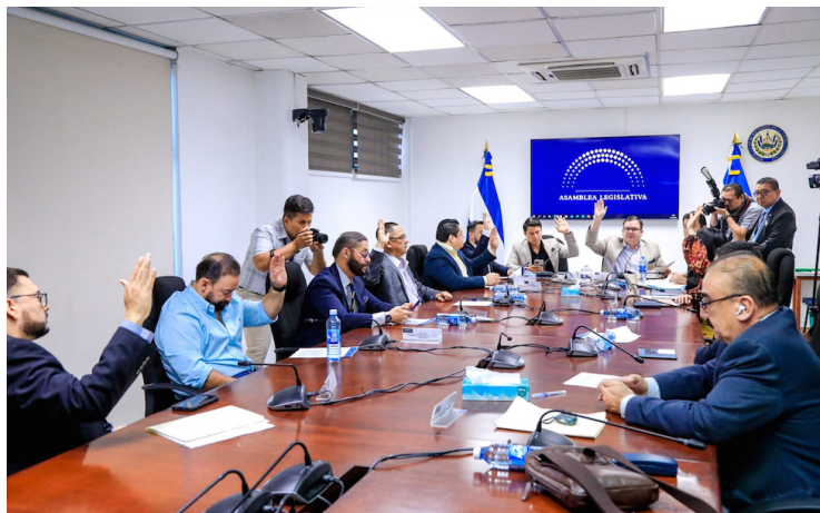
La Comisión de Hacienda y Especial del Presupuesto aprobó varias reformas a la Ley de Presupuesto 2023 para respaldar diferentes proyectos del ramo de obras públicas y de transporte.

La Comisión de Hacienda y Especial del Presupuesto de la Asamblea Legislativa emitió varios dictámenes este martes que contienen reformas a la Ley de Presupuesto 2023 para respaldar diferentes proyectos del ramo de obras públicas y de transporte, así como de la Presidencia.