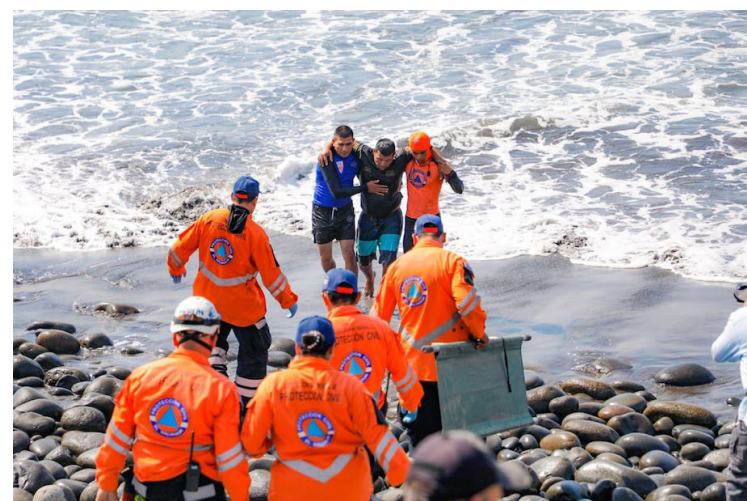
Durante el Plan Verano 2023 implementado durante las vacaciones de Semana Santa, se reportaron 219 rescates, de los cuales 93 fueron simples y 126 profundos.

Mientras tanto, la presidenta del Instituto Salvadoreño de Turismo (ISTU), Eny Aguiñada, señaló que en las vacaciones se contabilizaron 102,000 visitantes internacionales, más del 50% con respecto a 2022 y un 34% más que en 2019; la llegada de estos turistas extranjeros permitió que el país recibiera 95 millones de divisas. En cuanto al turismo interno, se recibieron 3.9 millones de visitantes, un 77% más de crecimiento con respecto a 2022,