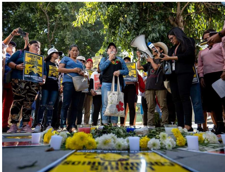
Población de la comunidad Santa Marta -ADES, exigen al gobierno y al sistema de justicia la liberación de sus líderes comunitarios y ambientalistas y cesar con el sistemático proceso de capturas arbitrarias en el país.

En cuanto al papel de la Fiscalía General de la República, el comunicado reitera que estos cinco líderes comunitarios han sido acusados “sin pruebas”, y por un supuesto crimen durante la guerra civil, sin cumplir ningún elemento del marco jurídico como la presunción de inocencia y una investigación exhaustiva sobre las supuestas responsabilidades.