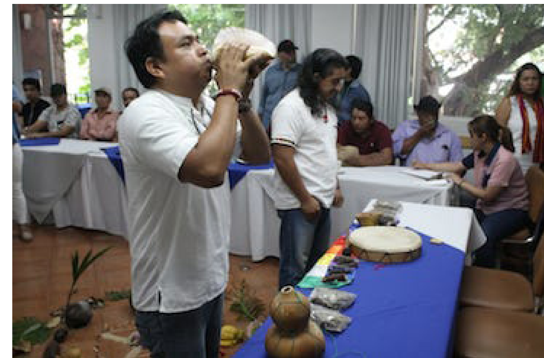
Ceremonia de agradecimiento al corazón del cielo, del agua, de la tierra y el aire por parte de los Pueblos Indígenas, que se presentan en defensa del territorio y en especial el agua que es sagrada.

“Esos permisos -que entregaron- no les daban a las empresas el derecho a destruir y afectar al río Senunapan. Esto no lo pueden negar porque somos testigos de sus declaraciones en esas visitas. Y solo nos han traído