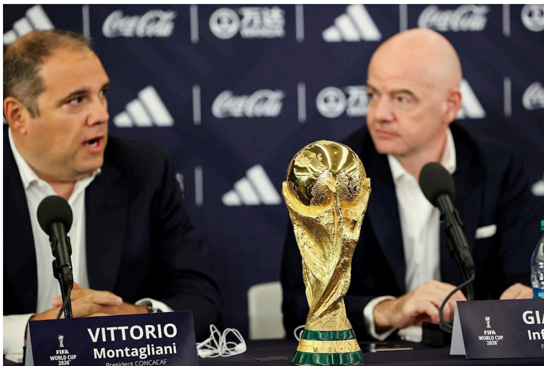
El Consejo de la FIFA, en sesión en Kigali (Ruanda) aprueba el nuevo formato de juego para el Mundial 2026.