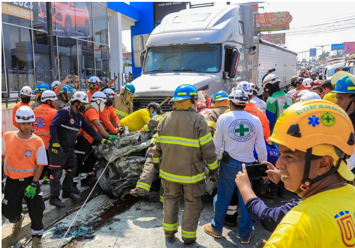
Cerca de 10 lesionados y un fallecido fue el resultado de un accidente de tránsito en la salida del bulevar Monseñor Romero y la incorporación al bulevar Los Próceres, donde una rastra sin frenos impactó con varios automóviles.

En un video captado por las cámaras de vigilancia de Antiguo Cuscatlán se puede observar como en medio del tráfico, la rastra comienza a fallar y empujar a los vehículos que estaban adelante, dos microbuses logaron