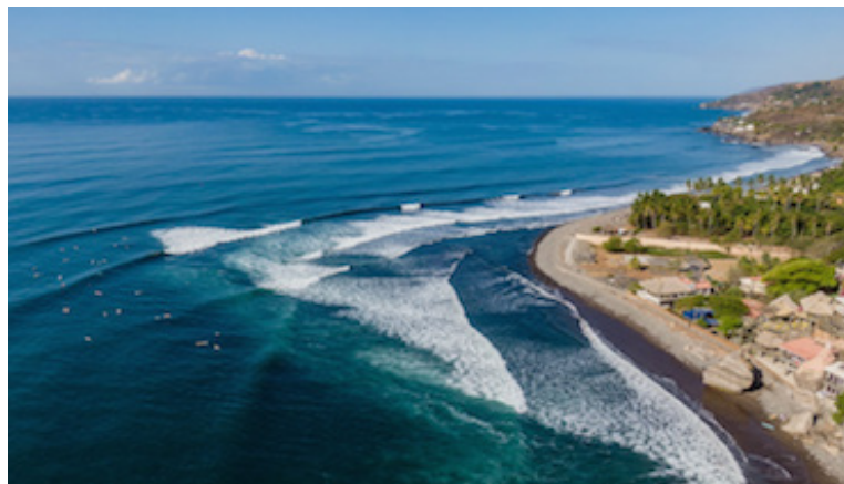
Algunos de los beneficios que se tendrán con la nueva normativa será la seguridad marítima, un registro y control eficiente de las embarcaciones y el mejoramiento del comercio.

También, toda nave que quiera circular por el mar territorial deberá estar regulada bajo el Registro de Naves (RENAV) que tendrá a su cargo los procedimientos de registros de documentos de inscripción, requisitos a los que deberán estar sujetas las inscripciones, las cancelaciones y certificaciones que deban emitirse. El dictamen será presentado este miércoles ante el Pleno Legislativo para que sea conocido y sometido a votación.