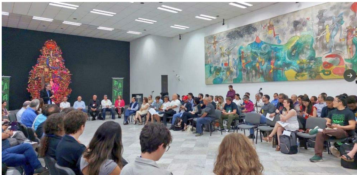
La Habana