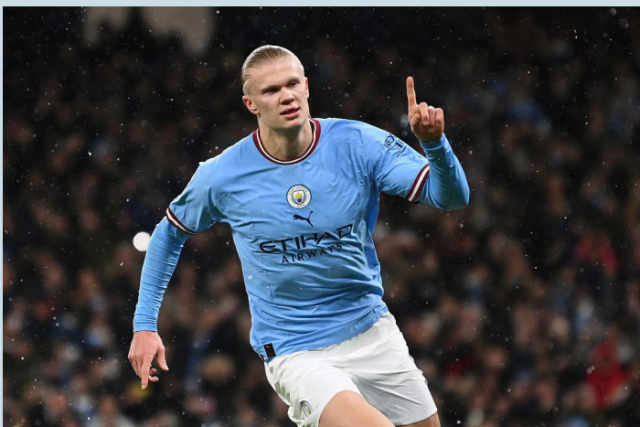
Erling Haaland marca cinco tantos para el Manchester City ante el RB Leipzig en el partido de vuelta de la Champions League.

En una de las mejores noches del jugador de la Premier League, Haaland se convirtió en el máximo goleador del actual edición de la Liga de Campeones, con 10 tantos en total, al superar por dos más a Mohamed Salah de los 'reds', Kylian Mbappé del PSG, a Gocalo Ramos del Benfica, Joao Mario, Rafa y Vinicius Jr. del Real Madrid.