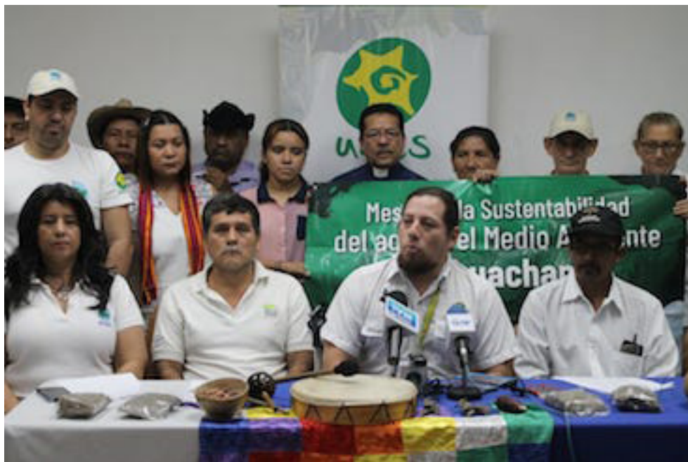
En el Día Internacional de Acción por los Ríos, representantes de la MESAMA, MESUTSO, el Comité Indígena para la Defensa de Los Bienes UNES, demandan mayor control y resguardo de la red hidrográfica del país.

Con respecto al Valle Jiboa, Recinos explicó que el río y su cuenca misma está en permanente crisis hídrica debido a la expansión del monocultivo de la caña de azúcar que roza el 90% del