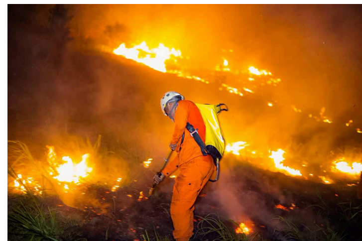
Bomberos denuncia que pese a la campaña gubernamental, no cuentan con el equipo necesario para atender las emergencias.

Sin embargo, el director del Cuerpo de Bomberos, Baltazar Solano, indicó que cuando el presidente de la República, Nayib Bukele inició su gestión, la institución contaba con un promedio de 300 bomberos operativos, ahora están rondando los 1,000. Según Solano, el equipo completo individual para que cada bombero pueda enfrentar un incendio tiene un valor de $16,000, y actualmente, el personal sí cuenta con la indumentaria y herramientas profesionales requeridas para su trabajo, el cual cumple los estándares internacionales, es resistente al fuego y protege las vías respiratorias del bombero.