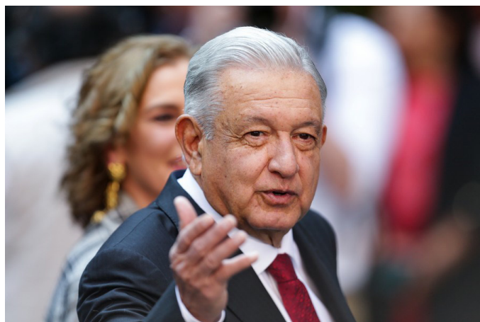
Ciudad de México/Sputnik

El presidente de México, Andrés Manuel López Obrador, se reunió este lunes con legisladores de EEUU para analizar el combate al tráfico ilegal del potente opiáceo sintético fentanilo y las controversias en el marco del tratado de libre comercio de América del Norte (T-MEC), en particular sobre maíz transgénico.