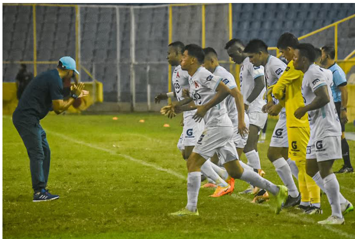
Alianza se prepara para afrontar el encuentro ante Philadelphia Union por los octavos de final de la Liga de Campeones.

“La presión de los hinchas que acompaña a Philadelphia será importante, pero también tendremos aficionados apoyándonos. La serie está abierta para cualquiera de los dos (...). Hemos venido a buscar pasar a la siguiente etapa, que se pueda hacer un lindo partido y clasificar nosotros. Es lo que busca cualquier equipo de las ligas centroamericanas”, dijo el téc-