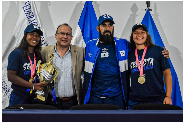
La selección nacional sub-19 es recibida por la Federación Salvadoreña de Fútbol (FESFUT) luego del histórico título del Torneo Femenino UNCAF FIFA Forward Honduras 2023.

“Tenemos que irnos acostumbrando porque estamos trabajando y luchando para acostumbrarnos a triunfos como estos. Creo que el peor error que podríamos cometer es alimentarnos de ego después de esto y pensar que ya por esto los demás torneos que se vienen van a ser sencillos. Estoy muy contento con el resultado, pero se está luchando, como todo