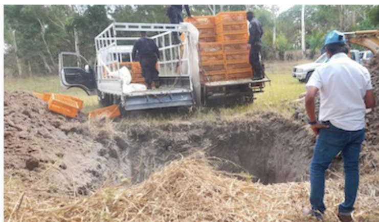
Cerca de 1,500 gallinas ponedoras de huevos provenientes de Guatemala a través de un punto ciego, fueron sacrificadas ante la posibilidad que sean portadoras de la influenza.

La alerta fue impuesta luego que Guatemala y Honduras detectaran contagios en pelicanos y que Costa Rica reportara tres casos en aves silvestres y uno en domésticas; además, Panamá sacrificó más de 2,500 gallinas con el virus.