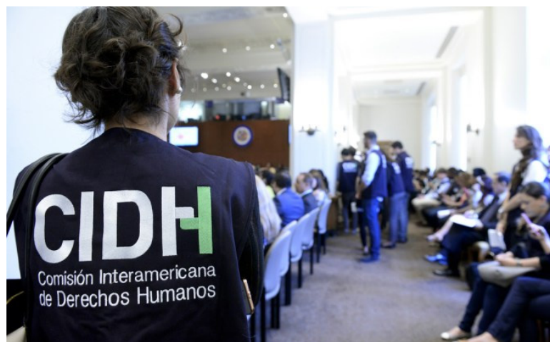
El período de reuniones de la CIDH se realiza entre el 6 al 10 de marzo del presente año, sumando 18 audiencias públicas en la que abordó diversos temas de derechos humanos con una perspectiva regional y específica para cada país miembro de la OEA.

Las audiencias públicas trataron las temáticas de: Mujeres y Niñas y Derechos Sexuales y Reproductivos de Brasil y Haití; Pueblos Indígenas en Brasil, Jamaica y Honduras; Búsqueda Forense en México; Libre Circulación en Cuba; Mo-