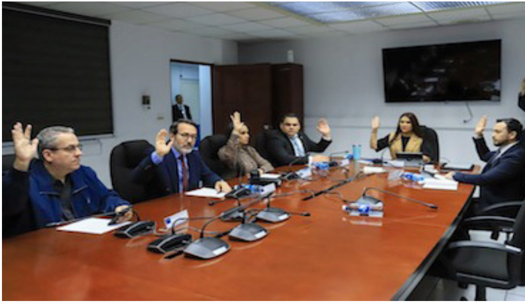
La Comisión Especial para investigar los fondos otorgados a ONG presenta el informe final sobre el trabajo realizado desde su conformación (en 2021), el cual será llevado ante el pleno legislativo para su aprobación.