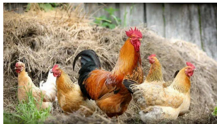
El Ministerio de Agricultura y Ganadería declara durante seis meses Estado de Alerta Zoonosanitaria por Influenza Aviar a nivel nacional, con el fin de reforzar las medidas preventivas.

Los síntomas de la gripe aviar incluyen fiebre alta, tos, dolor de garganta, dificultad para respirar, dolores muscula-