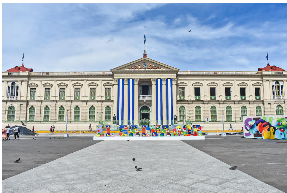
El Palacio Nacional se encuentra frente a la Plaza Cívica y en su momento tuvo participación política ya que en ese lugar se reunían funcionarios de alto rango de El Salvador.

Se creará la “Autoridad de Planificación del Centro Histórico de San Salvador”, como una entidad de derecho público