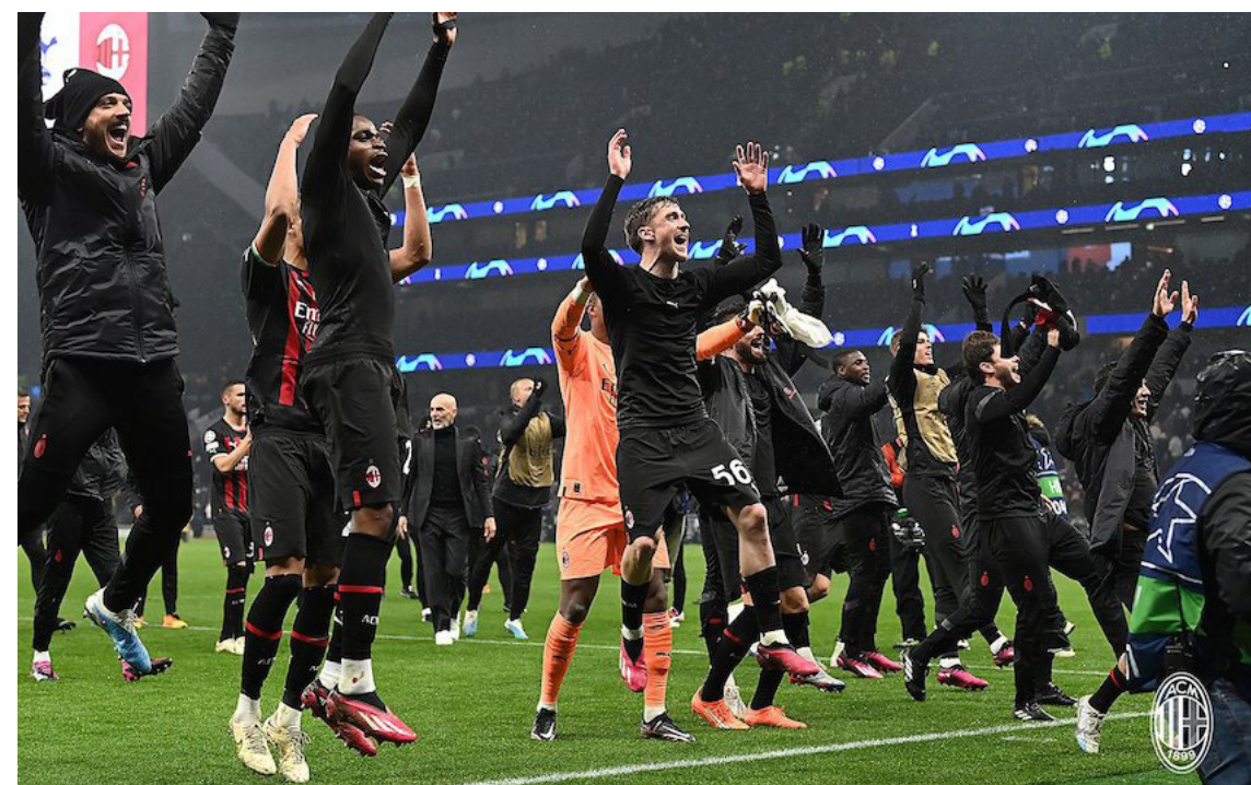
El AC Milán consigue el boleto a los cuartos de final de la Champions League diez años después de su última participación.