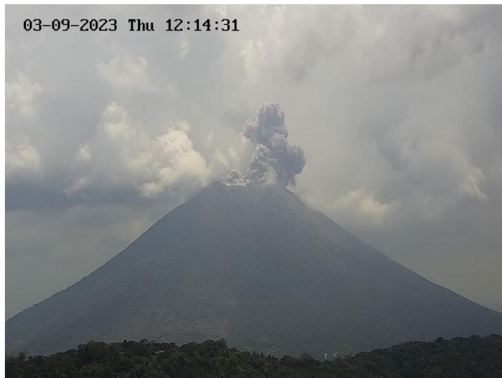
El MARN indica que continúan las emanaciones y explosiones a través del cráter central del volcán Chaparrastique, en el municipio de El Tránsito y cantón Las Moritas, departamento de San Miguel, se reporta caída de cenizas.