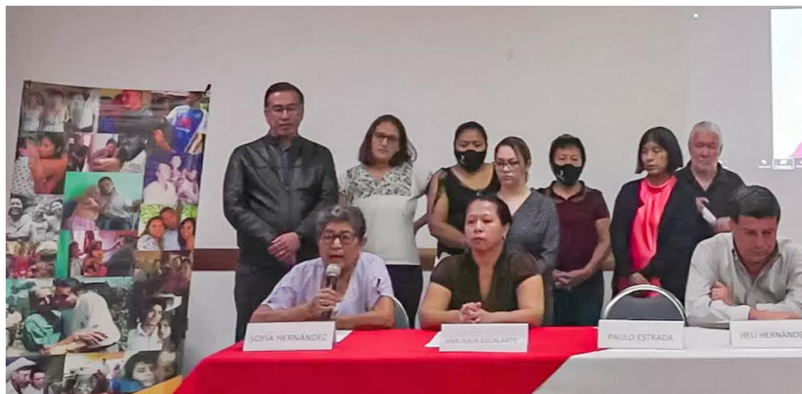
Diversos colectivos de Derechos Humanos, informaron de su participación en el período 186 de sesiones de la Comisión Interamericana de Derechos Humanos (CIDH) en la Audiencia Temática sobre los obstáculos a la Información de Familiares de Víctimas de Desaparición Forzada.