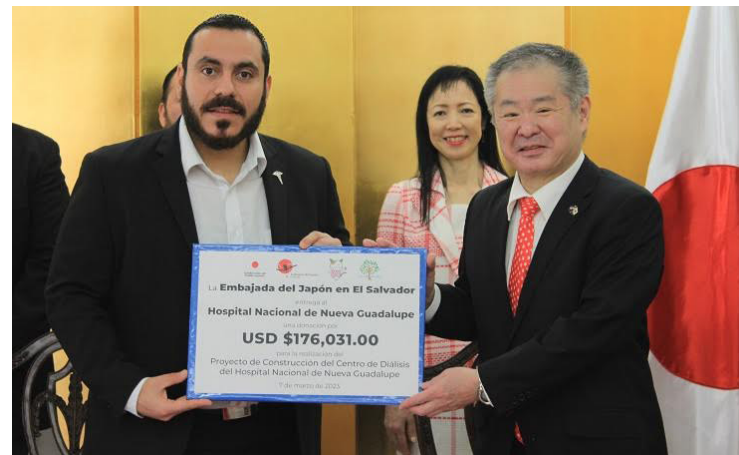
La Embajada de Japón en El Salvador entrega un donativo de $176,031.00, para la construcción del Centro de Diálisis del Hospital Nacional de Nueva Guadalupe.