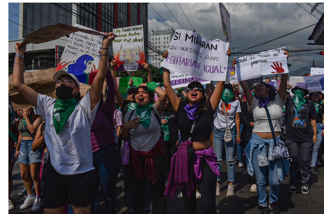
Cientos de mujeres marchan desde la Plaza Divino Salvador del Mundo hasta el Parque Cuscatlán como parte de la conmemoración de Día Internacional de la Mujer.

¡ Justicia para Beatriz!, fue la consigna de las organizaciones feministas como la Colectiva Feminista y la Agrupación Ciudadana por