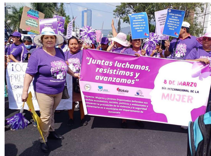
La Asociación Movimiento Salvadoreño de Mujeres (MSM) afirmó este 8 de marzo que las mujeres deben exigir el derecho a vivir libre de toda forma de discriminación y violencia.

Entre las denuncias también señalan el hecho de que las madres jóvenes junto a sus hijos e hijas emprendan la dura travesía hacia el norte, en busca de mejores condiciones de vida, ya que tienen que sacar adelante a sus familias, con una canasta básica ampliada que está por las nubes y el dinero no alcanza para cubrir una dieta alimenticia balanceada.