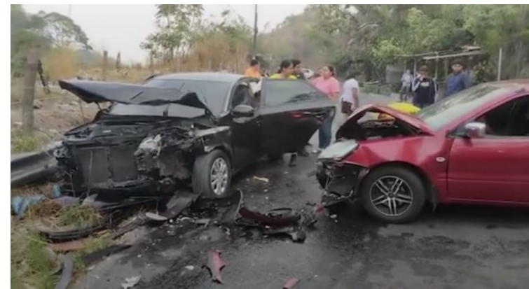
Estadísticas del Observatorio de Seguridad Vial contabilizan 3,241 accidentes de tránsito, los cuales han dejado 1,880 lesionados y 234 fallecidos.

Actualmente, son alrededor de 70 procesos sancionatorios hacia rutas del transporte colectivo o de carga, los inspectores verifican que las unidades cumplen con los requisitos para la circulación, como son la ruta, estado mecánico y tarifa. El VMT anunció que aumentarán los controles vehiculares en los principales accesos a playas, lagos y