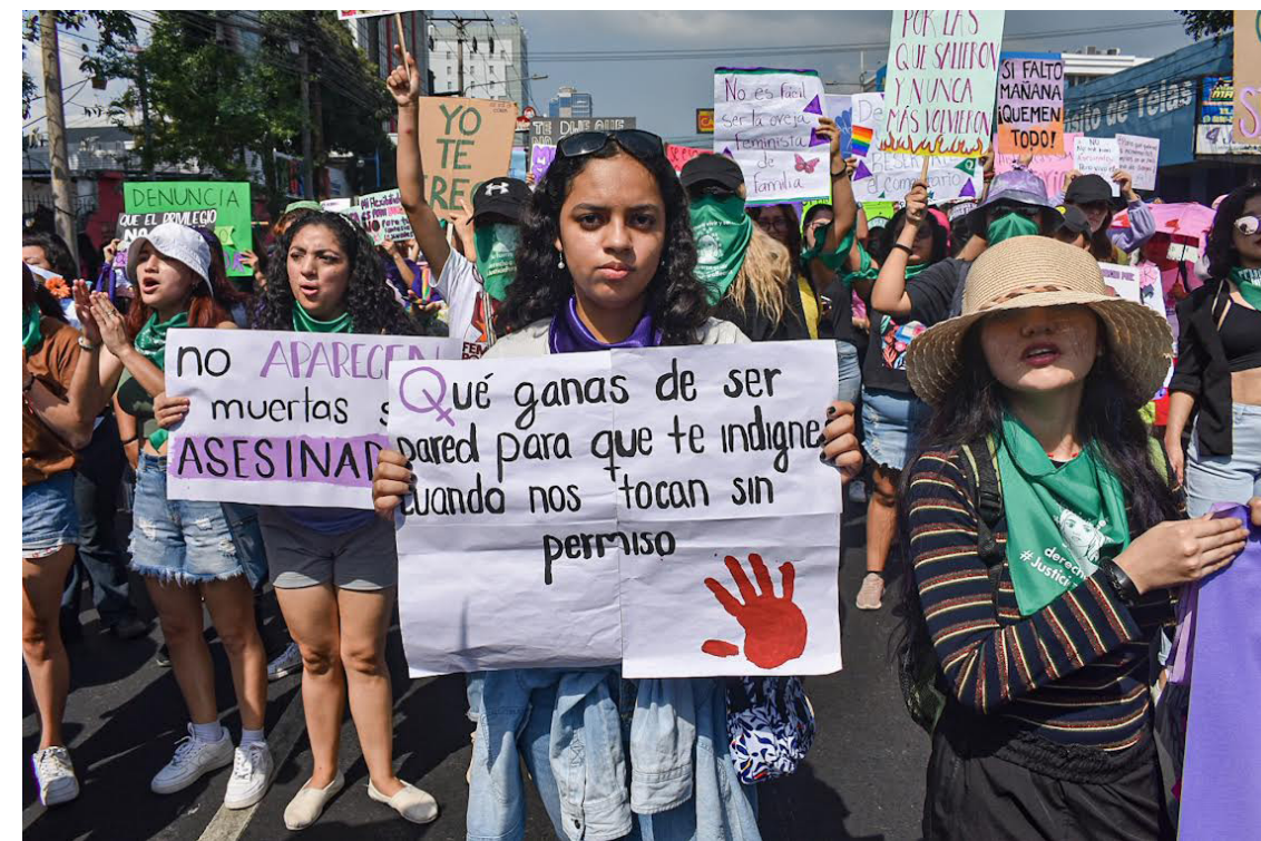
Las mujeres exigen el cese del acoso callejero, una práctica que se ha normalizado por los hombres, pero afecta a la víctima.