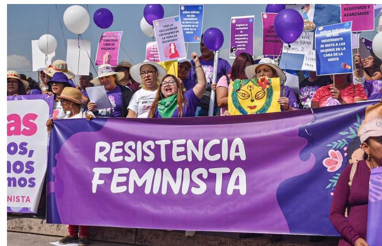
El movimiento reafirma que la violencia contra las mujeres no solo se combate con militares en las calles, sino que exigen presupuestos etiquetados para las políticas públicas para la prevención de la violencia.

Y con el costo de la vida la denuncia es que este que golpea a