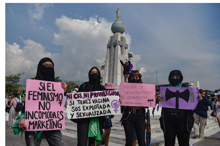
Miembros de la comunidad LGBTIQ también participan en la marcha del 8M para demostrar que otras mujeres no están solas.