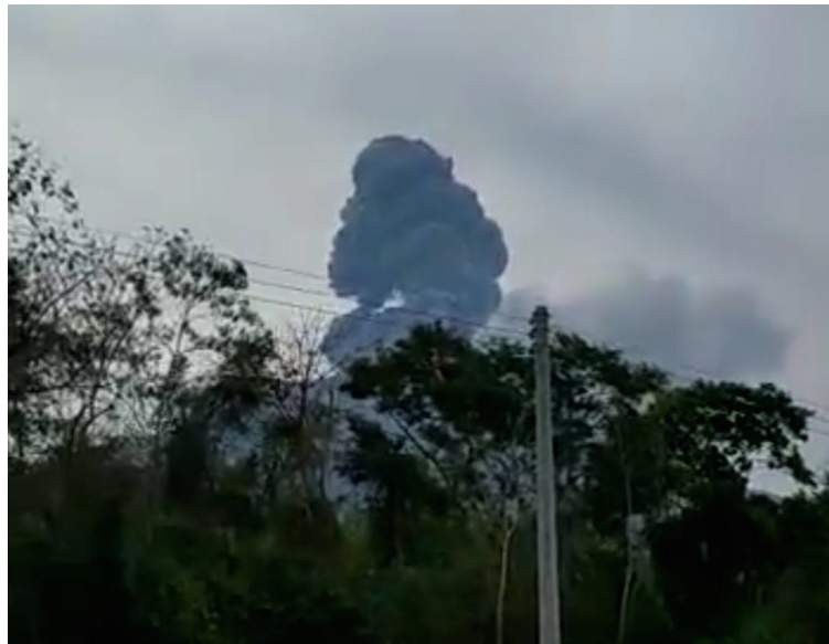
El MARN reporta incremento en la desgasificación desde el cráter central del volcán Chaparrastique, por lo cual Protección Civil emitió un aviso.

Debido al incremento en la actividad del volcán Chaparrastique, de San Miguel, la Dirección General de Protección Civil emitió un aviso, ya que a partir de las 10:52 p.m. del 7 de marzo, se observa un aumento en la desgasificación desde su cráter central, siendo constante, durante la madrugada y tempranas horas de la mañana del 8 de marzo.