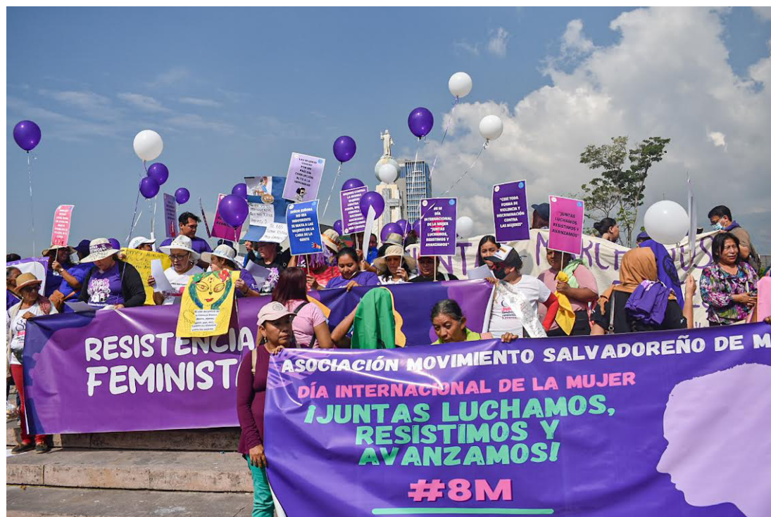
Cientos de mujeres se concentran en San Salvador para emprender una marcha para exigir al Estado la reivindicación y protección de sus derechos.