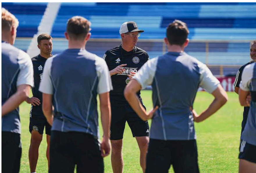
El equipo estadounidense hace el reconocimiento del campo cuscatleco previo al encuentro contra Alianza.

El entrenador del equipo estadounidense, Jim Curtin, habló sobre el combinado salvadoreño, lo que implica asumir el encuentro en el estado en el que se encuentra el Cuscatlán, y el respeto que tienen por el equipo capitalino.