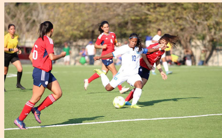
El Salvador gana ante Costa Rica en el debut del Torneo Sub-19 Femenino UNCAF.

En los primeros encuentros de la jornada Honduras venció