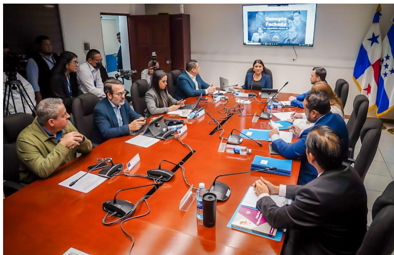
Comisión vuelve a sesionar luego de meses sin hacerlo, en esta jornada se lee un informe sobre las oenegés.

La Asociación Movimiento de Mujeres Mélida Anaya Montes (Las Mélidas), con vinculación con la exdiputada Lorena Peña, recibió $518,890, dijo la diputada oficialista. También mencionó a La Fundación Salvadoreña para la Democracia y el Desarrollo Social, creada por supuestamente militantes del FMLN, entre ellos el exdiputado Eugenio Chicas. Dicha fundación habría recibido $639,000. La Fundación Nacional de Arqueolo-