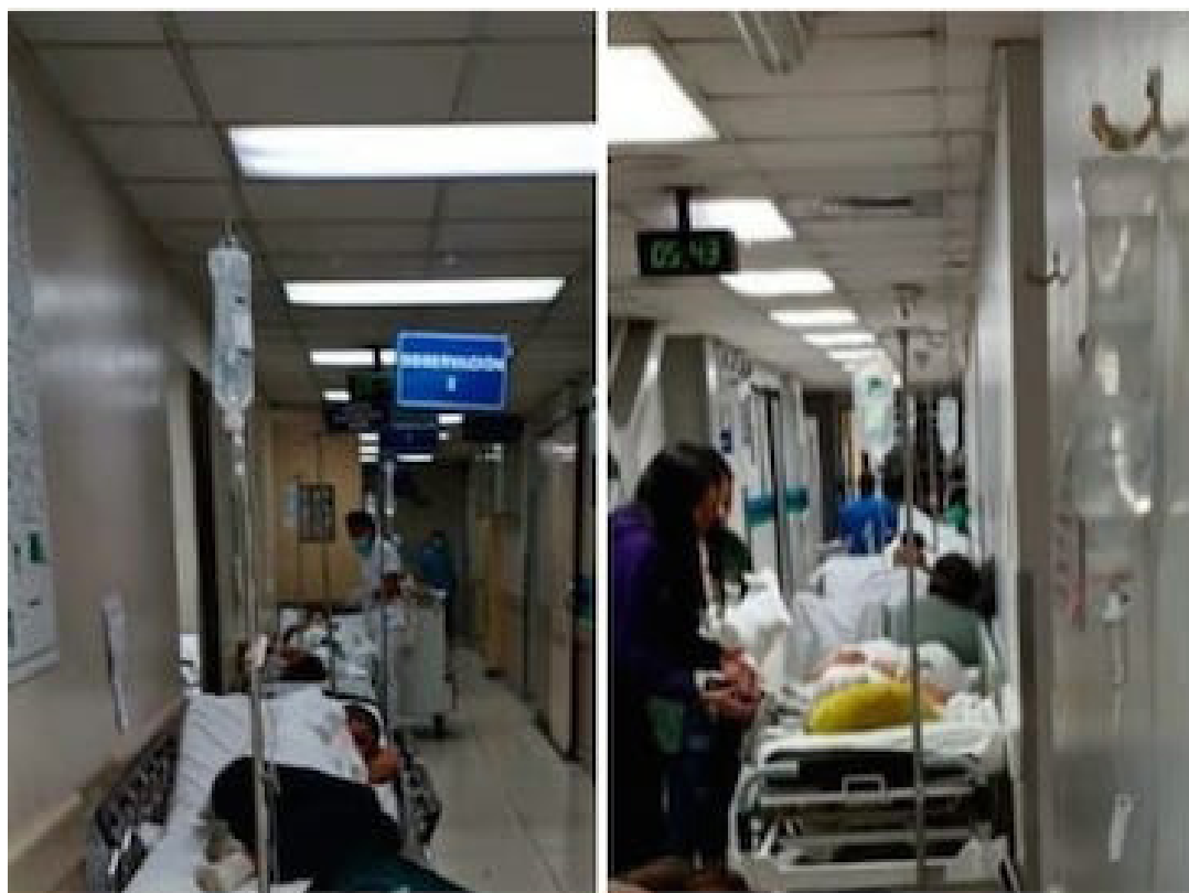
Del 15 al 20 de febrero de 2023 en el Hospital General del Seguro Social se atendieron a 12 pacientes en el área de observación en un espacio que tiene capacidad para 8 personas y 86 pacientes ingresados en pasillos.

El Sindicato de Médicos Trabajadores del Instituto Salvadoreño del Seguro Social (SIMETRISSS) manifestó que el déficit de médicos es un problema crítico, el cual repercute en la atención a los derechohabientes, especialmente en el retraso de las citas.