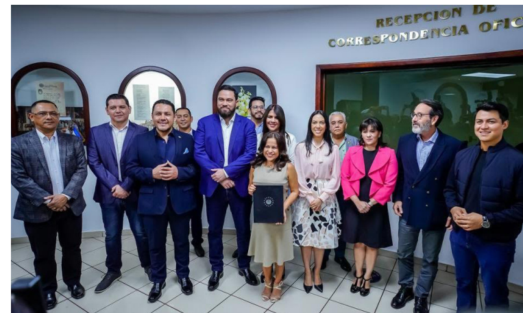
GOES busca crear una entidad que regule los permisos y resguarde el patrimonio cultural del Centro Histórico de San Salvador.

plenaria ordinaria, donde se prevé que se estudie en la respectiva comisión.