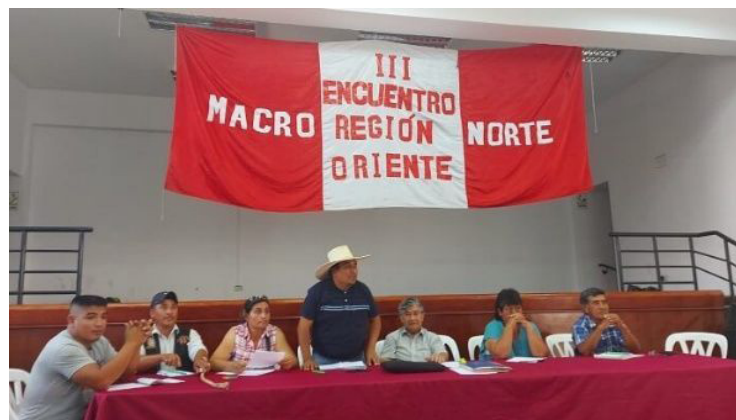
Esta huelga será encabezada por los Frentes de Defensa de las distintas jurisdicciones de las regiones.

"Condenamos el silencio de las autoridades como gobernadores regionales o alcaldes provinciales y distritales cómplices de este gobierno, quienes incluso se están irrogando la represen-