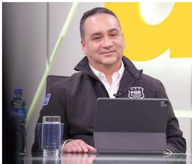
Según las declaraciones del fiscal general de la República, Rodolfo Delgado, la FGR parece estar bajo lineamientos del Ejecutivo.

“La decisión de la Corte IDH la esperamos tener a finales de este año (2023), si bien la audiencia es fundamental en todo este proceso que ha durado todos estos años, la sentencia esperamos que sea estándar para que los Estados de la región en América Latina, retomen en materia de prestación de servicios de aborto para preservar la salud, la vida de las mujeres y personas gestantes embarazadas”, puntualizó de León.