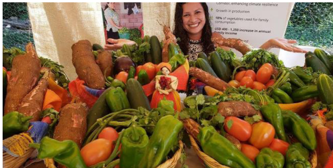
La ONEC confirmó solo en enero del presente año, El Salvador tuvo la Canasta Básica Alimentaria más cara de su historia alcanzando los 245.00 dólares para el área urbana y 185.30 en la zona rural.

“Y si vemos tendremos este año -una crisis por falta de