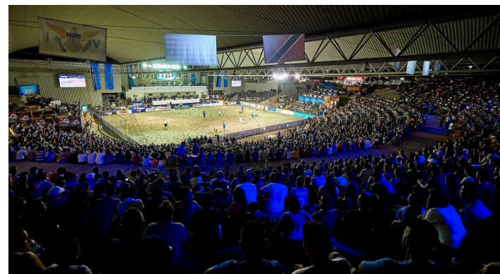
El estadio nacional Costa del Sol será sede para las eliminatorias de los Juegos Mundiales Bali 2023.

nal de fútbol playa. Además, dejamos en evidencia, una vez más, nuestro total respaldo para el deporte en general, y en específico para esta modalidad deportiva, tanto en nuestro país como en la región”, reafirmó el funcionario salvadoreño.