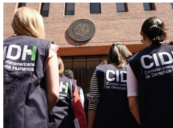
La CIDH tiene el mandato de promover la observancia y la defensa de los derechos humanos de la región, como órgano consultivo de la OEA en esta materia, por lo que dio a conocer su calendario de audiencias.

“La Comisión Interamericana de Derechos Humanos agradece a la Universidad de California (UCLA) por la invitación a sesionar en su campus. Los períodos de sesiones fuera de sede amplían la presencia pública de la CIDH y su capacidad para promocionar los derechos humanos de la región”, puntualizó.