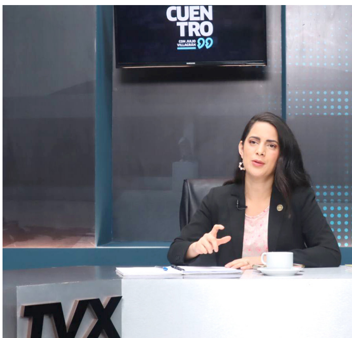
La diputada por VAMOS, Claudia Ortiz, considera que desde la Asamblea Legislativa se puede hacer grandes cambios si se tuviera una correlación diferente con diputados que usen su investidura para defender a la gente de los abusos.