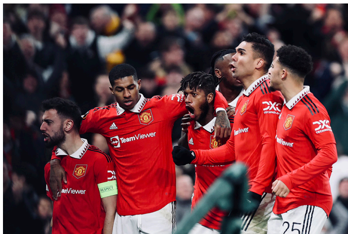
El Manchester United elimina al Barcelona de la Europa League con un 2-1 en el Old Trafford en los dieciseisavos de la competencia.

A un duelo decisivo llegó el Barcelona al Old Trafford, ante los diablos rojos tras el 2-2 en el Camp Nou con el que dejaron pendiente el duelo para determinar quién obtendría el boleto a la siguiente fase. En el primer tiempo, los españoles se pusieron a un paso de la vic-