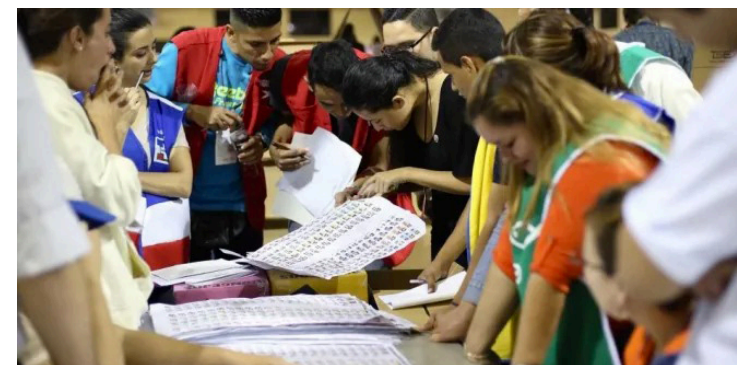
Nación Salvadoreña en el Exterior pide al TSE se les incluya en la vigilancia del voto desde el exterior, además, señala ausencia del padrón electoral, permitir para emitir el sufragio pasaportes vencidos y falta de transparencia.

A criterio de Nación Salvadoreña en el Exterior, no es aceptable que el TSE siendo la máxima autoridad en cuestiones electorales se preste a las manipulaciones del presidente de la República y obedecer a la Sala de lo Constitucional con la sentencia que avala reelección de Bukele, lo cual es ilegal.