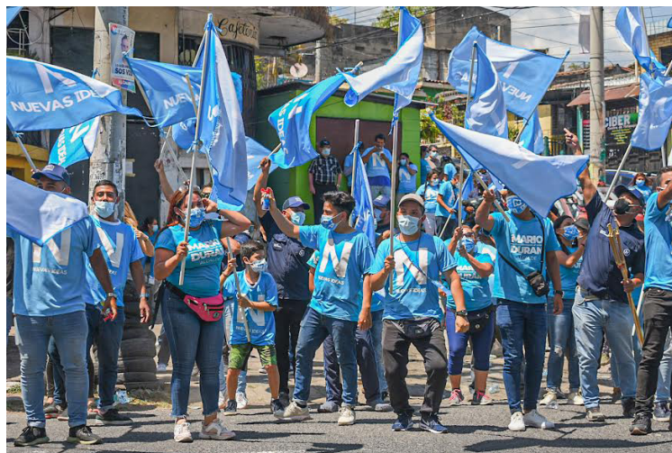
El TSE reitera a los partidos políticos o coaliciones, a todos los medios de comunicación, personas naturales o jurídicas, abstenerse de hacer propaganda electoral antes ni después de las votaciones.

los partidos políticos que deben cumplir con los plazos establecidos en el Calendario Electoral, para convocar y desarrollar elecciones internas, a fin de ele-