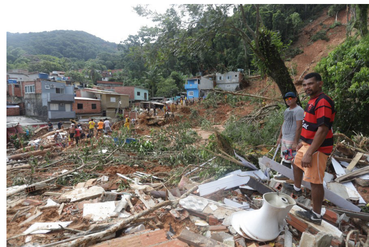
Residentes observan los escombros en una zona afectada por deslaves e inundaciones ocasionadas por las lluvias, en Barra do Sahy, en el municipio de Sao Sebastiao, en el estado de Sao Paulo, Brasil, el 21 de febrero de 2023.

El director del Cemaden, Osvaldo Moraes, incluso alertó con anticipación a lo ocurrido a través de medios sobre la