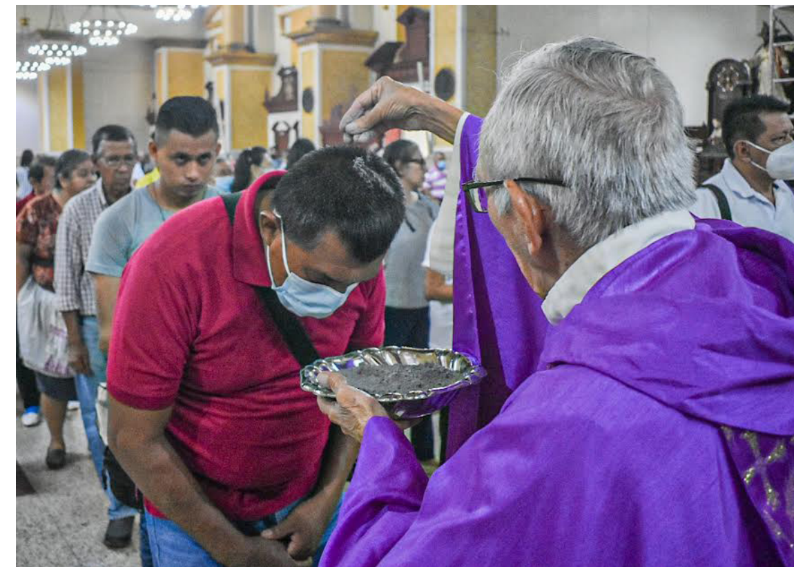
Feligresía católica participa del Miércoles de Ceniza, con lo cual inicia el tiempo litúrgico de la Cuaresma.

El prelado enfatizó que el color litúrgico de la Cuaresma es el morado, como un llamado desde la fragilidad e inconsistencias humanas a convertir el corazón en la voluntad de Dios; este tiempo inicia el Miércoles de Ceniza y finaliza la tarde del Jueves Santo, cuando se celebra la Cena del Señor y junto con ello, la conmemo-