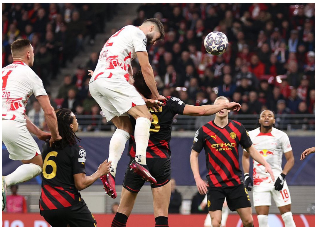
Josko Gvardiol marca el 1-1 ante para el RB Leipzig contra el Manchester City en el partido de ida de los octavos de final de la Champions.

La Liga de Campeones regresó el pasado 14 de febrero. Hasta la fecha, estos han sido los