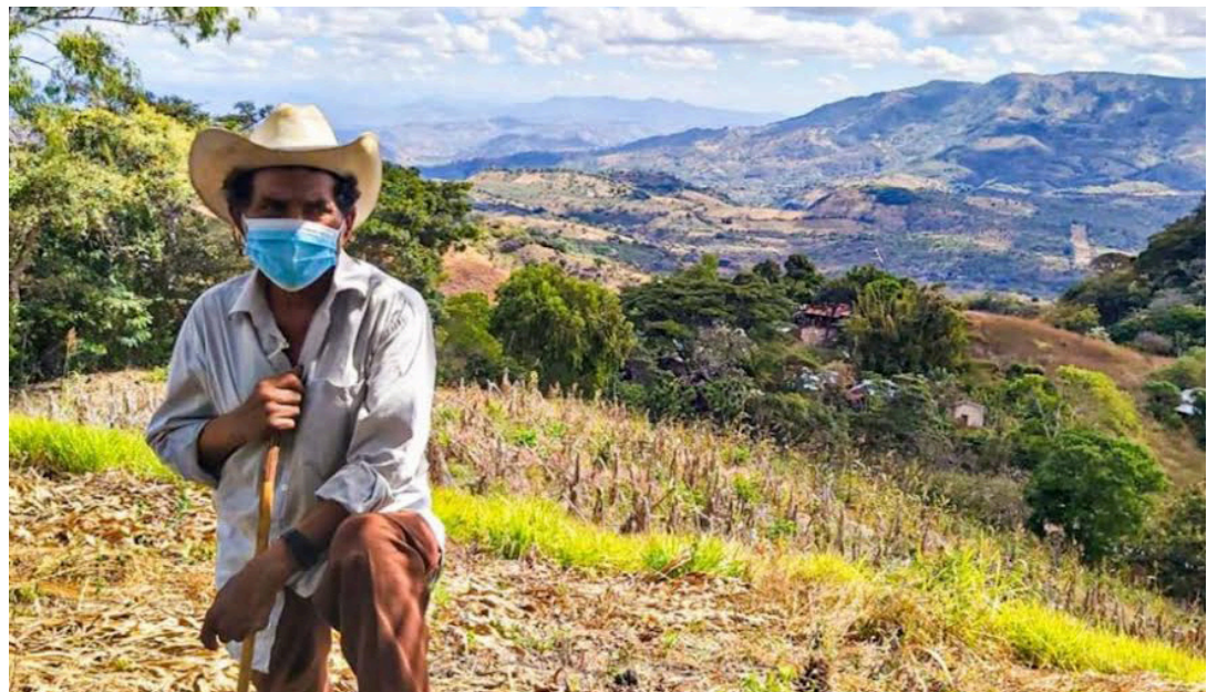
El proyecto “Escalando la acción anticipatoria para hacer frente a la amenaza de la sequía y la inseguridad alimentaria en Centroamérica”, beneficiará más de 9 mil personas de la región, de los cuales 1,721 pertenecen a los municipios de Chilanga y Guatajiagua, del departamento de Morazán.

mover la recopilación y el análisis de datos oportunos y más integrados, así como orientar la toma de decisiones en función de los riesgos, en apoyo de la acción anticipatoria y la respuesta en el sector de la seguridad alimentaria.