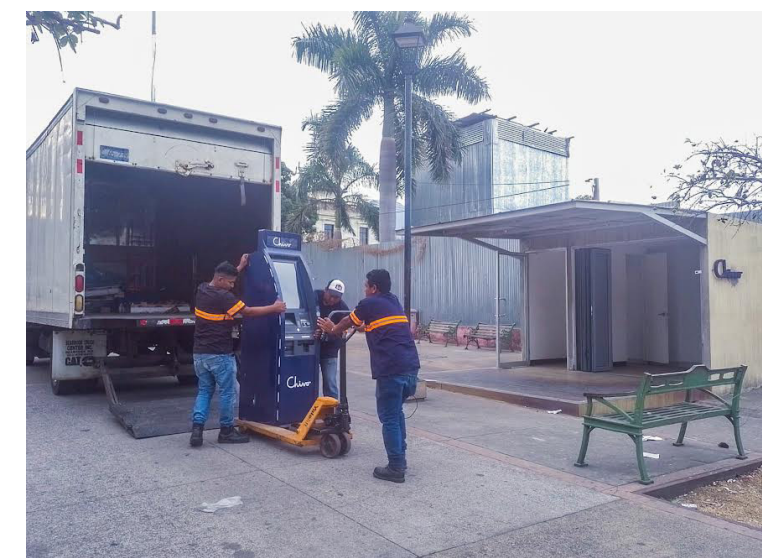
El cajero Chivo ubicado en la Plaza de la Salud es retirado la tarde del miércoles, junto a él la caseta donde funcionaba.