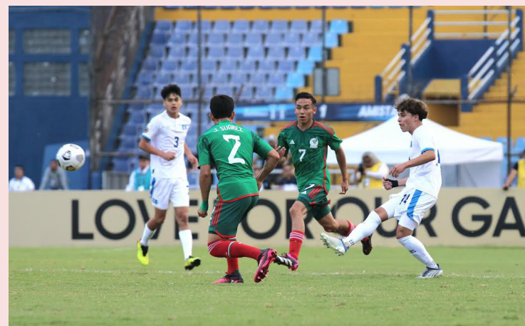
La selección nacional sub-17 se enfrenta a México en el estadio Doroteo Guamuch Flores en Guatemala, partido que los salvadoreños perdieron 3 a 0.

En las redes sociales, el presidente de la Comisión Reguladora de la Federación Salvadoreña de Fútbol (FESFUT) es-