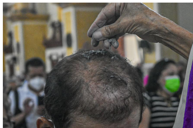
Desde tempranas horas, cientos de feligreses acuden a Catedral Metropolitana de San Salvador para que el padre coloque las cenizas en su cabeza.

La ceniza utilizada se obtiene al quemar las palmas del Domingo de Ramos del año anterior, luego son bendecidas y aromatizadas con incienso. La ceniza representa la destrucción de los errores del año anterior, al ser quemados.