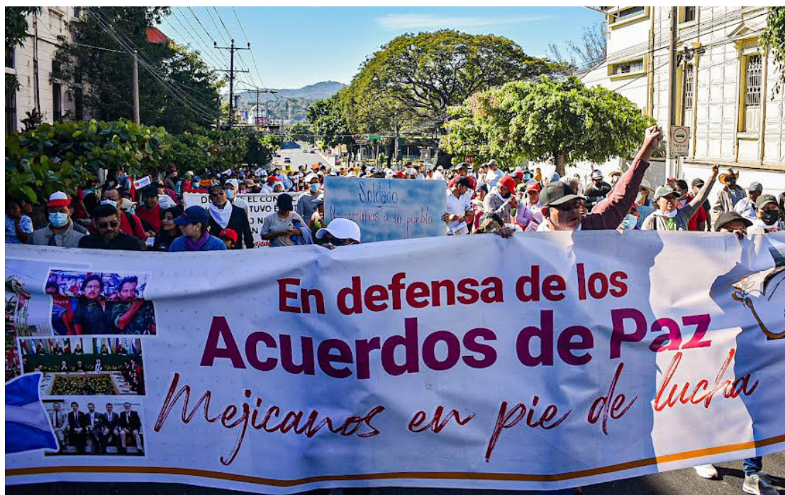
La Comisión Interamericana de Derechos Humanos (CIDH) presentó su informe balance sobre la violencia contra las personas defensoras de derechos humanos en las Américas en el año 2022. En la que advierte al Estado salvadoreño a dejar los “discursos estigmatizantes”, que desacreditan la labor de las personas defensoras.