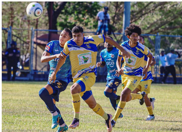
FAS cae ante Jocoro en el cierre de la jornada 5 del Clausura 2023, con un marcador de 2-1.

El cuadro tigrillo presionó sobre los primeros minutos. Por el sector izquierdo arrancó FAS, sobre los 10 minutos, y genera una de las más claras oportunidades de gol, con una jugada entre Portillo y Sa-