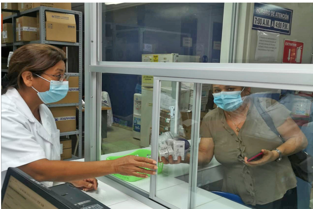
El SIMETRISSS indica que alrededor de 80 códigos de medicamentos se encuentran en escasez o no existen en las farmacias.