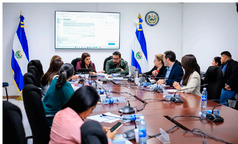
Comisión de la Mujer de la Asamblea Legislativa recibe aportes de la FGR sobre la reforma al Código Procesal Penal y LEIV para que el delito de feminicidio no prescriba.

La Comisión de la Mujer e Igualdad de Género de la Asamblea Legislativa inició el estudio de las reformas al Código Procesal Penal y la LEIV para que el delito de feminicidio no prescriba, es decir, que en cualquier momento la acción penal se pueda ejercer; para escuchar opiniones técnicas fueron invitados representantes de la FGR, quienes vieron a bien realizar tales reformas.