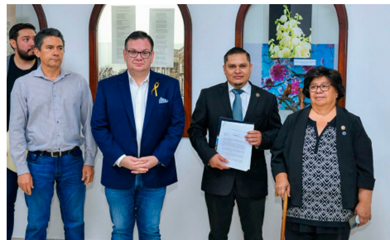
Diputados presentan la Ley Especial para la Reforestación, Forestación y Conservación de la Ruta Turística de Las Flores.

iniciativa se podrá complementar con el “Plan Esperanza”, que pronto impulsará para dar continuidad a la campaña de reforestación “Dejemos una Huella Verde” con una meta de medio millón de plantas a escala nacional. El jefe de fracción de Nuevas