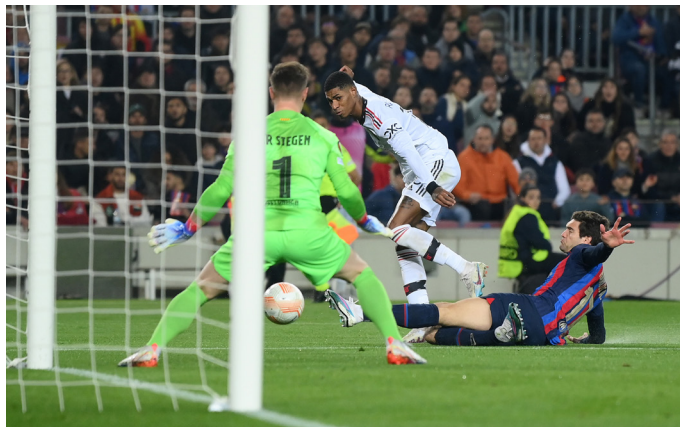
Marcus Rashford anota el 1-1 contra el Barcelona en el partido de ida de las eliminatorias de la Europa League.

En la contra, el Manchester buscó el desempate para llevar ventaja al partido de vuelta pero, sobre los 90+4', los equipos cerraron con un empate a dos goles.