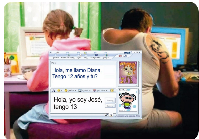
A través de redes sociales, un profesor mantenía conversaciones de tipo sexual con uno de sus ex alumnos.

Fue la madre del menor de edad que interpuso la denuncia en noviembre de 2019