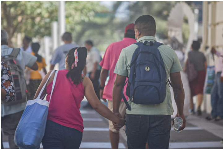
En los últimos días se han cometido al menos 3 feminicidios donde la pareja es el victimario y que posterior a su muerte, se han suicidado.