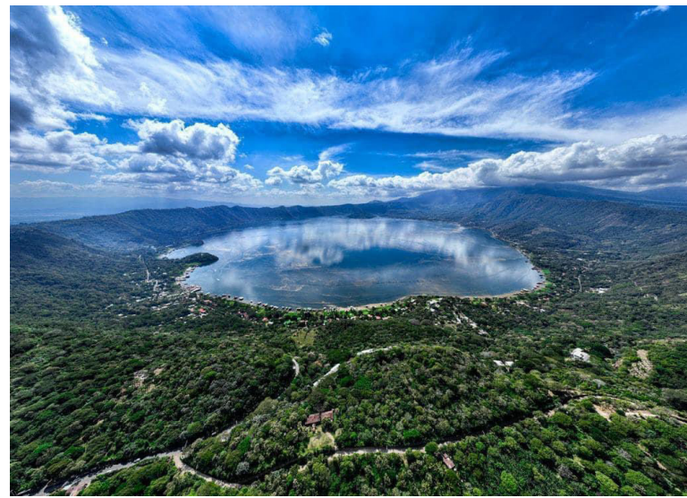
El Lago de Coatepeque es declarado como Área Natural Protegida. FOTO: DIARIO CO LATINO / CORTESÍA.

Mediante el Decreto Ejecutivo número 16, el Ministerio de Medio Ambiente será el responsable de garantizar la protección de los recursos naturales y los ecosistemas que habitan la zona. El Lago de Coatepeque, ubicado en Santa Ana, ahora forma parte del Sistema Nacional de Áreas Naturales Protegidas convirtiéndose en la número 194. La importancia de la declaratoria es que