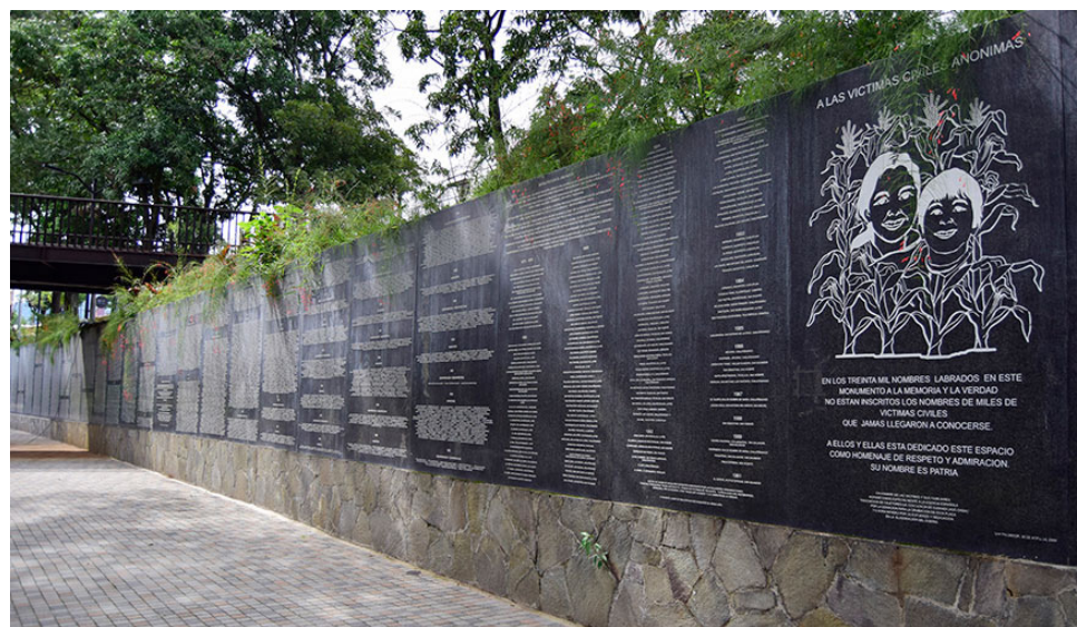
El Monumento a la Memoria y la Verdad está localizado en el Parque Cuscatlán, en la ciudad de San Salvador, El Salvador.

Conocer el paradero de los muertos o de los desaparecidos es una cuenta pendiente de las autoridades del país. Los dolientes están muriendo «sin esperanza de saber qué les pasó a sus hijos, a sus hermanos», es el clamor que se escucha con frecuencia.