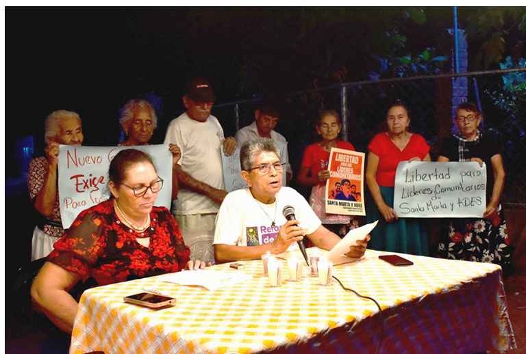
La comunidad ADES-Santa Marta pide a las autoridades que cese la represión y persecución de los líderes defensores de derechos humanos y que respeten su integridad física y emocional.

La comunidad los recuerda cada día y piden una pronta liberación, ya que aseguran que los detenidos no tienen vinculación sobre ese supuesto homicidio. “Desde hace un mes no están con nosotros, no tenemos su presencia, sus palabras, su empeño decidido, su trabajo incansable. Son nuestros líderes comunitarios y defensores ambientales de Santa Mar-