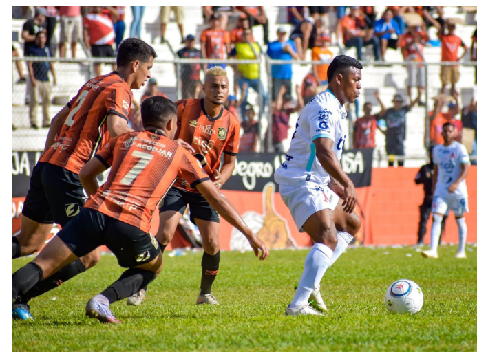
Águila y Alianza se enfrentan en la fecha 4 del Clausura para sellar un empate sin goles, y siguen líderes del torneo.

Por su parte, Firpo y Once Deportivo concretaron un empate sin sabor en la "caldera del diablo", lugar donde, sobre los 90', ambos repartieron puntos y se ubicaron en la cuarta y quinta posición, respectivamente. El tanque frontirizo venía de una victoria ante los jaguares y el cuadro pampero de un empate ante el Jocoro.