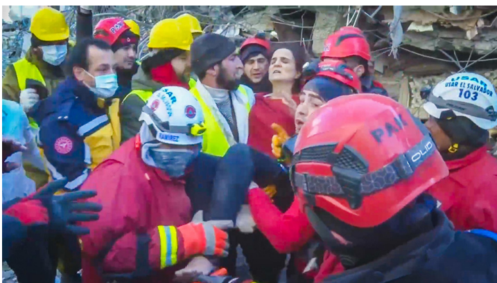
Este es el momento en que trasladan a una sobreviviente rescatada de los terremotos de Turquía.