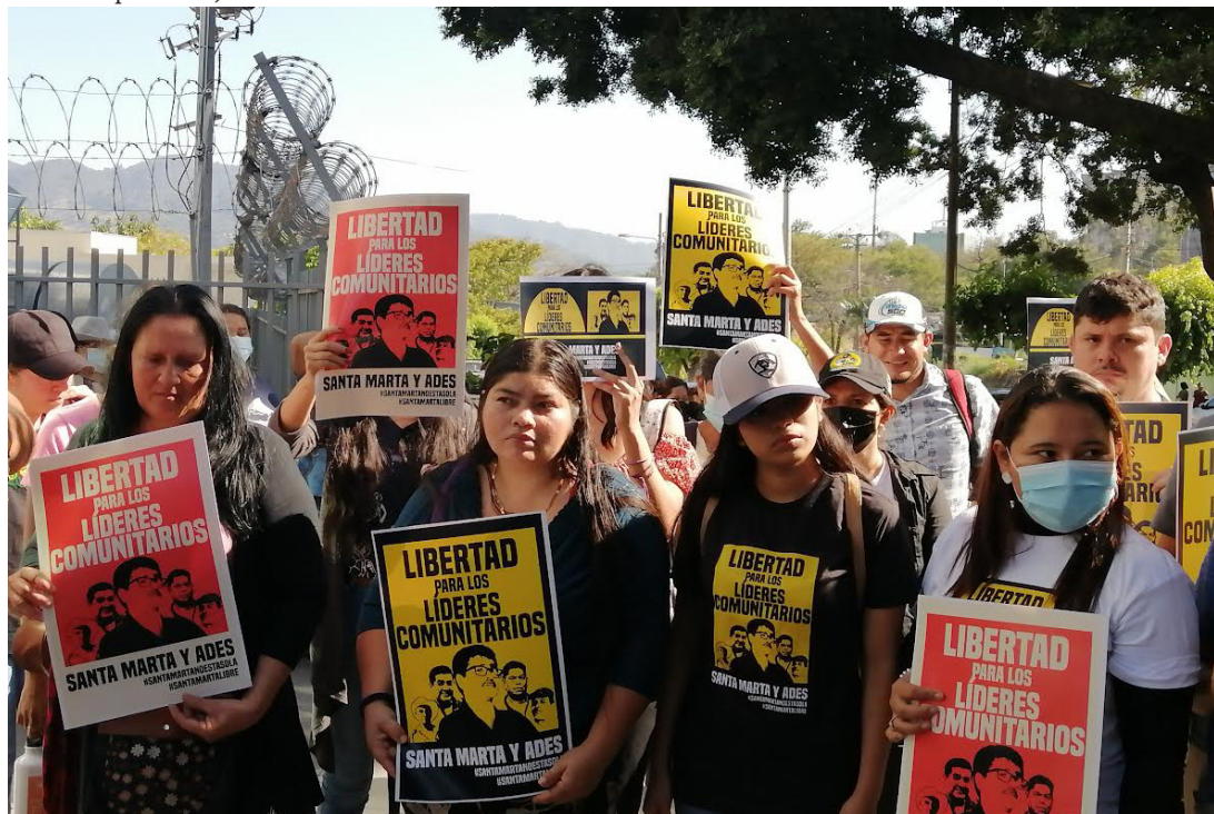
La población de Comunidad Santa Marta - ADES, se concentran en las afueras del Centro Judicial Integrado de Segunda Instancia de San Salvador, para exigir un proceso legal y transparente con los líderes comunitarios detenidos el pasado 11 de enero.

Otro de los cuestionamientos al requerimiento fiscal es sobre la participación de un “testigo en régimen de protección”. Esta persona dio declaraciones que plantean su participación como un “testigo criteriado”, y solo por esta imprecisión fiscal “ese testimonio debió ser nulo”.