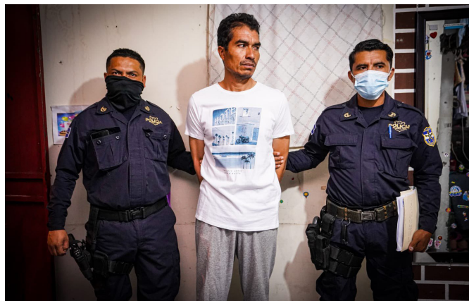
Los capturados serán procesados por el delito de Posesión y Tenencia de Pornografía Infantil.

En el allanamiento se incautaron diferentes dispositivos telefónicos que, al hacer la extracción de la información, se les encontró grupos en WhatsApp y en Viber donde se intercambian material pornográfico infantil.