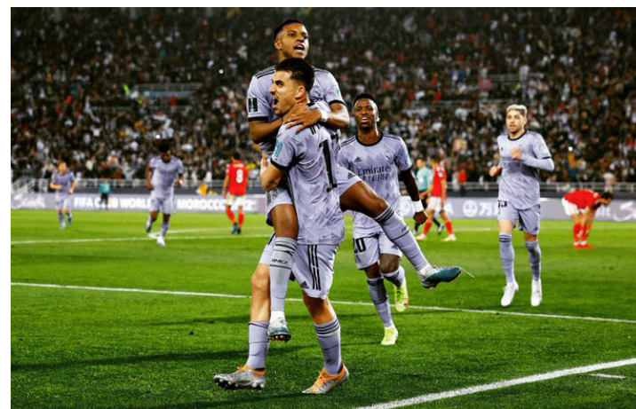
El Real Madrid vence al Al-Ahly y se enfrentará a Flamengo este sábado en la final del Mundial de Clubes.

Sobre el final del partido, el árbitro sentenció a los africanos a penal a favor de los españoles, por una aparente falta en el área sobre Vinicius, pero Modric no pudo concretar el gol en la portería y en lo que se suponía que el marcador quedaría 1-2, Rodrigo apareció a los 90+2, para colocar el 1-3, y Sergio Arribas incrementó la ventaja