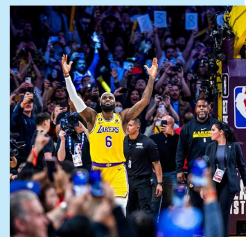
LeBron James es el nuevo jugador de la NBA con la mayor puntuación en la historia del deporte.

LeBron James sumó a su lista de palmares cuatro anillos de 2012, 2013, 2016 y 2020 como MVP de las finales de la NBA y de las temporadas de 2009, 2010, 2012 y 2013.