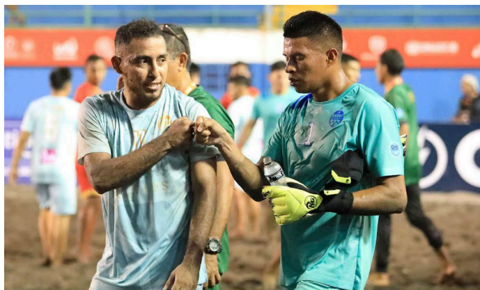
Chirilagua en el primer día de la Americas Winners Cup 2023, celebrada en la playa Costa del Sol.

Barra de Santiago debuta con victoria ante.