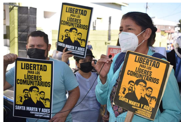
Fiscalía General de la República, demanda el retiro de magistrado de la Cámara de lo Penal, alegando parentesco con una exfuncionaria del partido FMLN, sin pruebas fehacientes.

La alcaldía gestionará el próximo ingreso de estos vendedores al Sistema de Mercados Municipales, para que continúen ejerciendo sus labores, dejando atrás la informalidad.