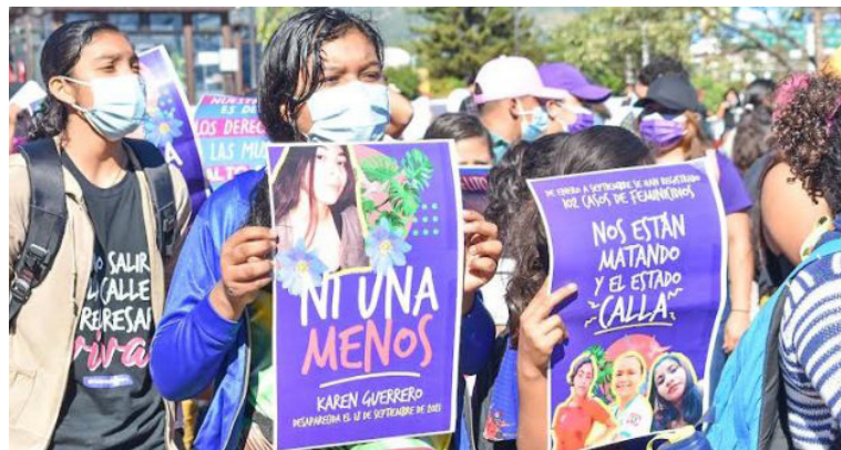
Esta actividad cultural se enmarca en la conmemoración del 8 de marzo, Día Internacional de la Mujer y el 24 de marzo, Día Internacional del Derecho a la Verdad.

“Esta muestra es una oportunidad para reflexionar sobre los impactos diferenciados que