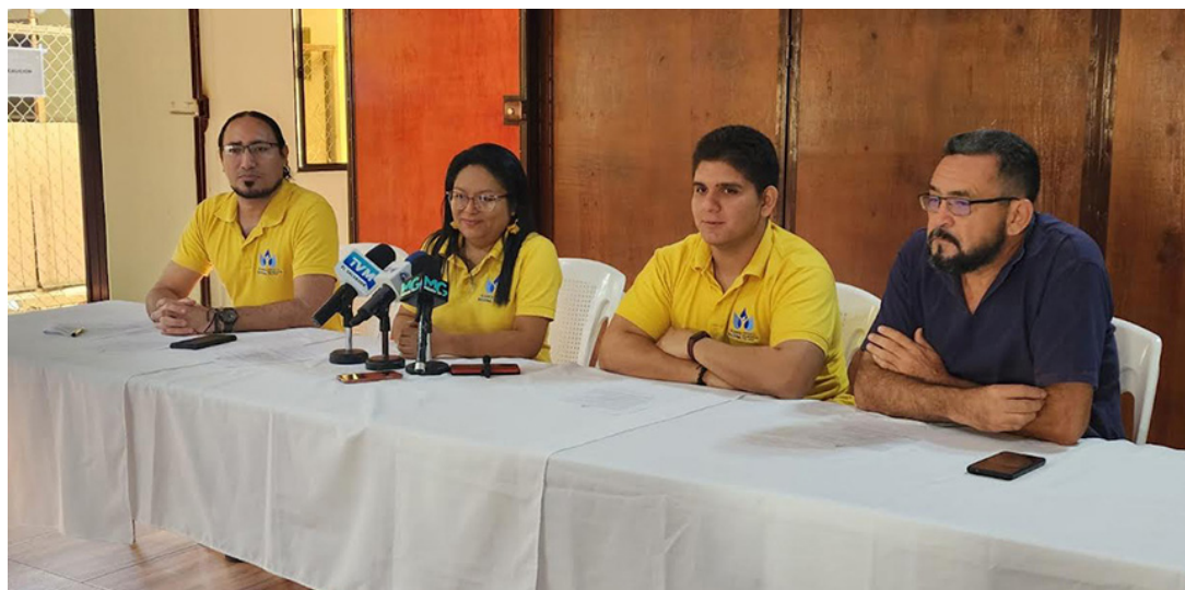
Integrantes de la Alianza Nacional contra la Privatización del Agua, exigen a la ASA, cumplir con la normativa de la Ley General de Recursos Hídricos, exonerando de impuestos a las Juntas Comunitarias de Agua.

“Existe la ausencia de la representación de la población en la ASA, esto ha generalizado el descontento de líderes comunitarios de las Juntas Rurales de Agua. Porque es inconcebible que a la gran industria no se le