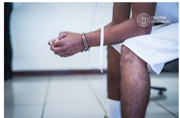
El imputado aprovechaba la vulnerabilidad y soledad que rodeaba a la víctima para tocarla, a cambio del silencio de su víctima le ofreció dulces y juguetes.

Hasta la fecha, debe 1,580 dólares. Aparentemente, David Alberto