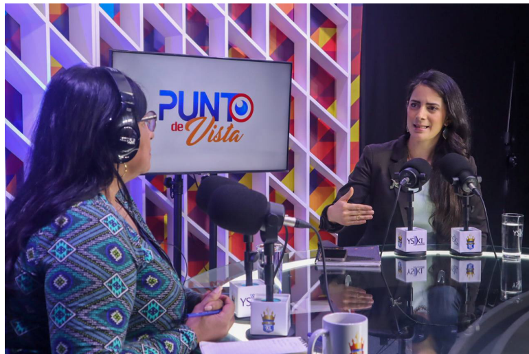
La diputada por el partido Vamos, Claudia Ortiz considera que el Gobierno debe tomar acción ante el alza de precios.

“El problema es que en la casa del pueblo (como dice el oficialismo) no se les deja entrar (a salvadoreños y organizaciones de la sociedad civil), no se les escucha o se les retira, como