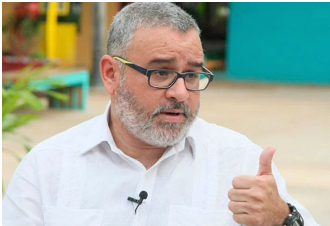
Mauricio Funes fue presidente de El Salvador desde el 1 de junio de 2009 al 31 de mayo de 2014, bajo la bandera del Frente Farabundo Martí para la Liberación Nacional (FMLN).

El expresidente de la República, Mauricio Funes, reveló, a través de sus redes sociales que una empresa de telefonía sobornó a diputados de derecha para que promovieran un decreto de aumento del cargo básico que cobraban las telefonías; ya que dicho aumento requería de aprobación legislativa. Esto según Funes sucedió durante su quinquenio y que el FMLN se opuso.