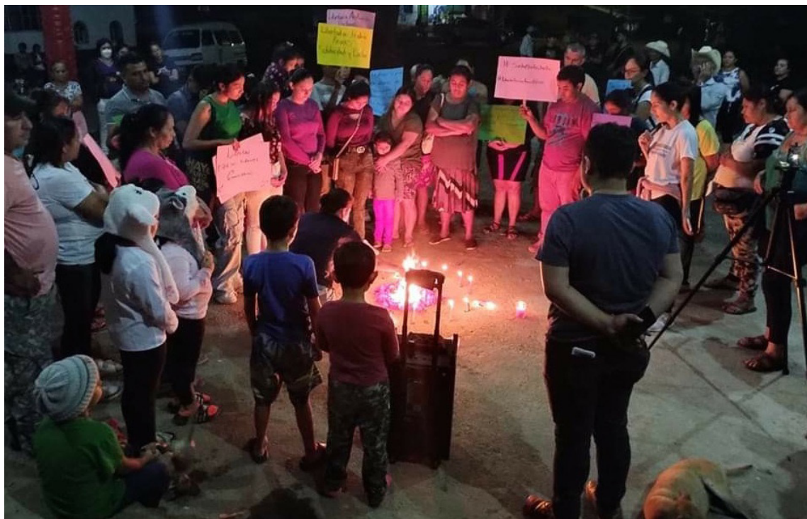
Comunidad Santa Marta realizó una vigilia en defensa de sus integrantes y de los directivos de ADES, quienes guardan prisión por un caso preparado por la Fiscalía General de la República, por un crimen supuestamente, de una persona durante el conflicto armado.