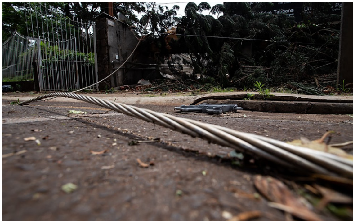
Si ante un evento sísmico se desprende un cable del tendido eléctrico, AES recomienda no tocarlo y llamar a la empresa distribuidora de energía para informar la situación.