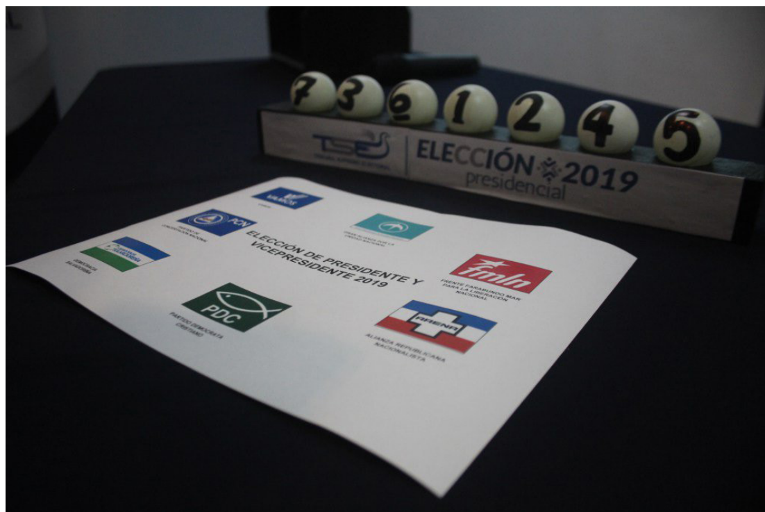
La próxima contienda electoral será catalogada por muchos como “arbitraria”, ya que competirá para un nuevo periodo, el presidente de la República.

La popularidad del presidente Bukele continúa alta: 8.37 es la nota promedio en una escala de 1 a 10 al cierre de 2022, una elevación de 0,83 puntos en comparación con 2021, según la UCA. Su partido, Nuevas Ideas, encabeza las simpatías con 33,9 por ciento de los consultados, más de 30 puntos de ventaja del segundo lugar, la Alianza Republicana Nacionalista (ARENA), con 2,0 por ciento, y el tercero, el FMLN, 1,3.