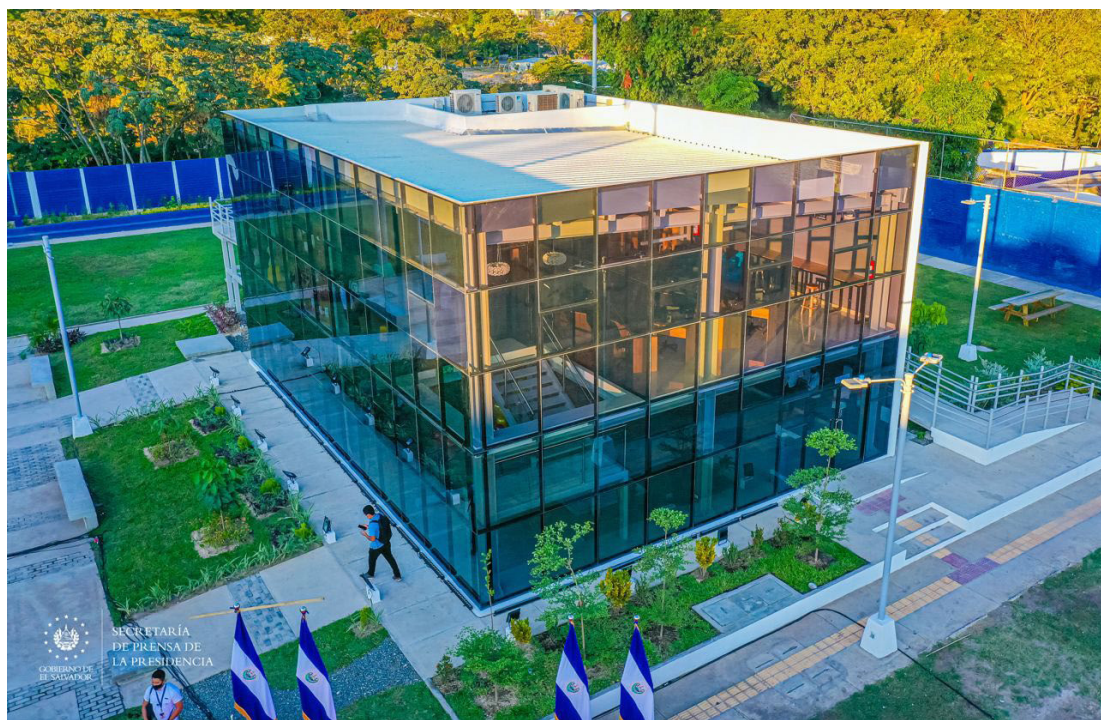
Los CUBOs son espacios pensados para que los jóvenes que residen en zonas de las más vulnerables del país, y en riesgo por pandillas, ocupen su tiempo en actividades productivas y de sano esparcimiento.

Sobre la última encuesta del Instituto Universitario de Opi-