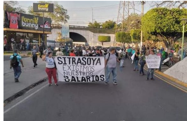
El Sindicato de Trabajadores de la Alcaldía de Soyapango (SITRASOYA) participan en una marcha por el incumplimiento de la institución de sus salarios, represión y estado en el que se encuentra sus familias por temor al Régimen de Excepción.

Sobre los sindicalistas capturados aún no se conocen detalles sobre su proceso. Sin embargo, los trabajadores reconocieron que las condiciones para los detenidos son deplorables, un contraste radical con la situación que vive la ex alcaldesa Nercy Montano, quien mostró un aspecto diferente al que cualquier detenido puede mostrar tras vestir con un look extravagante al