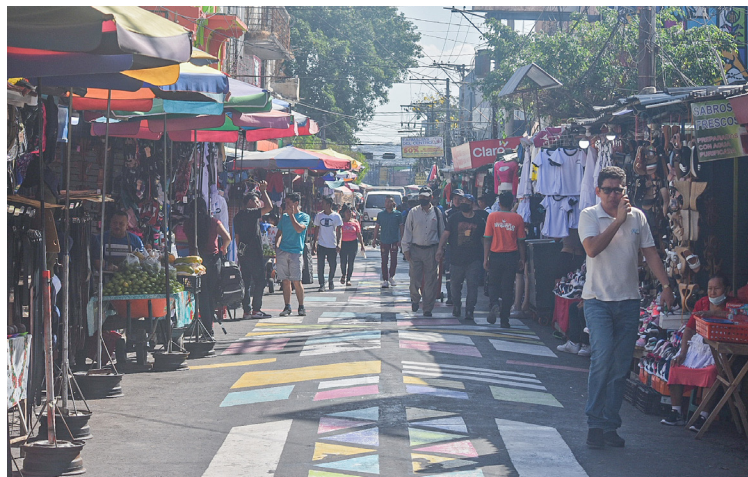
Los puestos de ventas sobre la Calle Delgado tendrán que ser desalojados, ya que la comuna pretende intervenirla como parte del plan de revitalización del Centro Histórico.

El año pasado, la Alcaldía de San Salvador desalojó a un aproximado de 3,000 vendedores de la Calle Rubén Darío y de la 1ª, 3ª, 4ª y 5ª Avenida Norte, parte de ellos se trasladaron al mercado Hula Hula, al menos a unos 800.