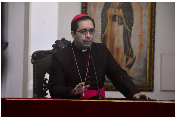
El arzobispo de San Salvador, José Luis Escobar Alas, señala que los cubos son programas “tímidos” para los jóvenes.

“El dato de la encuesta es muy sugerente e importante de tenerlo en cuenta; es el momento de trabajar intensamente por la economía del país”,