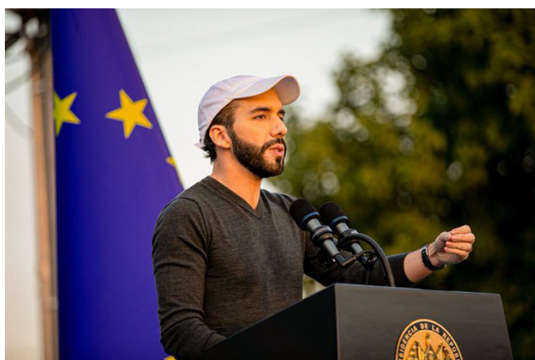
El jefe de Estado informó que el régimen de excepción durará “lo que tenga de durar”. Fue el 27 de marzo de 2022 que se implantó en el país para combatir “frontalmente” a las pandillas.

centes los que están en la cárcel, cómo explican que desaparecieron los homicidios, si estuvieran los pandilleros en las calles estuvieran cometiendo homicidios”, comentó Bukele; sin embargo,