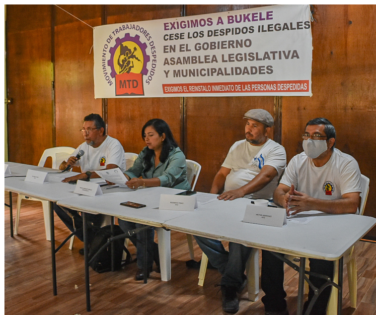
Organizaciones denuncian violaciones a los derechos laborales hacia empleados del sector público, entre ellos: de alcaldías, Órgano Legislativo y Ejecutivo.

ron los despidos injustificados, deudas salariales, aguinaldos y bonos en aproximadamente 11 alcaldías de Nuevas Ideas, entre ellas la de Soyapango, en las cuales miembros del sindicato de la municipalidad denunciaron la captura de tres dirigentes, por exi-