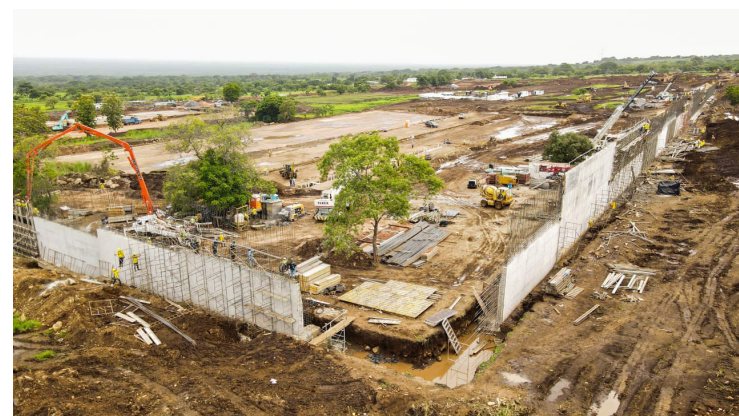
Los proyectos estatales que implican fondos públicos son regulados por la LACAP; sin embargo, el Gobierno de Bukele se ha saltado dicho proceso para acortar tiempos, un ejemplo de ello, es el megapenal para detenidos bajo el régimen de Excepción.

En síntesis, las contrataciones de la administración pública se realizarán conforme a lo que disponga la nueva ley. Quedarán sujetos, las contrataciones del Estado, sus dependencias, organismos auxilia-