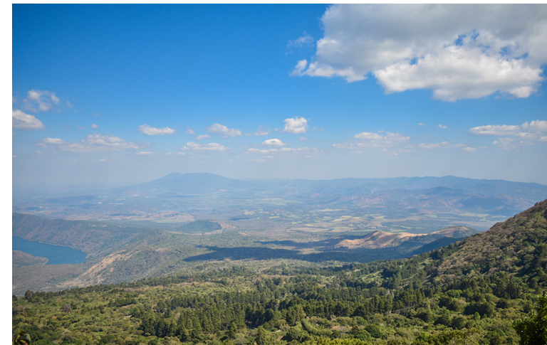
El Salvador por su ubicación es uno de los países más propensos a que ocurran desastres naturales.