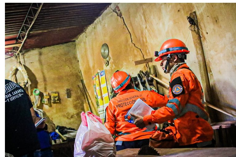
El Ministerio de Medio Ambiente y Recursos Naturales detalla que la cifra de sismos registradas en la serie sísmica del 15 al 18 de enero sobrepasó los 425 temblores.