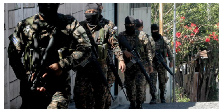
El Gobierno de Nayib Bukele le ha dado facultades a la Fuerza Armada de El Salvador para brindar seguridad ciudadana, este trabajo le corresponde a la PNC.

El gobierno ha capturado en los últimos días a sindicalistas de la Alcaldía de Soyapango, líderes de la comunidad Santa Marta en Cabañas y en esta semana a campesinos de Zacatecoluca.