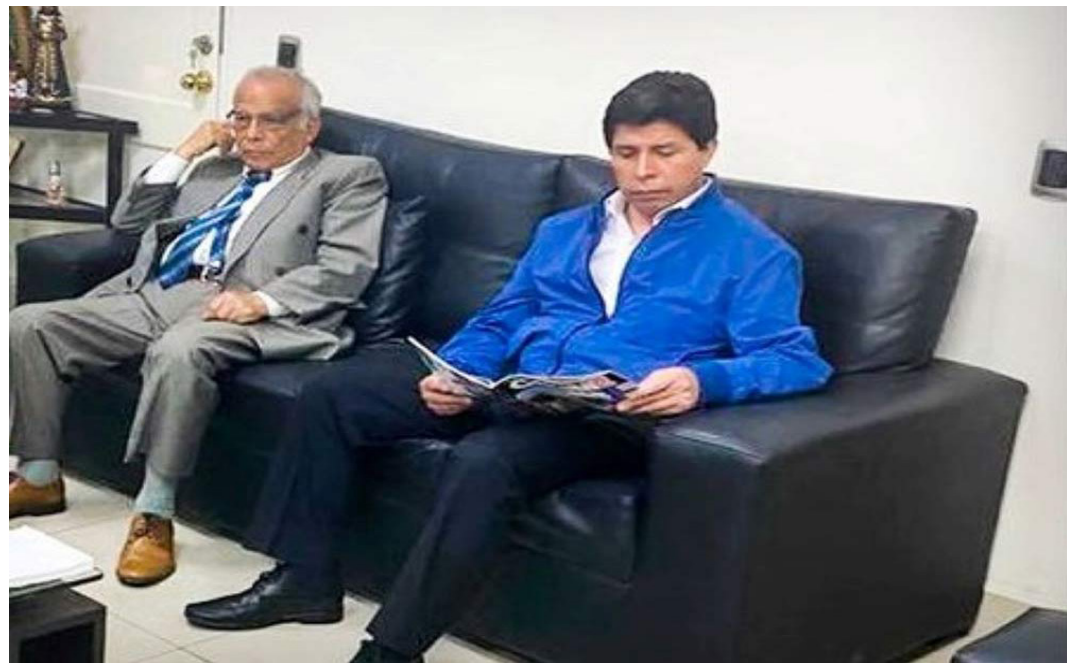
Pedro Castillo, derecha, expresidente de Perú.

“Yo no he matado, no he robado ni he violado a nadie. Si tengo que rendir cuentas, en honor a la verdad, lo haré siempre aquí y nunca he tenido ni siquiera la menor idea de salir de este país porque he estado asumiendo el mandato mas importante y mas sagrado que me ha