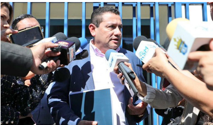
Según el ministro de Trabajo, Rolando Castro, en los avisos se presentan evidencia donde más de 100 mil trabajadores están siendo afectados porque no son enviadas las retenciones legales.

“Desde el momento que se quedan de forma indebida este dinero, es una apropiación y constituye no solo una falta administrativa sino un delito de carácter penal”, concluyó Castro.