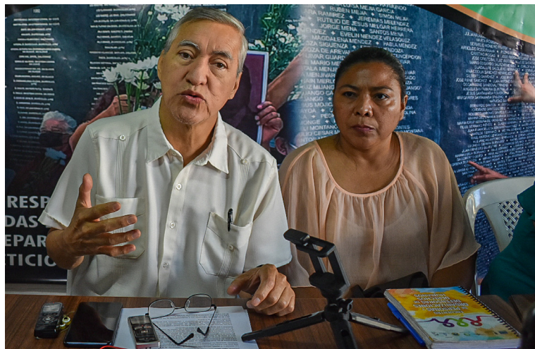
La Comisión de Trabajo en Derechos Humanos Pro-Memoria Histórica de El Salvador instó al Gobierno de Nayib Bukele a asumir con responsabilidad la herencia de los Acuerdos de Paz.

“Creemos que esos acuerdos marcaron un antes y un después de este país. No eran la solución total de la problemática de nuestro pueblo, pero si era un verdadero punto de partida a una situación más democrática para alcanzar los anhelos del pueblo. Hay que hacer una diferenciación del espíritu de los acuerdos que está en el documento