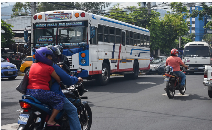
Con la cooperación se espera obtener una evaluación integral y la información necesaria que permita modernizar el sistema existente de transporte por autobuses, según plantea el BCIE.

De momento, el Ministerio de Obras Públicas no ha brindado mayores detalles sobre este proyecto.