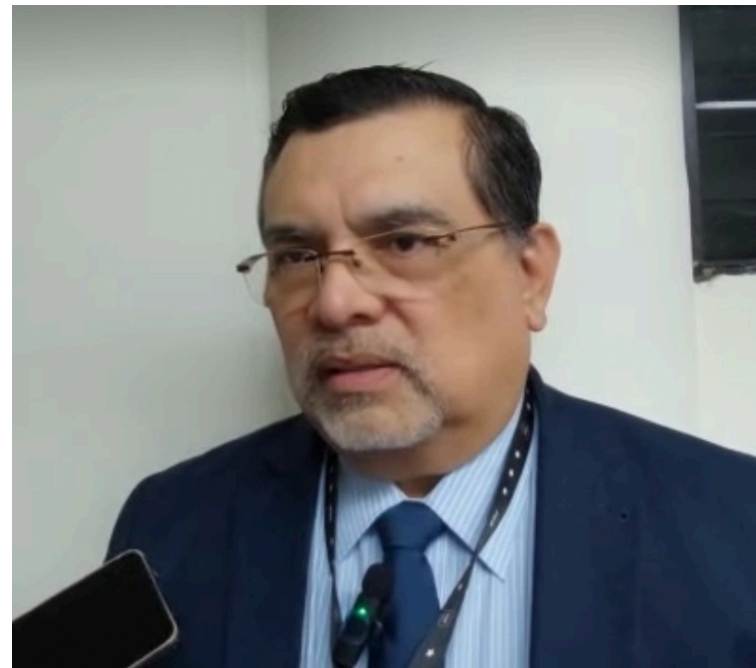
La Fiscalía General de la República presenta el requerimiento contra los líderes de ADES Santa Marta, capturados el pasado 11 de enero en horas de la madrugada.

“El conflicto se dio por este tipo de situaciones (contra la sociedad civil), entonces, queremos que las instituciones operen de manera transparente y sigan