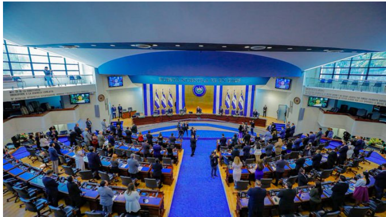
La Asamblea Legislativa mantiene engavetada la propuesta de Ley de Justicia Transicional la cual ha sido presentada por las víctimas; sin embargo, su discusión no avanza en el Congreso.

Habrà que recordar que el 11 de enero 2022, los diputados de Nuevas Ideas declararon el 16 de enero de cada año, como "Día Nacional de las Víctimas del Conflicto Armado" como una forma de "reconocimiento" a todas las personas que ofendieron sus vidas durante la guerra civil, así como a las personas que sufrieron la pérdida de sus familiares. Con el mismo, se derogó el un decreto legislativo del 1 de diciembre de 1993 y