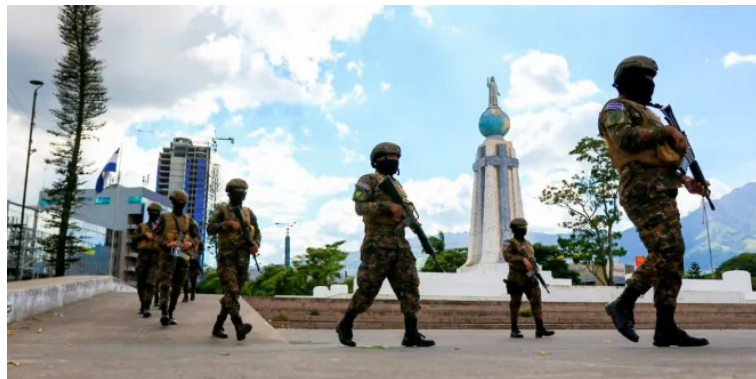
Militares han tomado protagonismo en la seguridad pública, esto en el Gobierno de Bukele que ha ordenado duplicar los efectivos de la institución.

Para el legislador, es importante no solo conmemorar y reflexionar los Acuerdos de Paz, sino que también, se debe retomar "la valiosa historia y aprendizaje que tristemente estamos volviendo a repetir los errores del pasado".