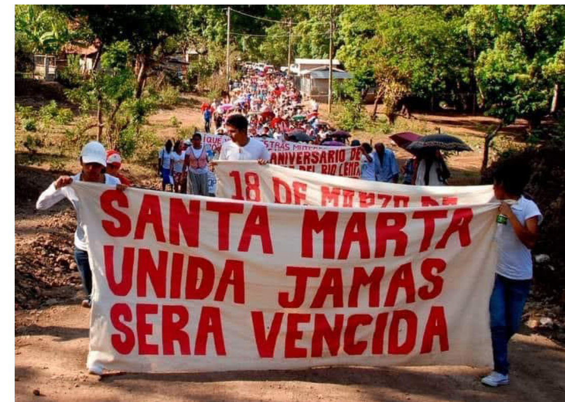
Con el IPS con sede en la ciudad de Washington, diversos colectivos, movimientos sociales y agrupaciones populares se pronunciaron sobre la detención de los miembros de la comunidad Santa Marta y ADES.

Así como el IPS con sede en la ciudad de Washington, diversos colectivos, movimientos sociales y agrupaciones populares se pronunciaron sobre la detención de los miembros de la comuni-