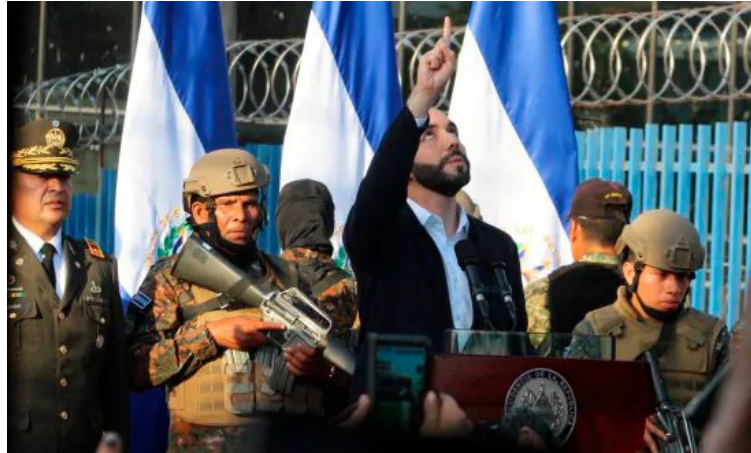
Presidente Nayib Bukele en las afueras de la Asamblea Legislativa luego del intento de golpe de Estado el 9 de febrero de 2020.

Human Rights Watch en su balance de 2022 sobre El Salvador concluyó que el presidente de la República, Nayib Bukele y sus aliados en la Asamblea Legislativa han desmantelado reiteradamente el sistema de contrapesos democráticos; una de ellas fue el anuncio en septiembre, donde Bukele hizo público que buscará la reelección en 2024, a pesar de que la Constitución prohíbe la reelección inmediata.