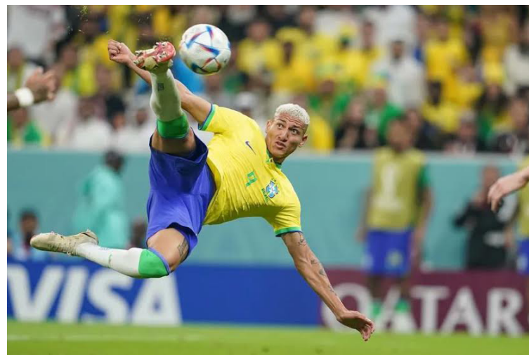
El gol de Richarlison de la selección de Brasil ante Serbia en la fase de grupos de la Copa Mundo Catar 2022 entre los nominados al Puskás.