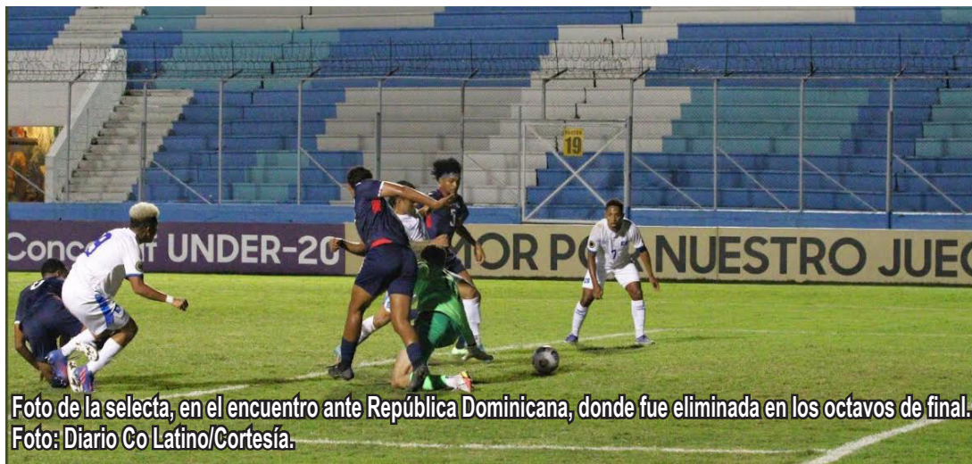
Foto de la selecta, en el encuentro ante República Dominicana, donde fue eliminada en los octavos de final.

El miércoles, el presidente del INDES afirmó en una conferencia de prensa que Centro Caribe Sports, encargado de los Centroamericanos y del Caribe, confirmaron que la selección sub-20 participaría en