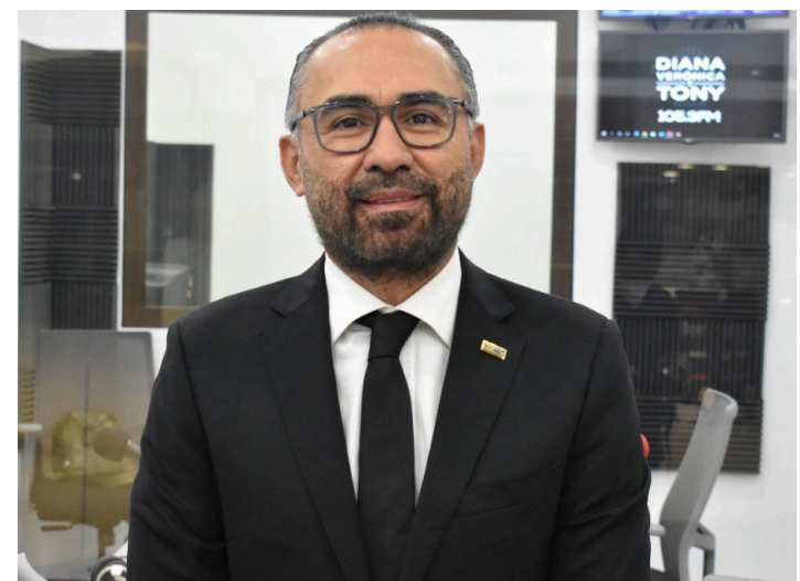
El magistrado del TSE, Noel Orellana, informa que el 3 de febrero es el último día para hacer el cambio de residencia en el DUI, y que el Tribunal pueda incorporar la nueva dirección en el Padrón Electoral.

aprobado por el Organismo Colegiado del TSE, para la elección de presidente y vicepresidente de la República y diputados a la Asamblea Legislativa a celebrarse el 4 de febrero de 2024 y para la elección de diputados al Parlamento Centroamericano e integrantes de concejos municipales a celebrarse el 3 de marzo de 2024, por lo cual, la modificación de residencia de ciudadanos se suspen-