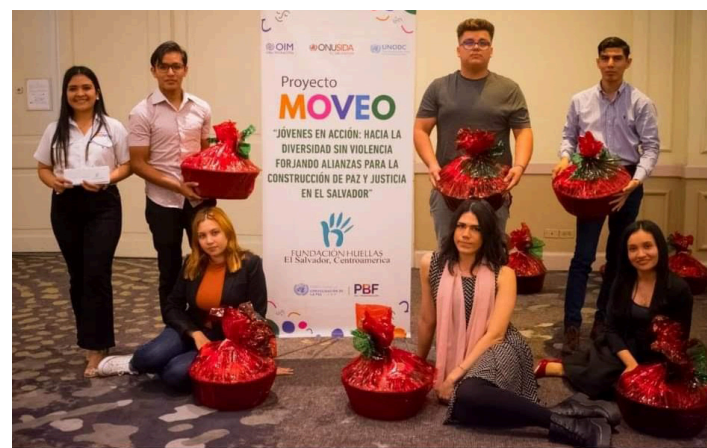
Jóvenes participantes del Programa MOVEO, son reconocidos por el Sistema de Naciones Unidas, como nuevos líderes juveniles que trabajarán en sus municipios.

Al finalizar su formación en la “Escuela de Liderazgo”, los jóvenes