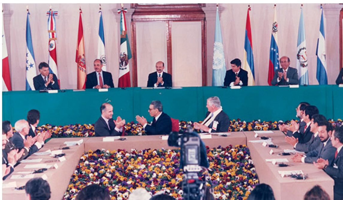
Los Acuerdos de paz firmados en 1992 y los cambios ganados por el pueblo significan un cambio de era, un antes y un después en la historia nacional.

“El militarismo era muy fuerte en los años 60, 70 y eso llevaba a que el pueblo y las organizaciones populares se manifestaran, hubo mucha actividad política y pública